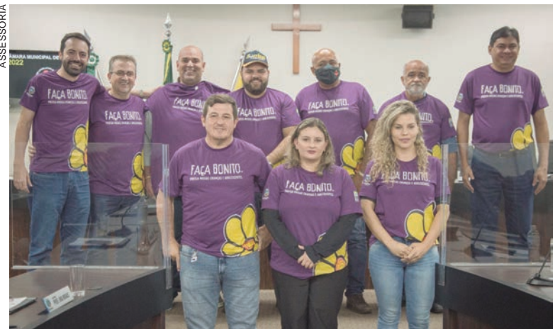
VEREADORES de Umuarama literalmente vestiram a camisa da campanha desenvolvida na cidade no combate aos crimes e abusos sexuais contra crianças e adolescentes

Em se tratando da pauta da sessão da segunda (16), estavam três projetos para deliberação em plenário, um deles aberto ao recebimento