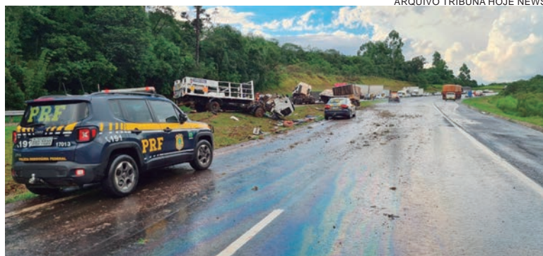
MINAS Gerais teve o maior número de acidentes com 8.308 692 mortos. Santa Catarina e Paraná vêm em seguida, com um total de 7.882 e 7.330 acidentes, respectivamente

“O modelo de combate ao crime organizado na forma de força-tarefa entre instituições é uma necessidade na segurança pública moderna e não mediremos esforços para reconstituir uma equipe de trabalho unindo as agências de segurança estaduais e