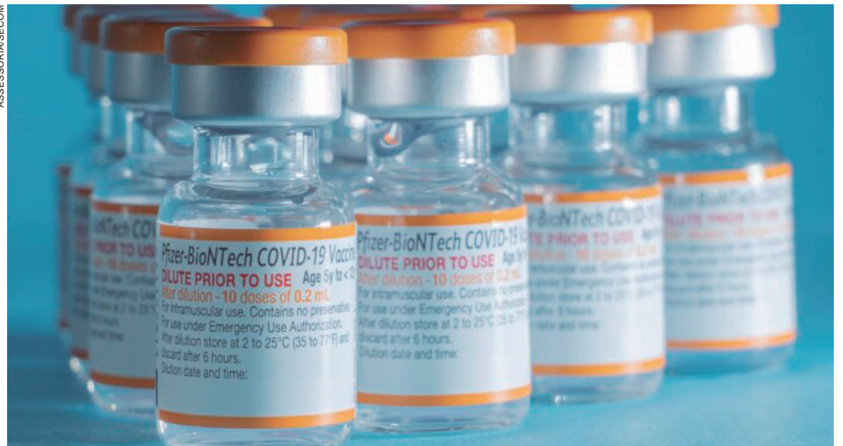
O cronograma inclui a vacinação de crianças, adultos e idosos, com todas as doses do Programa Nacional de Imunização, enquanto houver doses de vacina