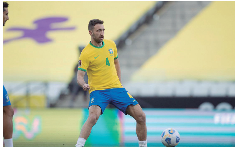
ZAGUEIRO poderá atuar nos amistosos contra Japão e Coreia do Sul

Os últimos jogos do Brasil antes da Copa do Mundo – a abertura será em 21 de novembro – serão em setembro, contra a Argentina (reposição do jogo das Eliminatórias) e o México.