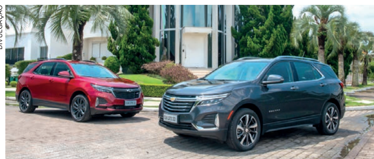
O Novo Equinox começa a chegar na rede de concessionárias Chevrolet do país a partir de meados de junho nas versões Premier e a inédita RS

O Novo Equinox começa a chegar na rede de concessionárias Chevrolet do país a partir de meados de junho em duas configurações: Premier com tração integral AWD e a inédita RS. Ambas são muito bem equipadas e oferecem uma ampla lista de itens comodidade e de segurança, como alerta de colisão frontal com detecção de pedestre e frenagem autônoma de emergência, alerta de ponto cego com sensor de aproximação repentina, alerta de movimentação traseira, alerta vibratório de segurança no banco do motorista e alerta de esquecimento de pessoas ou objetos no banco traseiro.