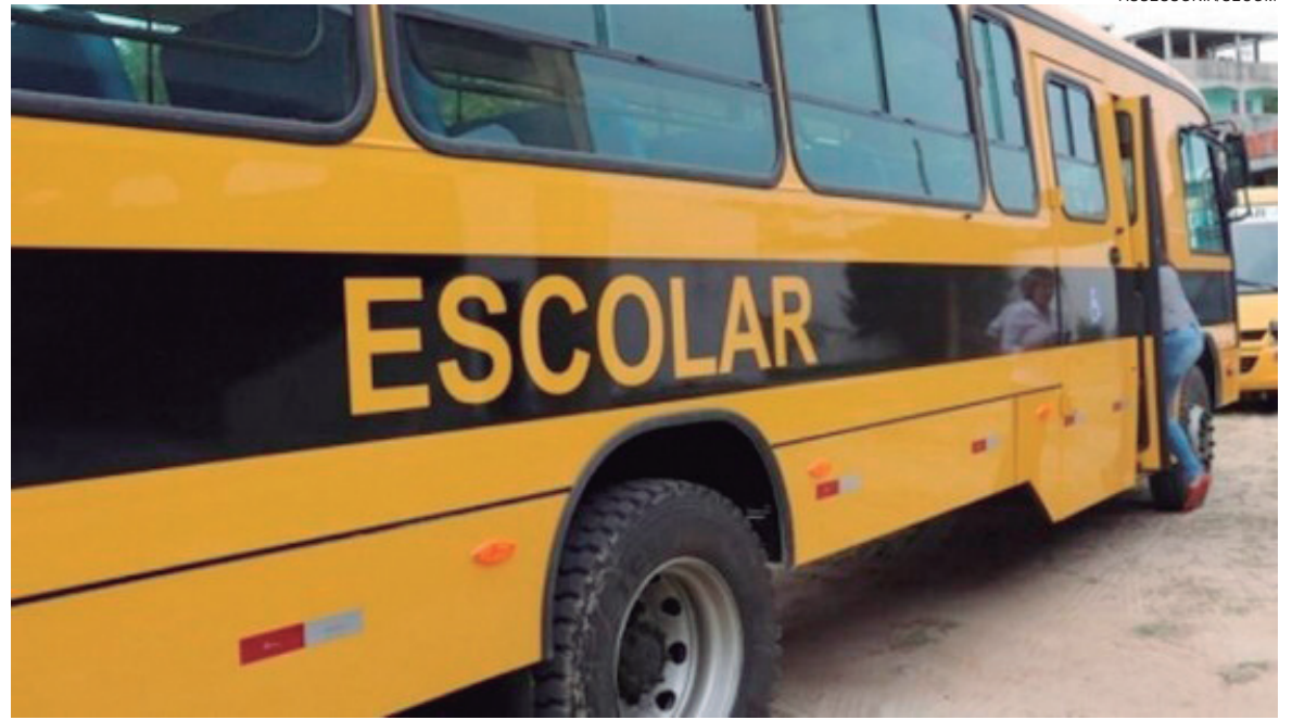
SECRETARIA Municipal de Educação assumiu o transporte com frota própria e suspendeu unilateralmente o contrato, inicialmente por 60 dias

A Amabs pode também optar pela rescisão imediata