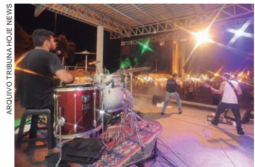
OS terceiros colocados ganham R$ 1,3 mil, os segundos colocados R$ 2 mil e os primeiros colocados R$ 2,7 mil

As eliminatórias serão entre os dias 16 e 18 de junho, no teatro do Centro Cultural Vera Schubert, e a final, reunindo os cinco melhores de cada gênero, está prevista para dia 19 de junho, também no mesmo local. “Quem quiser mais detalhes pode entrar em contato pelo telefone (44)