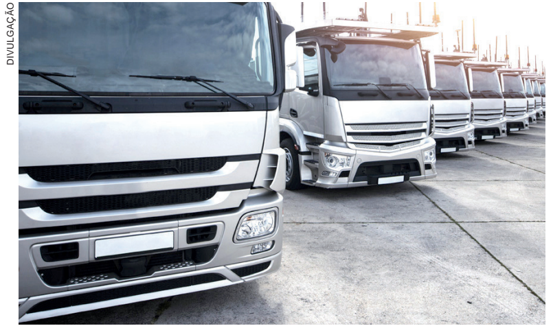
O checklist diário reduz o número de caminhões parados por manutenção e os gastos com manutenções fora de hora

se os modos ‘alto’ e ‘baixo’ estão ok. Também, a luz de ré, se está funcionando e se o freio está em perfeito funcionamento”, lista o CEO. Entram no checklist os alertas de painel; a validade da bateria; os retrovisores em bom estado; a validade e o nível do óleo do motor; o nível da água e o fluído do radiador; o óleo de freio; a sondagem sobre vazamentos de óleo e água; o freio de emergência em perfeito funcionamento; o estado das mangueiras; os filtros; e as condições dos para-brisas. “O estado dos pneus também é item valioso do checklist. Pneus sujos aumentam o