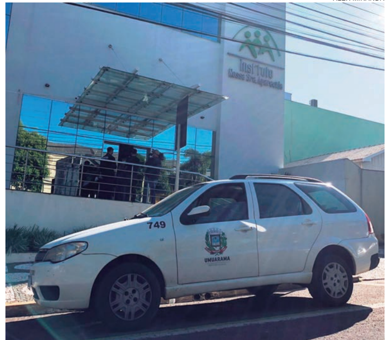
HOSPITAL passou por vistoria de agentes da Vigilância Sanitária na tarde de ontem que levou à interdição