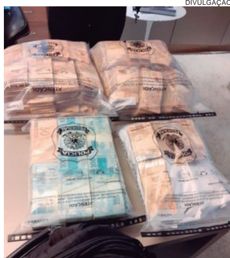
POLICIAIS Federais apreenderam R$ 930 mil em espécie, sob suspeita de origem ilícita

indícios de participação de magistrados, advogados e empresários devedores do Fisco Federal em supostas irregularidades “em ações em curso na Justiça Federal entre 2012 a 2016 e que resultaram em prejuízo bilionário aos cofres da União”.