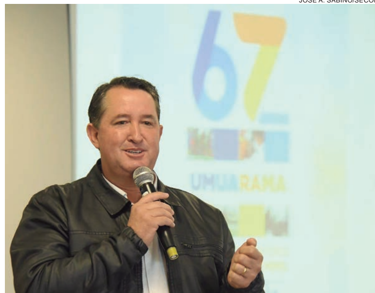
O prefeito Hermes Pimentel fez o anúncio oficial das atividades em reunião com profissionais e veículos da imprensa

Em 11 anos de realização, a Campanha E-Lixo já arrecadou quase 140 toneladas de equipamentos eletrônicos inservíveis, que deixaram de ser jogados na natureza e ainda foram reaproveitados em projetos educacionais e sociais. Será na quinta-feira (9) das 8h às 16h,