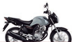
3º Prêmio: Motocicleta CG 160cc START - Ano/Modelo 2022