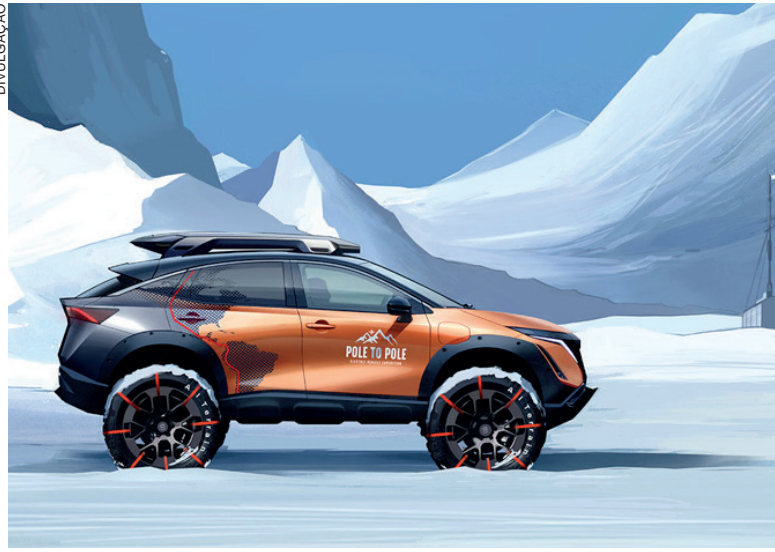
O Ariya é um SUV 100% elétrico que permite que você vá ainda mais longe, com mais conforto e praticidade

A Nissan anunciou ontem uma parceria com o aventureiro britânico Chris Ramsey, que vai comandar a primeira expedição totalmente elétrica já realizada no mundo entre o Polo Norte e o Polo Sul.