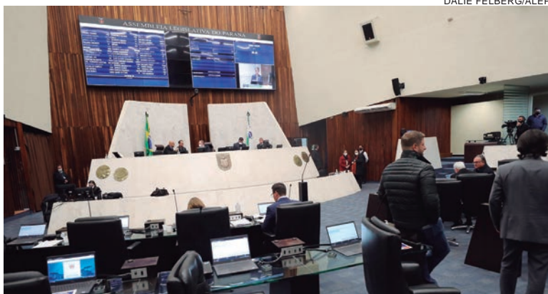
Parlamentares argumentam que a norma extrapola a competência do Estado para legislar sobre a proteção e a defesa da saúde

No âmbito da inconstitucionalidade formal, os