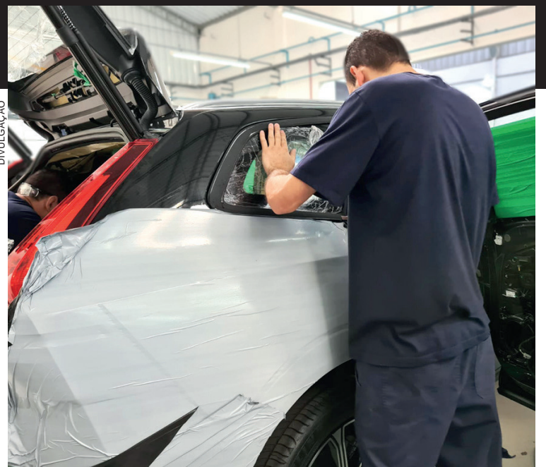
O desenvolvimento de novas tecnologias na constituição do fio de aramida possibilitou uma grande redução no peso total de um veículo blindado

Os vidros Ballistic Pro trazem para o mercado o conceito de peso específico, oriundo da física e da engenharia, que trabalha com a medida de kg/m 2 . Para um melhor entendimento, Ehmke compara as áreas envidraçadas dos SUV VW T-Cross e BMW X5. “Um vidro de porta de uma X5 tem 0,612m 2 de