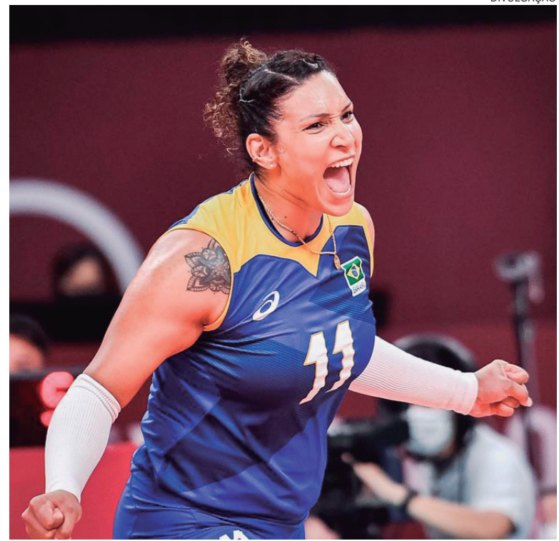
JOGADORA foi punida por consumo de substância anabolizante proibida

Como a punição é retroativa à data da coleta, a oposta de 33 anos está impedida de jogar até julho de 2025, quando terá 37 anos. Se não reverter a punição no TJD-AD, ela ainda poderá apelar à Corte Arbitral do Esporte (CAS, na sigla em inglês). Caso a pena seja cumprida na íntegra, ela perderá a Olimpíada de Paris (França), em 2024.