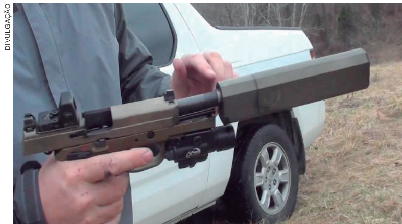
SEGUNDO a magistrada, o Exército “se utilizou de conceitos jurídicos abstratos e não demonstrou qualquer dano ou perigo à segurança”

a empresa argumentou que queria a liberação do Exército para que ela tivesse “um produto exclusivo que a faça se tornar mais competitiva em um mercado restrito e em situação de pandemia”.