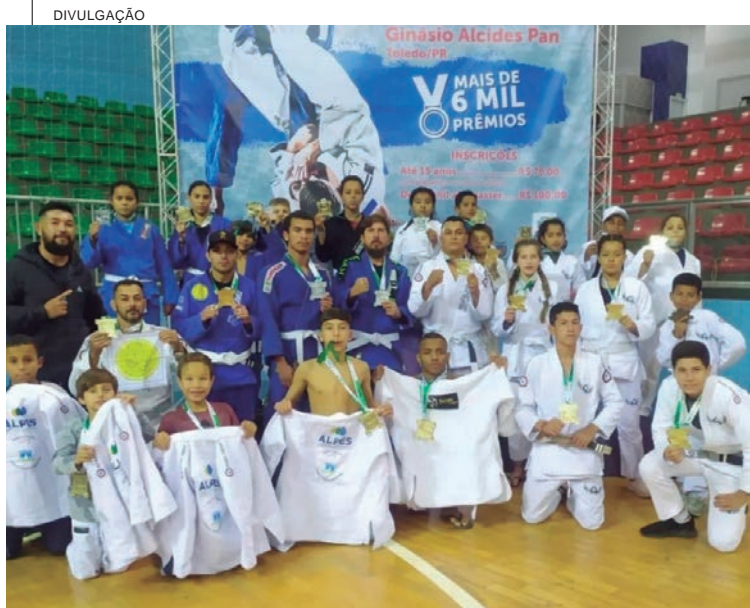
Alunos do projeto Anjos do Tatame participaram da Copa Paraná de Jiu-Jitsu no último domingo (22) e garantiram ótimos resultados. O projeto Anjos do Tatame é realizado pela Associação Vida e Solidariedade do Parque Industrial e oferece aulas para crianças e adolescentes de forma gratuita em Umuarama. Oito atletas subiram ao pódio e garantiram medalhas para Umuarama. A competição aconteceu em Toledo e reuniu centenas de atletas do Paraná.