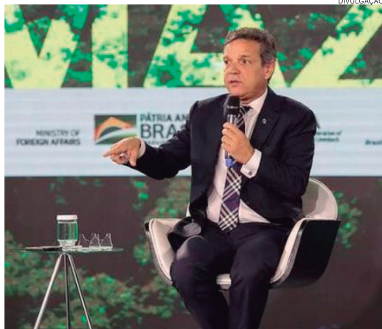
A indicação de Paes de Andrade ainda precisa ser aprovada pelo Conselho de Administração da Petrobras

José Mauro Ferreira Coelho foi indicado para o posto pelo então ministro de Minas e Energia Bento Albuquerque, exonerado no dia 11 de maio. Em seu lugar, assumiu a pasta Adolfo Sachsida, aliado do chefe da Economia, Paulo