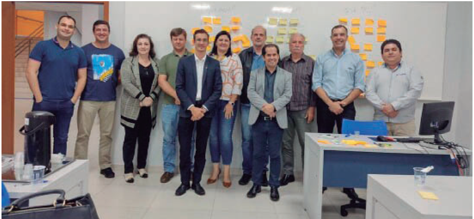
REPRESENTANTES de instituições de ensino superior, da Aciu, da administração municipal e do Sebrae, participaram da reunião