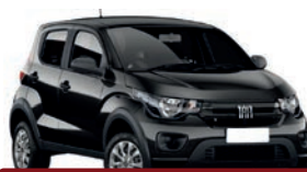
2º Prêmio: Fiat Mobi EASY 1.0 FLEX MANUAL, Ano 2021, Modelo 2022