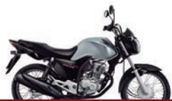
3º Prêmio: Motocicleta CG 160cc START - Ano/Modelo 2022