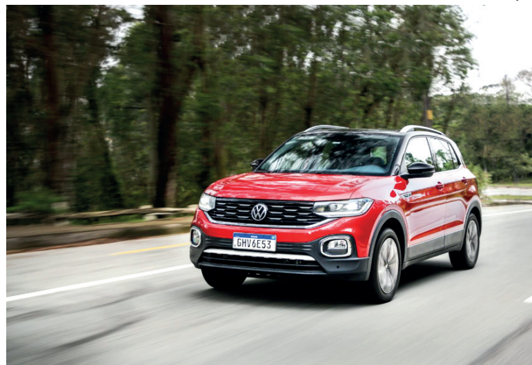
Produzido em São José dos Pinhais, no Paraná, o T-Cross mostra que é referência em performance, design, espaço interno e também em custo/benefício

Produzido na planta de São José dos Pinhais (PR), o modelo é exportado para mais de 20 países das Américas do Sul e Central e para a África. Com equipamentos high-level, ele sai de fábrica com com ACC (Controle de Cruzeiro Adaptativo) e AEB (Autonomous Emergency Brake / Frenagem Autônoma de Emergência) de série a partir da versão 200 TSI. Na