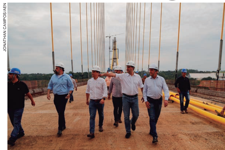
RATINHO Junior vistoriou a obra, que chega ao final de maio com 84% de execução

Com a obra concluída, todo o transporte de cargas entre os dois países será feito pela nova passagem, tirando o trânsito pesado da Ponte da Amizade e liberando o local para atender somente turistas e passageiros. “Esta obra vai transformar a logística entre o Brasil e o Paraguai a partir de Foz do Iguaçu. A Ponte da Amizade, construída há mais de 50 anos,