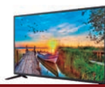
4º Prêmio: Televisor 43'