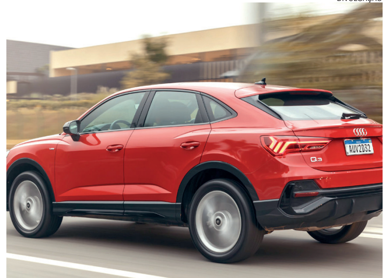
Com motor 2.0 TFSI de 231 cv e nota máxima em segurança, o Q3 Sportback tem preços a partir de R$ 315.990,00

Na lateral, o caimento do teto levemente inclinado e a linha de cintura transmitem a sensação de que o veículo é mais comprido até mesmo que o seu irmão Q3 SUV, proporcionando um efeito visual interessante, embora a diferença no comprimento deles seja de apenas 16 milímetros. Os vincos marcantes na parte