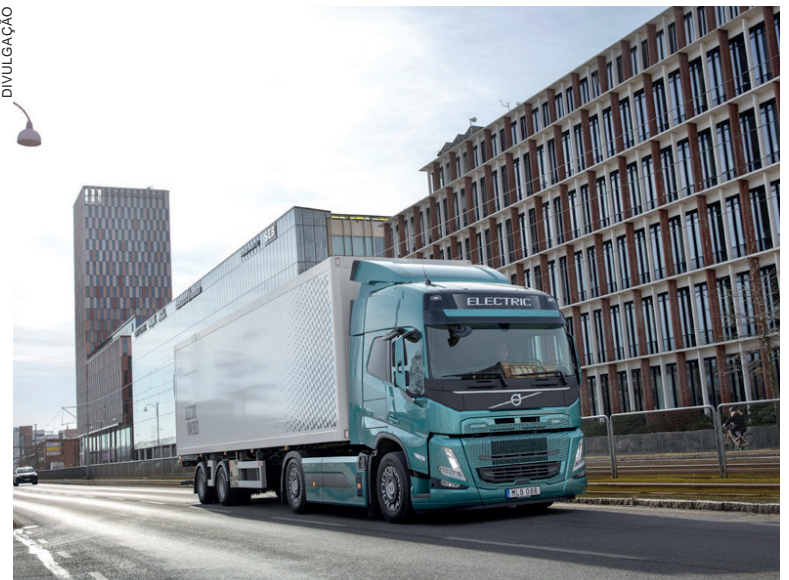
Os primeiros modelos a usar o componente serão os caminhões elétricos Volvo produzidos no continente europeu