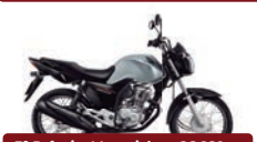
3º Prêmio: Motocicleta CG 160cc START - Ano/Modelo 2022