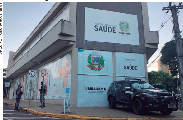
OPERAÇÃO que levou 10 pessoas presas foi desencadeada em maio do ano passado

A primeira das duas fases da Operação Metástase foi