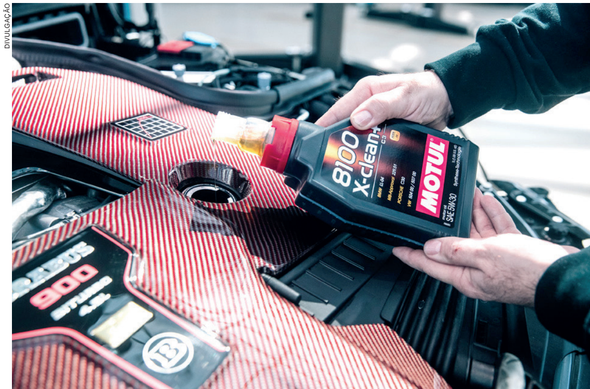
Utilizar o lubrificante com as especificações recomendadas pelo fabricante auxilia na redução do consumo de combustível

Em contrapartida, se escolher um óleo com menor viscosidade na tentativa de reduzir os esforços do motor e o consequente consumo de combustível, corre outro risco: menor viscosidade em