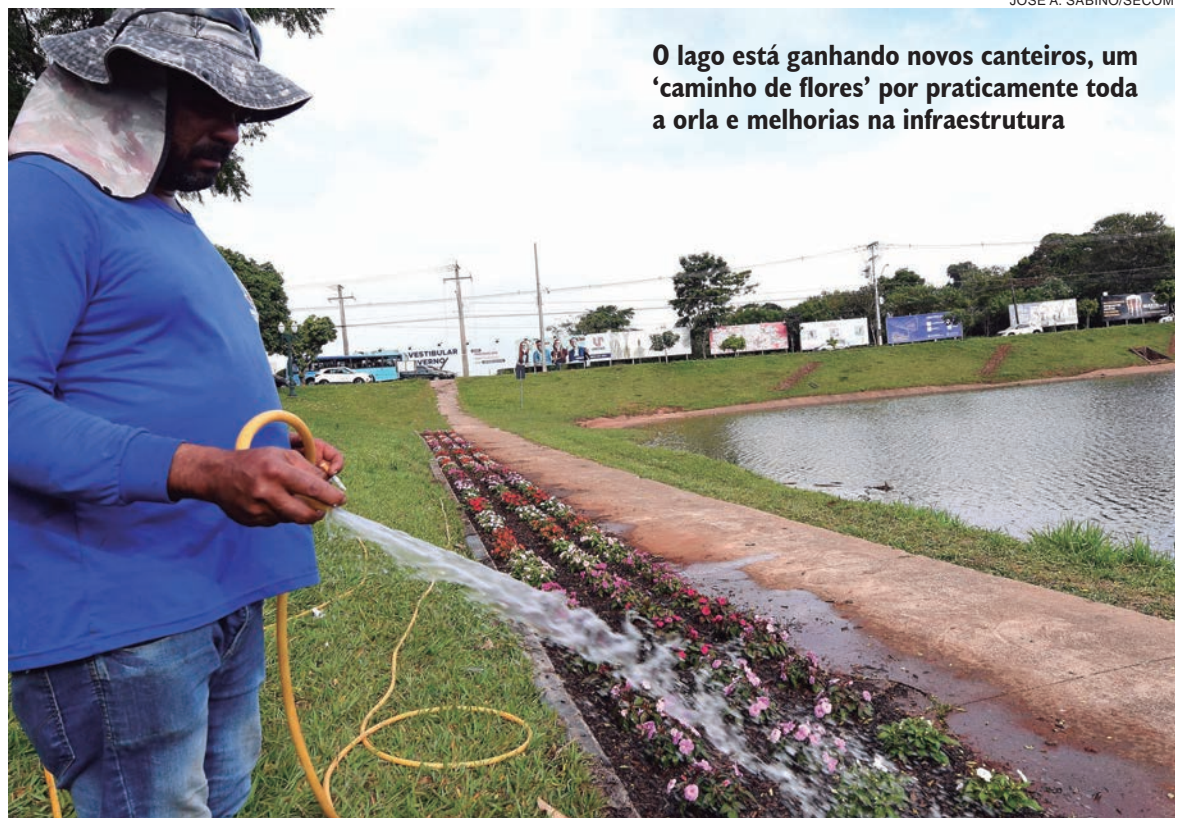
O lago está ganhando novos canteiros, um 'caminho de flores' por praticamente toda a orla e melhorias na infraestrutura

Além da renovação paisagística, a Prefeitura fará uma limpeza completa e pintura de estruturas existentes. "O cultivo de flores também está bem adiantado. Teremos um local bonito e agradável para comemorar o aniversário de Umuarama, mas precisamos da atenção da população