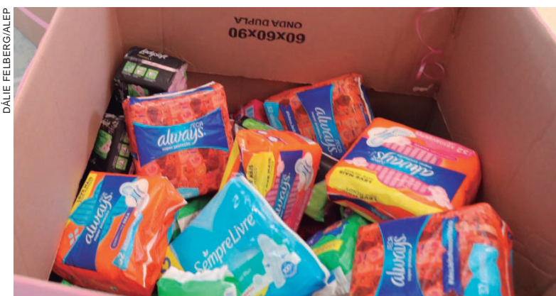
PROCURADORIA da Mulher na Assembleia Legislativa do Paraná e coletivos de torcedoras se unem para promover diálogos e arrecadar absorventes

A ação tem início às vésperas do Dia Internacional da Menstruação, celebrado neste sábado (28), e segue até o dia 14 de junho, quando será realizada uma sessão solene, a partir das 18h, no Plenário da Assembleia.