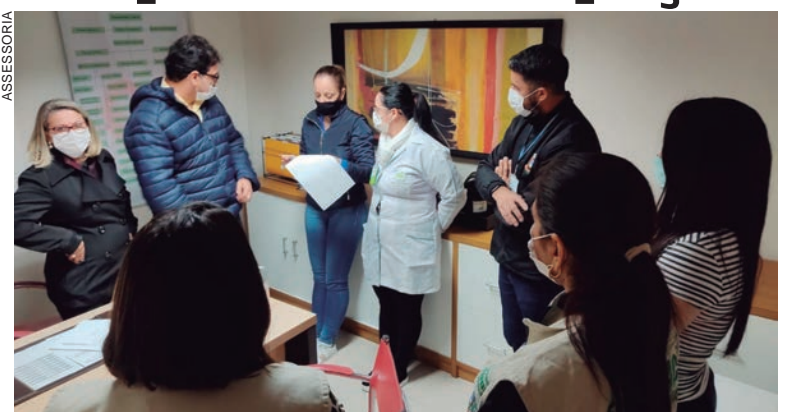
EM reunião na semana passada, direção do INSA foi comunicada oficialmente sobre a interdição

Existente uma relação de 19 itens a serem verificados, a pedido do MP, entre eles a regularização da central de esterilização, que foi terceirizada e será