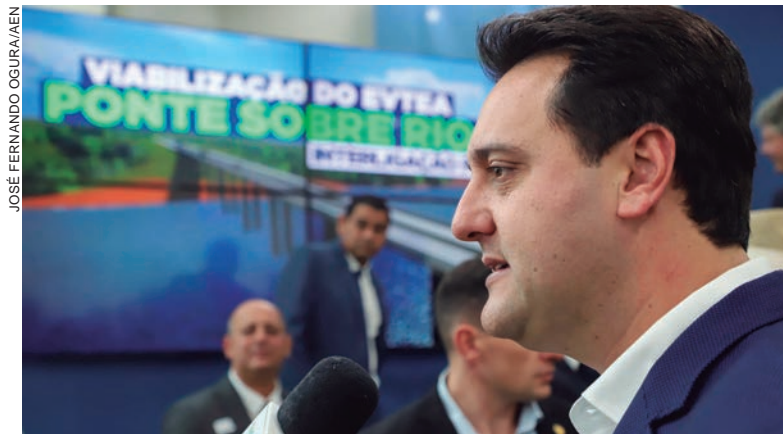
SEGUNDO o governador, o objetivo é melhorar o escoamento da produção agrícola e atrair novos investimentos

“É um estudo complexo de R$ 3,2 milhões que vai demonstrar qual é o melhor traçado, o que tem menor impacto ambiental e o que é mais sustentável dessa nova ligação