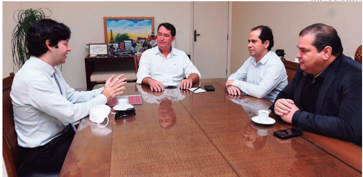
EM parceria com a Agência do Trabalhador, o MPT prepara um projeto inédito no Brasil que pode gerar centenas de vagas de trabalho na cidade

pretende, dentro da lei, disponibilizar vagas em todas as secretarias municipais. “Temos quase 20 secretarias. Se conseguirmos encaixar ao menos um trabalhador PcD por pasta, já serão 20 vagas garantidas”, analisou Pimentel.