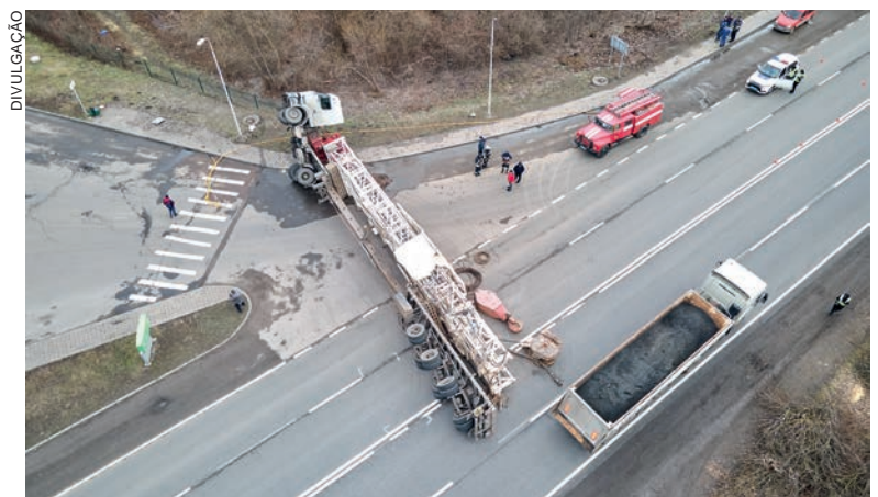
Sinistros envolvendo ônibus e caminhões mataram 2.853 pessoas e deixaram outras 5.453 gravemente feridas em 2021

O diretor da Ammetra reforça a necessidade de criar políticas públicas específicas para motoristas profissionais que contemplem o acompanhamento de saúde de forma descentralizada pelo Sistema Único de Saúde (SUS) e ações que garantam a melhoria das condições de trabalho. “Pensar em um modelo de transporte