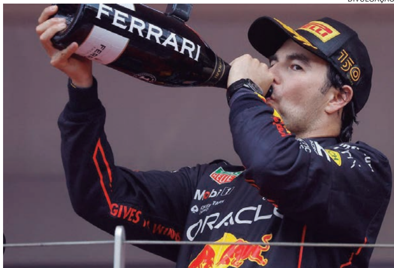
VITORIOSO em Mônaco no domingo, mexicano é o 3º na classificação geral

O vencedor do Grande Prêmio de Mônaco Sergio Pérez teve mais a comemorar ontem (terça-feira, 31), quando a Red Bull anunciou uma extensão de contrato, mantendo o mexicano ao lado do campeão mundial de Fórmula 1 Max Verstappen até 2024.