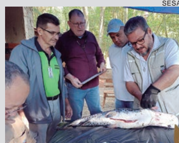
SECRETARIA de Saúde coletou toxinas de peixes venenosos na região do Lago de Itaipu

A equipe de Divisão de Zoonoses e Intoxicações da Secretaria de Estado da Saúde coletou no fim de semana toxinas de diferentes espécies de peixes peçonhentos, nos municípios de Guaíra, Mercedes, Marechal Cândido Rondon e Pato Bragado, no Oeste do Estado. A ação contou com a parceria da Itaipu Binacional e apoio da 20ª Regional de Saúde de Toledo. A medida faz parte do Programa Nacional de Controle de Acidentes por Animais Peçonhentos e Venenosos e tem como finalidade expandir o monitoramento de pescados da região do lago de Itaipu, garantindo a caracterização e identificação das toxinas e promovendo melhor atendimento à população exposta. Mais de 50 espécies de peixes foram coletadas, predominantemente bagres e arraias. As ações, que tem acontecido desde o início de abril, devem ser mantidas ao longo do ano para identificar as principais espécies de peixes peçonhentos no Estado.