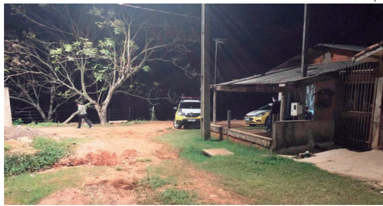
CONFRONTO aconteceu no distrito de Lovat quando o suspeito apontou uma arma aos policiais militares que o monitoravam

Equipes do Samu (Serviço de Atendimento Móvel de Urgência), bem como a Polícia