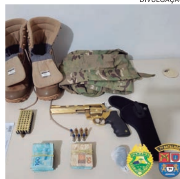
DOIS suspeitos fugiram, mas deixaram para trás R$ 28 mil, uma arma, drogas e munição, além do carro roubado