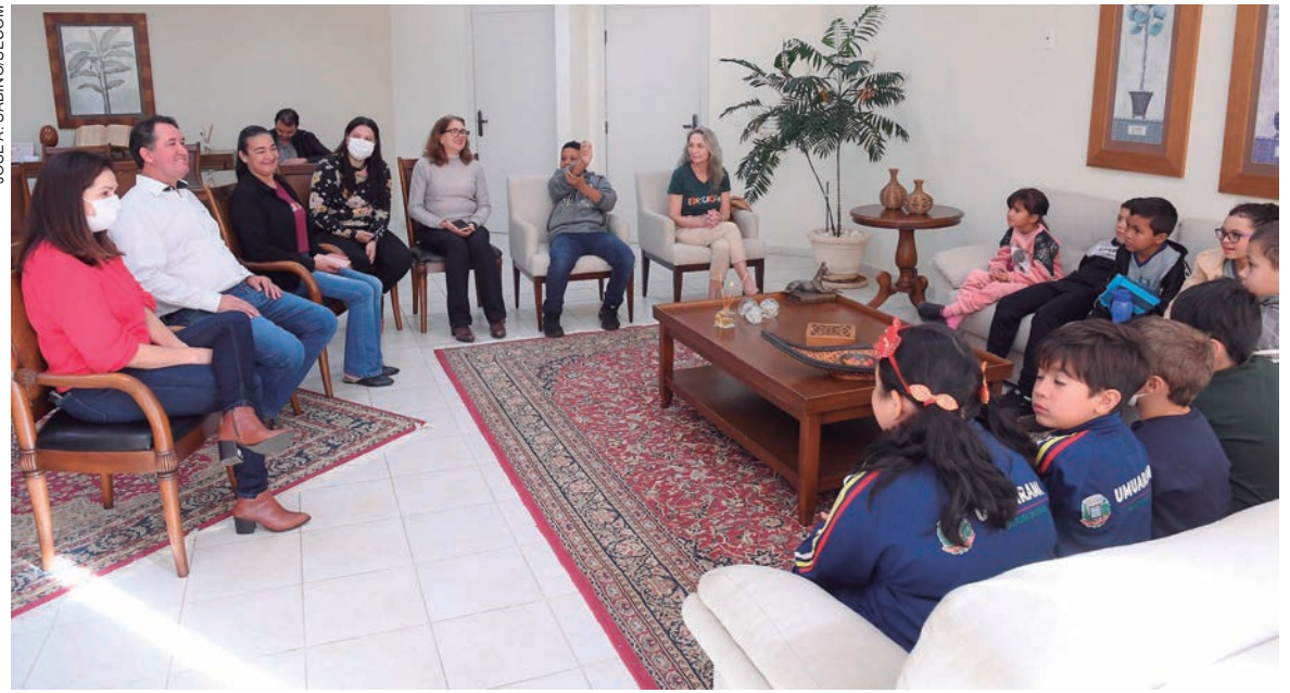
PREFEITO foi questionado pelos alunos, sobre a possibilidade de asfaltar a estrada entre Umuarama e o distrito

O prefeito foi convidado para participar da festa junina da escola de Roberto Silveira – que neste ano passou a ofertar educação em tempo integral – e também convidou as crianças e suas famílias para as festividades do 67º aniversário de Umuarama. "Teremos atrações inclusive nos distritos, que vão receber o Trenzinho da Alegria para um passeio com personagens dos desenhos, pipoca e algodão-doce", antecipou, agradecendo a todos pela visita. "A Prefeitura sempre estará de portas abertas para vocês", finalizou.