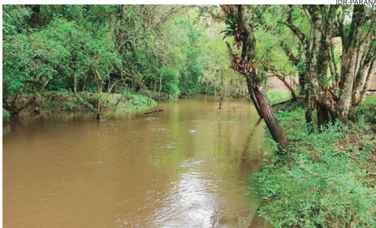
O Instituto tem tecnologias capazes de reduzir o uso de agrotóxicos, contribuir para a conservação dos recursos hídricos, manter ou melhorar a fertilidade do solo

O IDR-Paraná vem executando um programa de grande importância para a sustentabilidade agropecuária do Estado, o Prosolo-Paraná. A iniciativa envolve diversas instituições: Secretaria da Agricultura e do Abastecimento, Federação da Agricultura do Paraná, Sistema Ocepar, Itaipu Binacional, Sanepar, Copel e Federação dos Trabalhadores da Agricultura. Em agosto sete seminários em todo o Estado vão aumentar a divulgação do projeto.