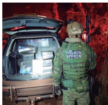
DROGA foi apreendida depois de 35 quilômetros de perseguição. Carros dos traficantes usavam dispositivos de lançamento de fumaça para despistar os policiais

Policiais militares do Batalhão de Polícia de Fronteira (BPFron), em parceria com policiais federais, apreenderam mais de uma tonelada de droga durante a Operação Hórus. A ação integrada ocorreu na madrugada do domingo (5), em Francisco Alves.