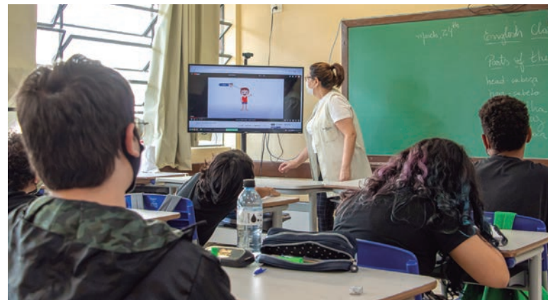
O projeto tem o objetivo de conscientizar alunos sobre a função social do tributo e o controle social sobre a aplicação dos recursos arrecadados

“O pagamento de tributos e sua importância na disponibilização dos serviços públicos está presente no cotidiano das pessoas. Está contemplada na Base Nacional Comum Curricular junto com a Educação Financeira, educação para o consumo e outros temas contemporâneos. Daí a