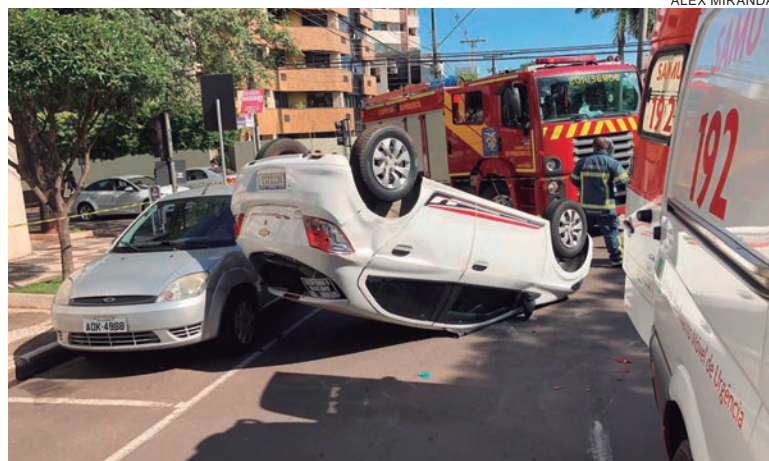
APESAR da violência do choque, motoristas ou passageiros não sofreram ferimentos

Equipes do Corpo de Bombeiros e do Samu compareceram ao local para prestar socorro à vítima, porém