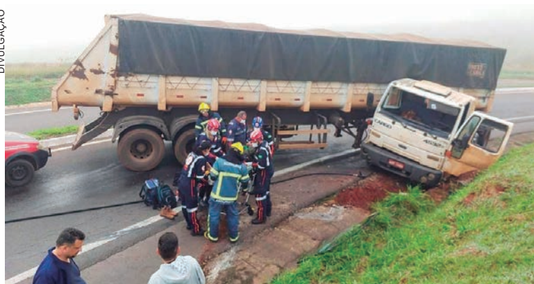
MOTORISTA Ficou preso dentro da cabine e sofreu ferimentos nas pernas após perder o controle no trevo de acesso à Alto Piquiri

O veículo também estava com um vazamento de combustível resultante do acidente, porém os bombeiros conseguiram controlar a situação e evitar mais acidentes.