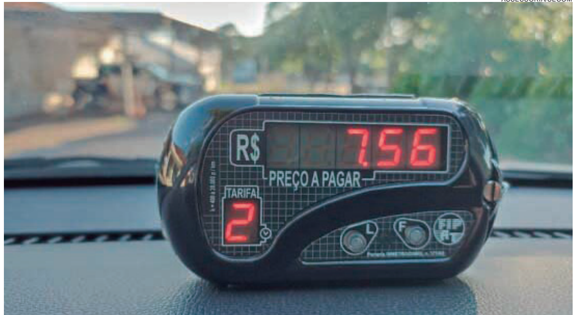
A secretaria reforça que os taxistas devem, rigorosamente, usar o taxímetro em todas as corridas

A secretaria reforça que os taxistas devem, rigorosamente, usar o taxímetro em todas as corridas. "Caso o cidadão se sinta de alguma forma explorado, pode denunciar, reclamar e informar à Sestram, ligando para 3906-1111. A meta da Sestram é regularizar todos os profissionais que atuam na área junto à Prefeitura até o final deste ano.