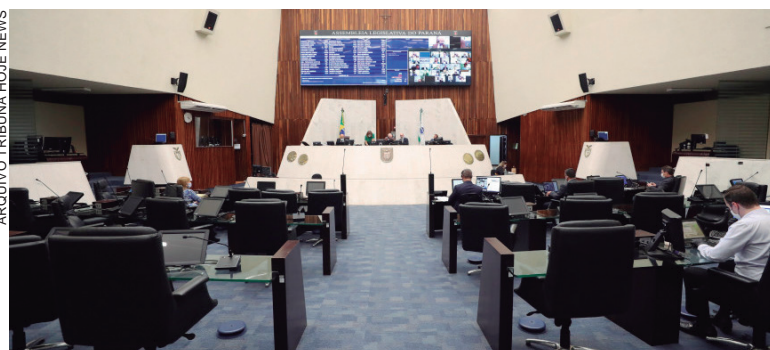
NA segunda (6), o presidente do legislativo, Ademar Traiano reconduziu os deputados Francischini, Bacil, Caron e Do Carmo, que agora terão que deixar os cargos

Na segunda-feira (6), o presidente do legislativo estadual, Ademar Traiano (PSD), cumpriu a decisão de Nunes Marques, prolatada na quinta-feira passada e reconduziu ao cargo os deputados os deputados Fernando Francischini, Emerson Bacil, Cassiano Caron