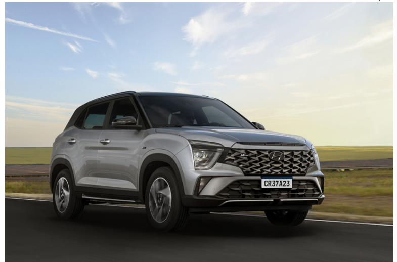
Brasil é o primeiro país a receber o SUV com a marca esportiva mundial da Hyundai

A versão N Line do Hyundai Creta Nova Geração chega ao mercado com itens que