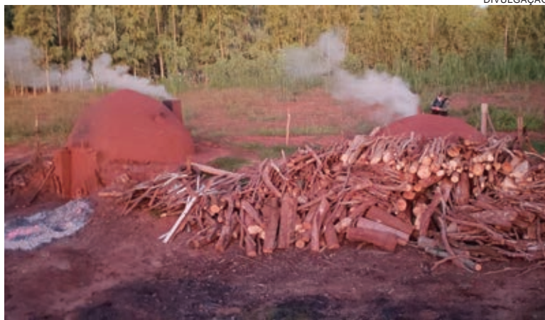
EQUIPES da Polícia Ambiental de Umuarama e PMs descobriram a carvoaria em uma propriedade rural de Altônia

Também foi apreendido todo o carvão que foi produzido de forma irregular, somando 2,8 toneladas do produto avaliado em aproximadamente R$ 4,2 mil.