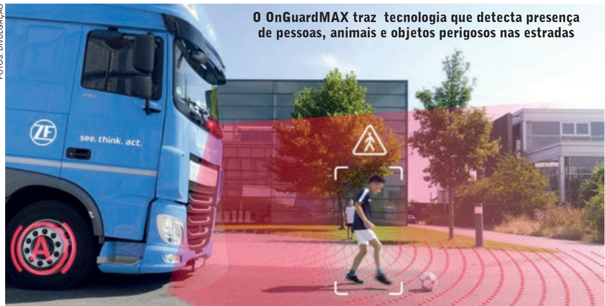
O OnGuardMAX traz tecnologia que detecta presença de pessoas, animais e objetos perigosos nas estradas