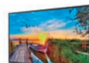
4º Prêmio: Televisor 43'