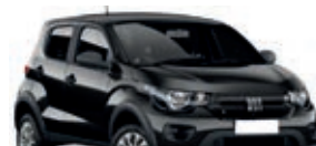
2º Prêmio: Fiat Mobi EASY 1.0 FLEX MANUAL, Ano 2021, Modelo 2022