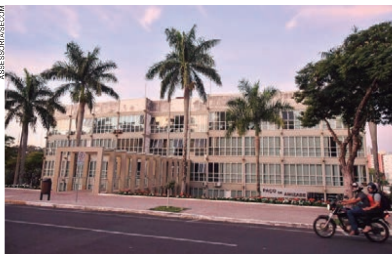
O Dia de Corpus Christi, um dos santos dias de guarda mais importantes da tradição católica

Terão atendimento normal (ou em sistema de plantão) os serviços funerários, varrição de ruas, coleta de lixo, Guarda Municipal, Vigilância Sanitária e outros serviços considerados essenciais, que não podem