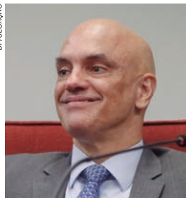
EM seu discurso, Moraes disse que a Justiça Eleitoral não permitirá que milícias, pessoais ou digitais, desrespeitem a vontade soberana do povo

O TSE é composto por, no mínimo, sete ministros: três são originários do Supremo Tribunal Federal, dois são do Superior Tribunal de Justiça