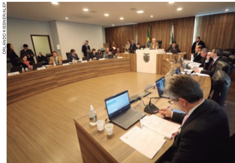
O Executivo pretende reorganizar as carreiras, alterando a estrutura remuneratória e solucionando distorções de valores

pretende com o projeto de lei reorganizar as carreiras do Detran/PR, alterando a estrutura remuneratória visando solucionar distorções de valores atualmente pagos, criando uma nova modalidade de retribuição pecuniária através de subsídio.