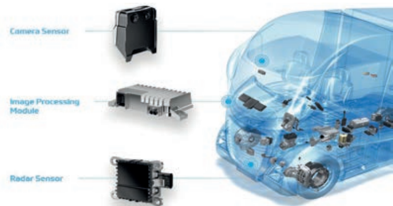
O OnGuardMAX funciona por meio de radares, câmeras, sensores e softwares

A divisão voltada para Veículos Comerciais da ZF também conta uma extensa rede de serviços de Aftermarket e pode oferecer soluções digitais de gerenciamento de frota para suportar a operação das empresas.