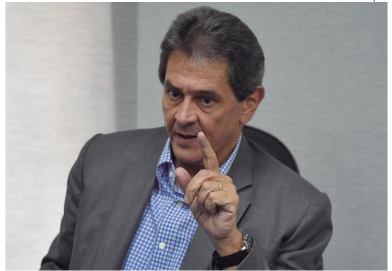
ENTRE as candidaturas à Presidência negadas, está a de Roberto Jefferson, enquadrado na Lei da Ficha Limpa por sua condenação no caso do Mensalão

Outro motivo para uma candidatura ser considerada inapta é quando o registro foi cancelado pelo partido, o que ocorreu 13 vezes até o momento. É possível ainda que o pedido sequer seja conhecido pela Justiça Eleitoral, em geral devido alguma irregularidade formal que impede seu