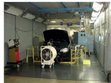
Célula em 2010 (à esquerda) e hoje em dia

de paradas em marcha lenta (simulando paradas em semáforos ou congestionamentos).