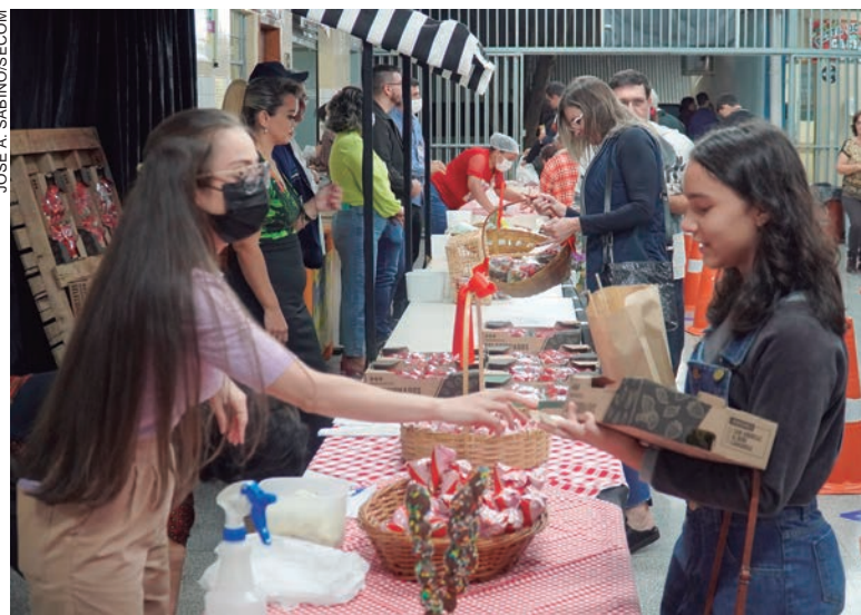
DURANTE dois dias, o Colégio Estadual Lovat recebeu centenas de visitantes que provaram delícias produzidas a base de morango e também a fruta in natura

Além de contribuir para as ações da associação de pais, mestres e funcionários da escola, os visitantes se deliciaram com cones recheados, trufas, espetinhos recheados com chocolate e caixas de morangos