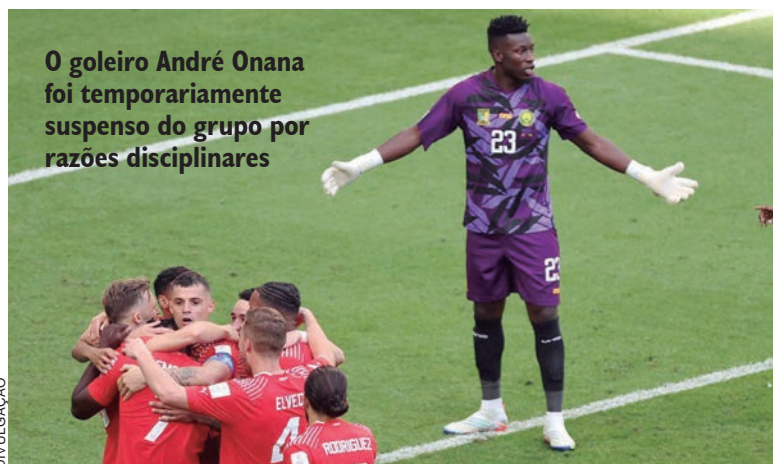
O goleiro André Onana foi temporariamente suspenso do grupo por razões disciplinares

que visa preservar disciplina, solidariedade, complementaridade e coesão dentro da seleção nacional”. “A Fecafoot reafirma ainda o seu compromisso em criar um ambiente tranquilo para a equipe e proporcionar instalações adequadas para um desempenho excepcional”, acrescentou.