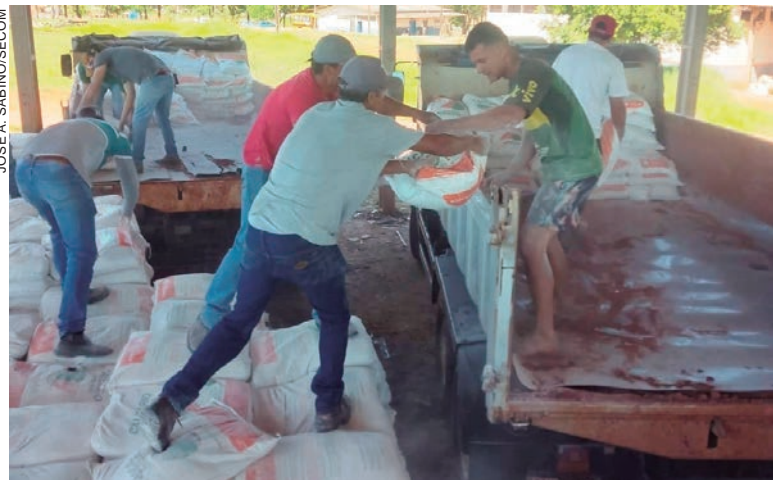
O calcário está sendo entregue aos criadores de gado de leite, produtores de frutas, legumes e hortaliças, já cadastrados em programas desenvolvidos no município

O secretário municipal de Agricultura acrescenta ainda que neste momento o insumo está sendo destinado a produtores já cadastrados e que fazem parte dos diversos programas da Prefeitura, porém o setor continua recebendo novas inscrições. “Manter as famílias trabalhando