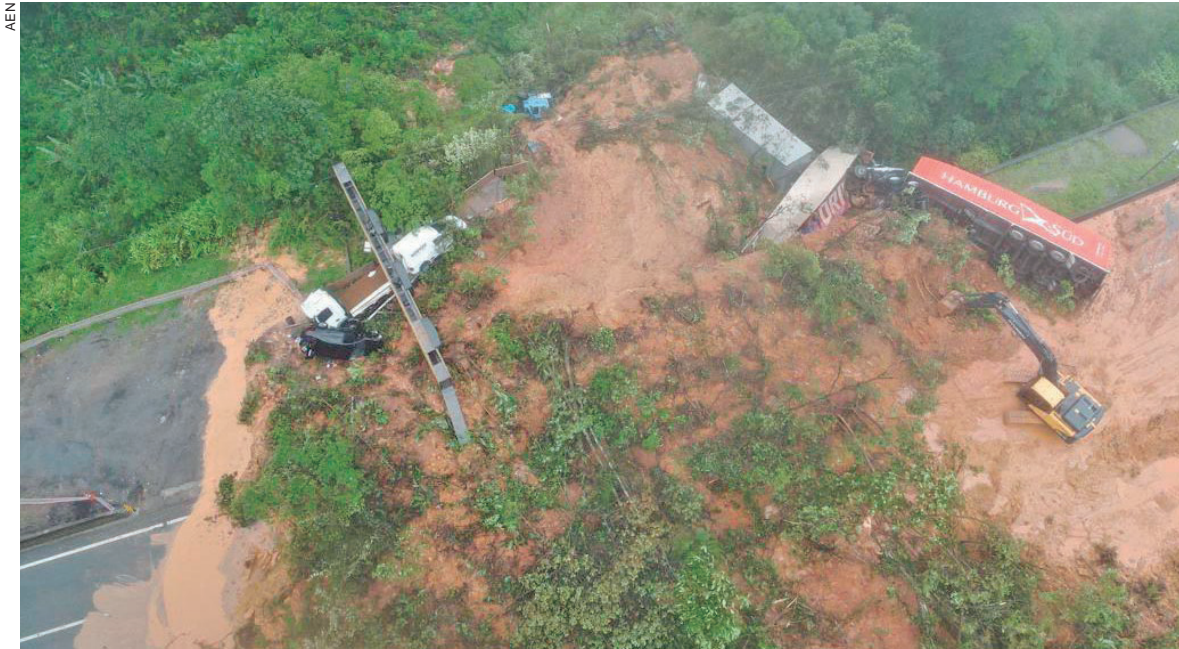
AO menos 6 carretas e entre 10 e 15 veículos foram soterrados pela lama, que atingiu um trecho de cerca de 200 metros nos dois lados da pista. Uma morte foi confirmada

O Governo do Estado apresentou ontem (29) os primeiros detalhes da operação de resgate no deslizamento de terra que provocou o fechamento da BR-376, em Guaratuba. Estiveram no local 54 bombeiros, três cães farejadores e equipes da Defesa Civil, além de engenheiros da Arteris Litoral Sul e equipes da Polícia Militar e Polícia Rodoviária Federal.