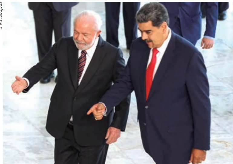
PRESIDENTES se encontraram ontem no Palácio do Planalto

“O Brics está se transformando em um grande ímã daqueles que buscam um mundo de paz e cooperação”, completou, ao citar que mais de 30 países já solicitaram entrar no bloco.