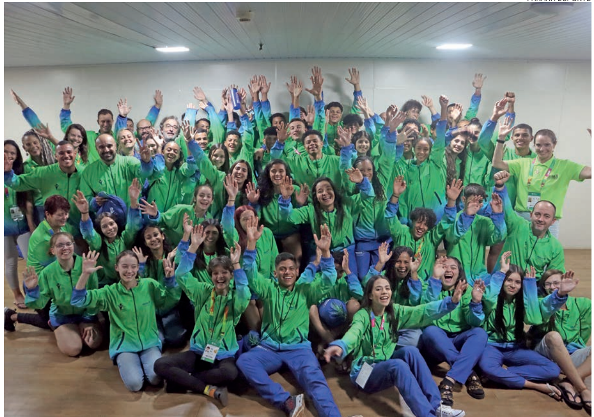
Mais de 200 integrantes, entre atletas e dirigentes, representarão o Paraná na competição, que vai até o dia 16 de setembro

Desde 2000, os Jogos reúnem anualmente mais de 4.500 atletas com até 17 anos oriundos de escolas públicas e privadas de todo o país. Mais de 2 milhões de estudantes das 27 unidades federativas (26 estados e o