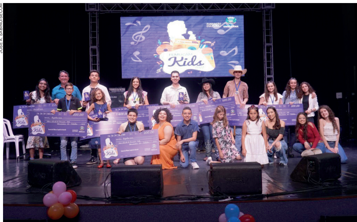
Podem participar crianças de 8 a 17 anos de toda a região da Amerios interpretando músicas nacionais

Ele explica que, para fazer sua inscrição, o candidato deverá postar um vídeo no YouTube cantando a música que pretende defender no II Femucam Kids e encaminhar o link no formulário on-line. “A apresentação deve ser feita