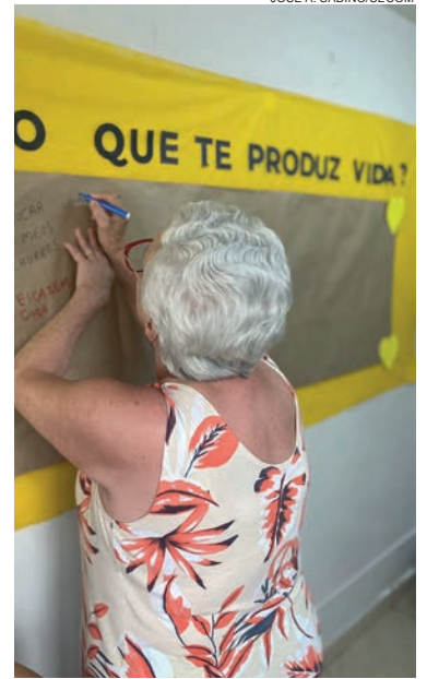
Secretaria de Saúde de Umuarama preparou uma série de ações para abordar o delicado tema

"No Brasil, os registros se aproximam de 14 mil casos por ano, ou seja, em média 38 pessoas cometem suicídio por dia. Todos nós devemos atuar ativamente na conscientização da importância que a vida tem e ajudar na prevenção do suicídio, tema que ainda é visto como tabu", alerta a psicóloga.