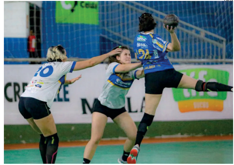
As medalhas de Umuarama foram no handebol masculino (3º); handebol feminino (2º); voleibol masculino e voleibol feminino (3º)

A final em Pato Branco será disputada em dois fins de semanas, de 09 a 12 e de 23 a 26 de novembro. A novidade desta última etapa é a adição de algumas modalidades, como badminton, bocha, bolão, ciclismo, ginástica rítmica, handebol de praia, natação, rugby, tênis, tênis de mesa e xadrez. O atletismo acontecerá na cidade de Londrina, entre os dias 29 de setembro e 01 de outubro.