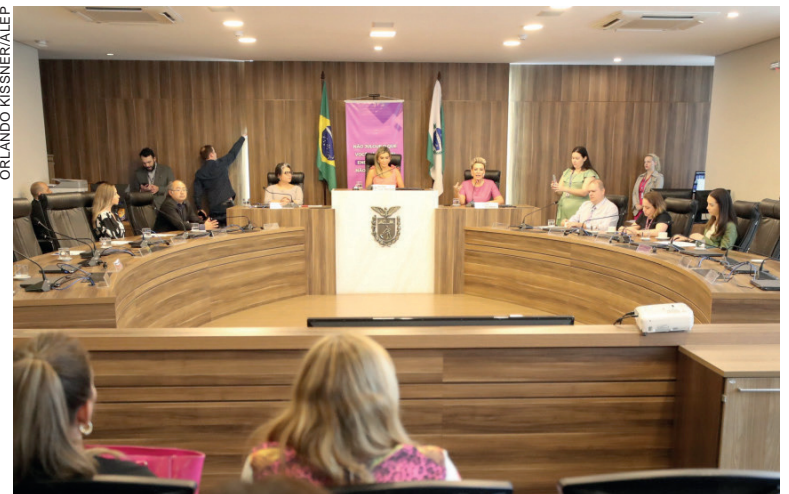
Proposta aponta diretrizes para a criação da política de saúde pública sobre a doença, no encontro com especialistas para abordar diagnóstico e tratamentos

“Nós, como representantes da população, sabemos da importância de abordar esse tema. Muitas mulheres têm sofrido com a endometriose. Eu faço parte dos 10% de mulheres que sofrem com essa doença. Este assunto deve ser mais discutido e a casa do povo, onde são feitas as leis, é um lugar ideal para isso”, afirmou a deputada