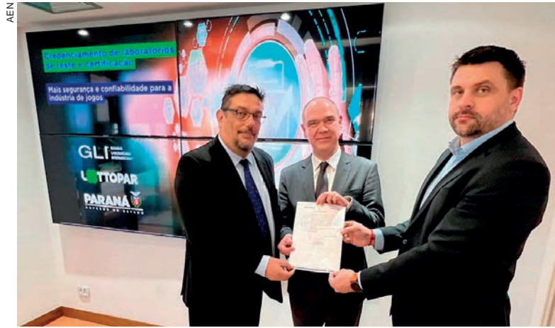
Iniciativa pioneira da Lottopar, o laboratório Gaming Laboratories International é o primeiro credenciado para efetuar testes e emitir certificados a operadores

“Esse credenciamento para a indústria de jogos lotéricos demonstra o compromisso da Lottopar e do Governo do Paraná em propiciar um ambiente seguro e responsável das operações lotéricas, garantindo padrões mundiais de segurança. Agora as empresas lotéricas que irão operar no Estado podem emitir os certificados e realizar testes no Paraná sem a necessidade de recorrer a laboratórios de outros estados