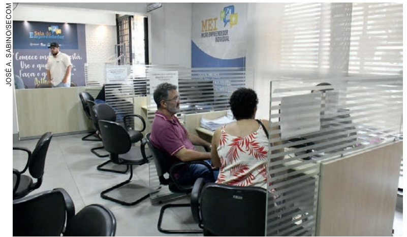
Instituição financeira vinculada ao Governo do Estado tem ponto de atendimento na Casa do Empreendedor

Além desses incentivos disponibilizados pela Fomento Paraná na Casa do Empreendedor, os empresários também podem ter acesso a um outro desconto, um benefício concedido por meio do Banco do Empreendedor. “A instituição