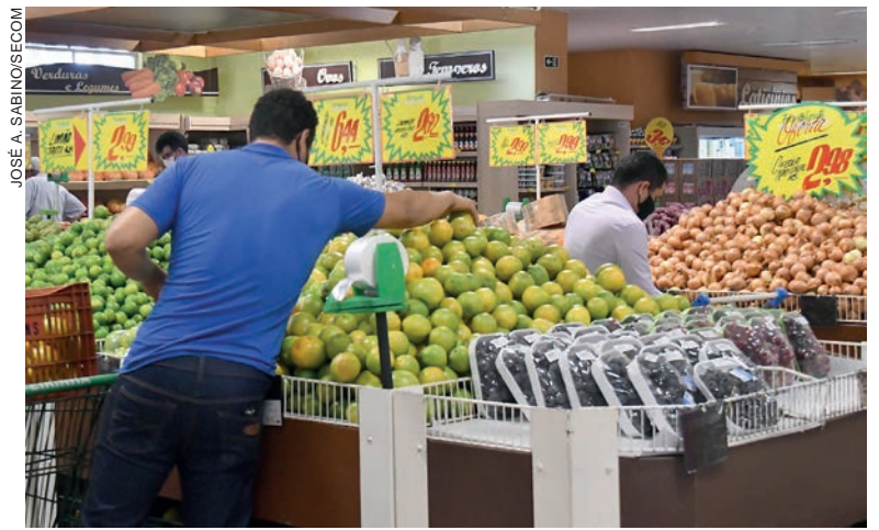
O preço da batata, do sabonete e da cebola foram os que apresentaram maior redução de preços segundo pesquisa do Procon

O secretário lembra que as pesquisas foram feitas no dia 6 de setembro e considera os itens para suprimento de uma família com quatro pessoas. “Assim