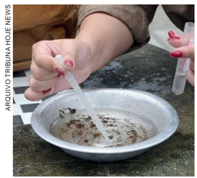
Já foram registradas 131 notificações de suspeitas da doença, das quais 56 foram descartadas, e ainda há 65 prováveis casos em investigação

O indicado é fazer vistorias diárias nos quintais, após a ocorrência de chuvas, e denunciar situações que configurem negligência ou descuido de vizinhos, bem como lixo e eventuais criadouros em terrenos baldios. O telefone para denúncias e reclamações é (44) 6639-1930 no horário de expediente da Prefeitura – das 8h às 12h e de 13h30 a 17h30.