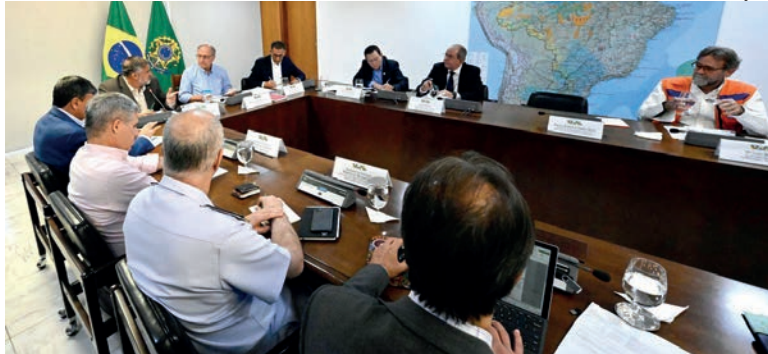
Wellington Dias anunciou R$ 4,6 mil para pequeno agricultor

“Da parte do ministério, nós vamos colocar cerca de R$ 56 milhões disponibilizados para vários programas, para esse do