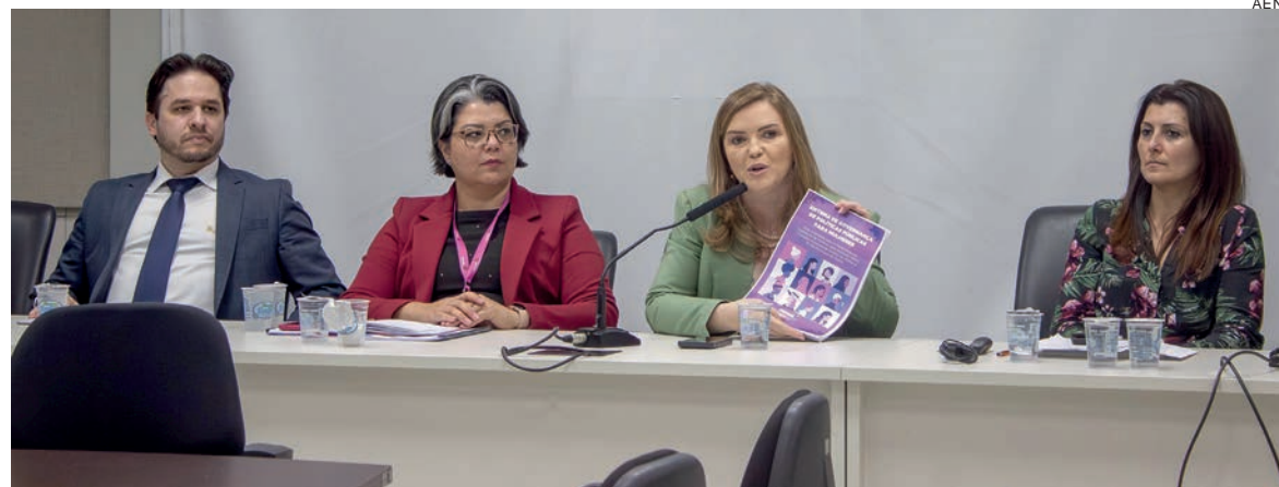
Guia digital foi criado pela Secretaria da Mulher, Igualdade Racial e Pessoa Idosa e detalha orientações para implementação de Políticas para Mulheres

Já está disponível o guia orientativo para a implantação de Organismo de Políticas para Mulheres (OPM), Conselho Municipal de Direitos da Mulher e Fundo Municipal da Mulher nos municípios paranaenses. O documento é digital e com conteúdo em formato de perguntas e respostas para torná-lo mais dinâmico e permitir atualização sempre que necessário.