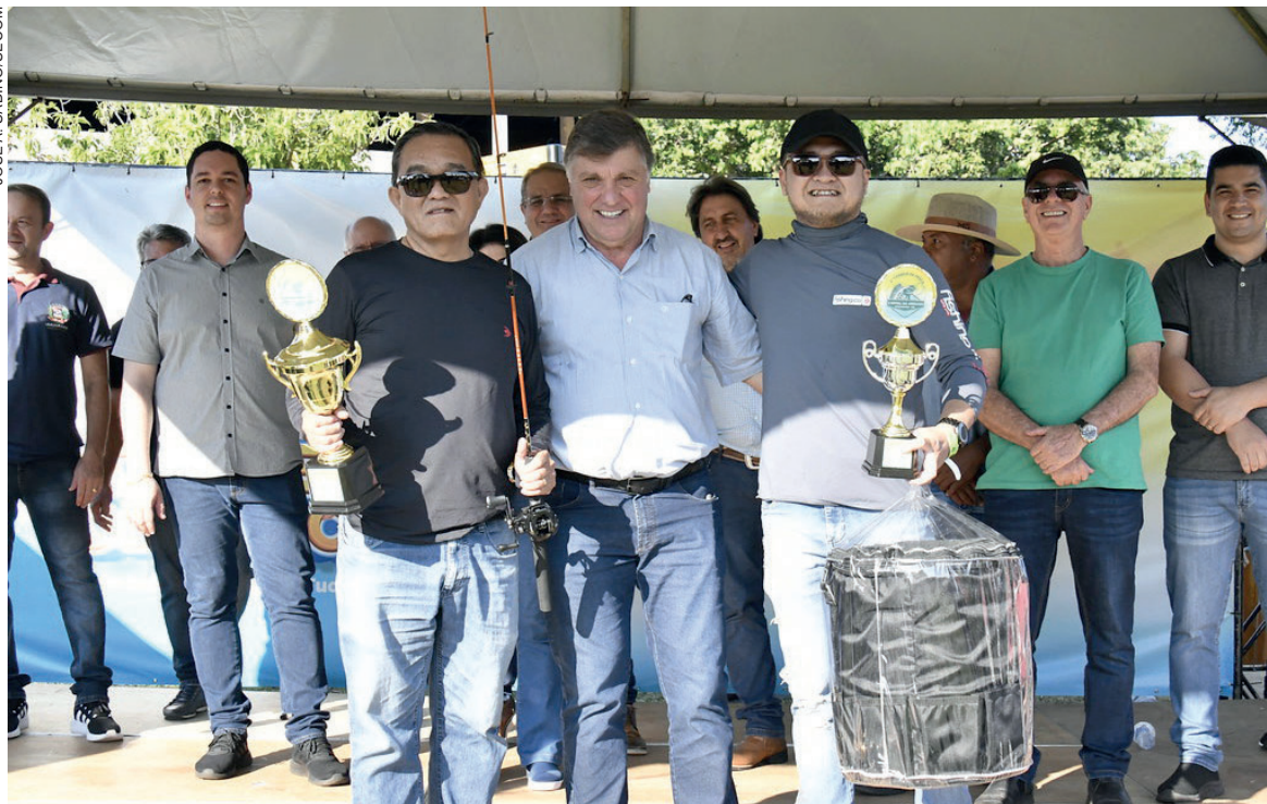
Maiores peixes capturados tinham 46 centímetros, pescador mais idoso tem 88 anos e o mais novo 5 anos

pescados durante o evento, que teve 400 inscritos – houve abstenção de cerca de 12%. “Este ano nós sugerimos a doação de um litro de leite UHT (caixinha), que serão repassadas à Secretaria Municipal de Assistência Social. Tivemos ainda praça de alimentação, feira de artesanato e a feirinha de doação, realizada pela Saau (Sociedade de Amparo aos Animais de Umuarama). A participação da Banda Municipal 26 de Junho também