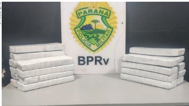
Droga seria levada para Londrina pelo valor de R$ 1.500, mas parou em Cianorte

através de uma consulta no sistema policial foi possível saber seu nome verdadeiro. Ela também afirmou que receberia R$ 1.500 para entregar os tabletes em Londrina.