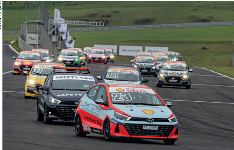
A programação da Copa Shell HB20 será aberta na sexta-feira (15), quando serão realizadas três atividades livres

“Vou para a etapa do Velopark confiante em mostrar um bom desempenho. Nós viemos de um segundo lugar na minha divisão na Porsche Cup, e isso me trouxe mais confiança para este final de semana da Copa Shell HB20. Vamos trabalhar bem durante os treinos para conseguir adaptação à pista e o melhor