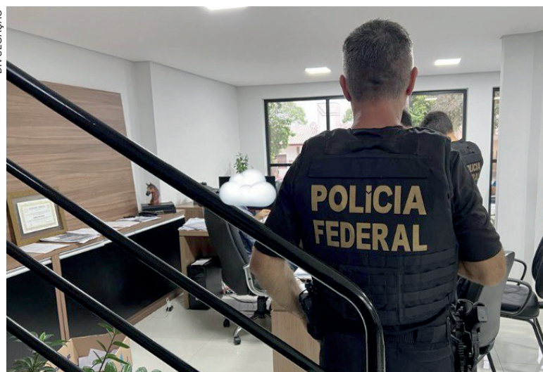
Os agentes da Polícia Federal e servidores da Receita Federal descobriram a sede do grupo criminoso em Umuarama

Ontem pela manhã simultaneamente os policiais e agentes da Receita cumpriram os mandados judiciais expedidos pela 1ª Vara Federal de Umuarama (sede do grupo), Paçandu e Maringá. No total, foram sete ordens cumpridas.