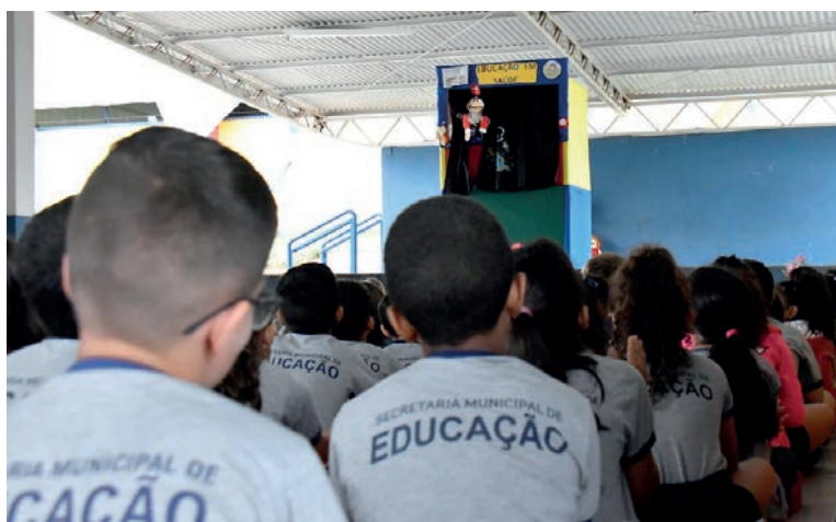
O projeto, destinado aos estudantes, envolve também professores, funcionários e gestores das escolas municipais, provocando reflexões sobre saúde e meio ambiente

O projeto, destinado aos estudantes, envolve também professores, funcionários e gestores das escolas municipais, provocando reflexões sobre saúde e meio ambiente, destacando ações cotidianas que podem ajudar na melhoria da qualidade de vida, minimizando riscos de doenças e promovendo a prevenção,