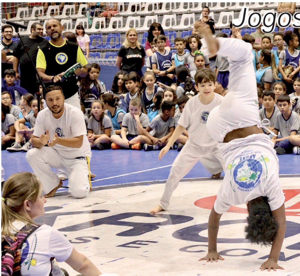
JOSE A. SABINO/SECOM