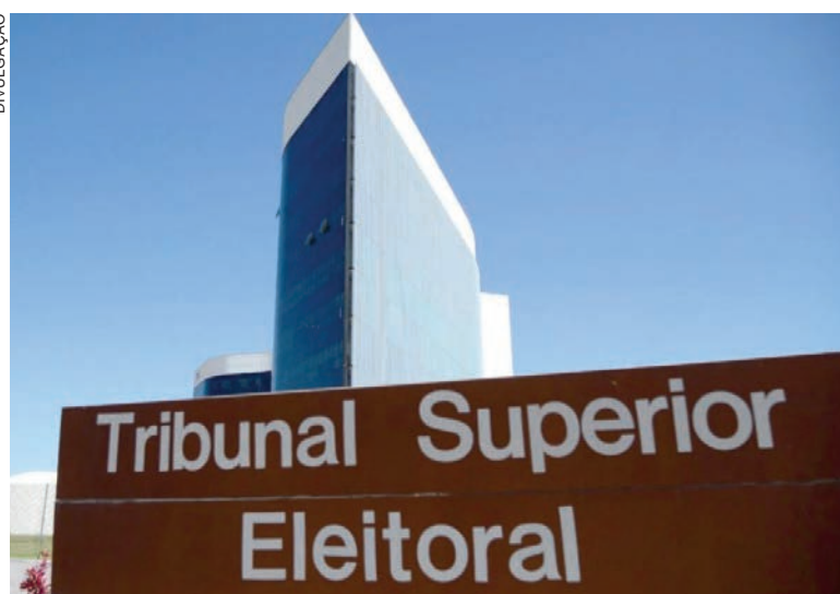
A contratação foi programada em pregão eletrônico anunciado no site do TSE, que será realizado no dia 26 de setembro às 14h

Na planilha de custos da licitação, também foi considerado que nenhum fisioterapeuta receberá menos do que R$ 3.787,04, o piso previsto na convenção coletiva de trabalho do sindicato das empresas de serviços terceirizáveis do