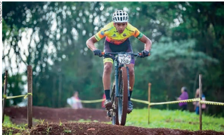
A competição, de seis etapas, contou com a participação média de 150 atletas das regiões Oeste, Sudoeste e Noroeste

a equipe estará presente no Campeonato de MTB em Cascavel, onde a expectativa