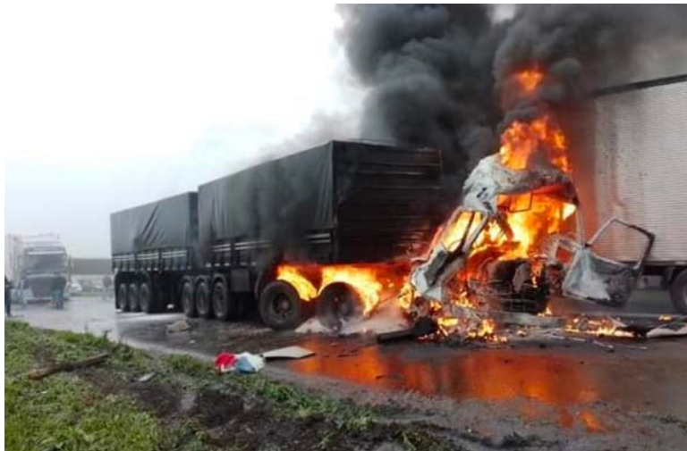
Engarrafamento deixa cinco mortos e dezenas de veículos presos na BR-277 no Paraná