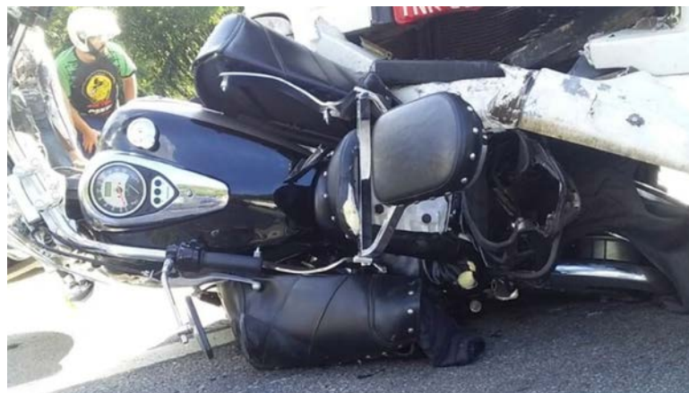
Homem tem moto arrastada por 32 quilômetros e fica pendurado em cabine de carreta após acidente em SC

Um levantamento recente da Polícia Rodoviária Federal apontou que, nos quatro primeiros meses deste ano, quase metade (46%) das mortes registradas nas rodovias federais envolvia caminhões ou carretas. Ao todo, foram 1.211 vítimas com ferimentos graves nesses acidentes e 631 pessoas morreram, número maior do