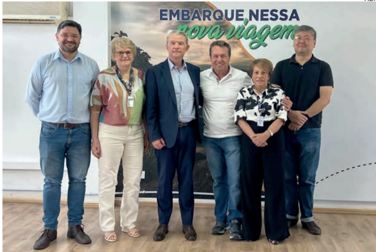
O índice terá sua primeira edição publicada no final de 2023, e será atualizado anualmente para que os possam acompanhar a performance de seus indicadores

O levantamento, inédito no Estado, será realizado por técnicos das duas pastas num universo de oito indicadores estaduais e municipais, que vão desde o índice de emprego em segmentos ligados ao turismo até o volume de investimento em comparação com o orçamento total de cada município. “Será uma ferramenta importante e confiável para a tomada de decisões, pois abrangerá municípios de todo o Estado com base em informações