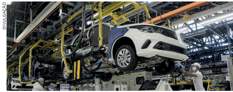
Durante um período de 12 meses, o indicador econômico ficou positivo em 3,12%, segundo o Banco Central

A Selic é o principal instrumento do BC para alcançar a meta de inflação. Quando o Copom aumenta a taxa básica de juros, a finalidade é conter a demanda aquecida, e isso causa reflexos nos preços porque os