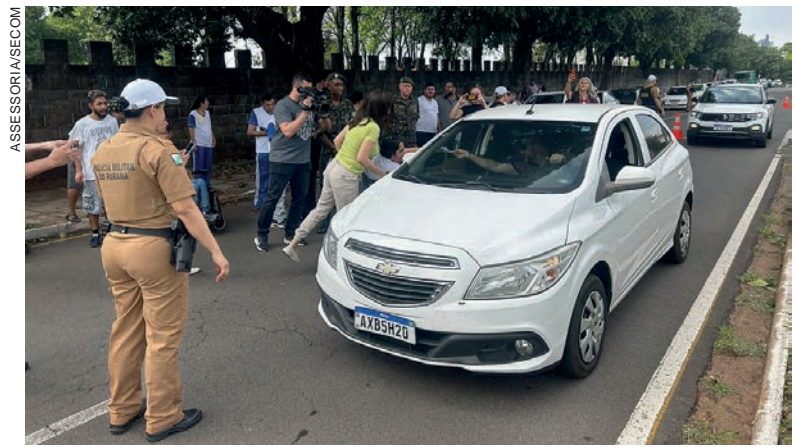
Ação foi desenvolvida ontem pela manhã com alunos da Apae que acompanharam uma simulação de acidentes

Uma blitz educativa na avenida Parigot de Souza, às 14h da sexta (22), e panfletagem na esquina da avenida Paraná com a rua Governador Ney Braga, encerram as atividades.