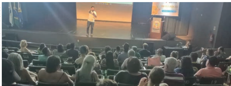
Objetivo do evento é ouvir a comunidade a respeito de suas necessidades na produção de suas artes

Ainda dentro do objetivo de criar políticas públicas de cultura que realmente promovam e incentivem os profissionais que produzem arte no município, a Fundação Cultural de Umuarama realiza hoje (20), às 19h no Centro Cultural Vera Schubert, uma audiência pública exclusiva para debater a Lei Complementar nº 195/2022, conhecida como Lei Paulo Gustavo. A entrada é franca.