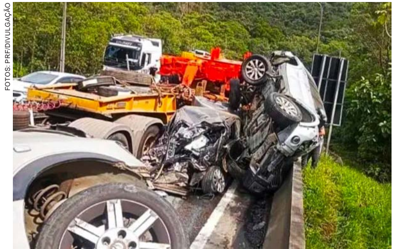
Grave acidente entre caminhão e 15 veículos deixa BR-376 interditada

5.432 vidas perdidas nas estradas. Entre elas, 44,8% eram passageiros de automóveis. Em segundo lugar, 30%, dos óbitos eram pessoas que usavam moto como meio de transporte, seguidos dos motoristas e passageiros de caminhões, 14,2%. É nesse aspecto que Bassoli chama a atenção para um detalhe fundamental: “na pista, em uma colisão com qualquer veículo, o caminhão está em vantagem por sua estrutura”, enfatiza.