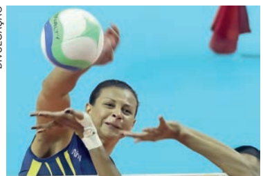
Ex-jogadora morreu no início da noite da quinta-feira, 21) no bairro de Cerqueira César

A central Waleska Moreira de Oliveira morreu na noite da quinta-feira (21) em São Paulo. Campeã olímpica com a seleção brasileira de vôlei em 2008, a atleta estava aposentada desde o final da temporada 2021/2022, quando defendia o Praia Clube de Uberlândia. Até a manhã de ontem (22), a causa da morte da ex-jogadora não havia sido confirmada. Em nota, a Secretaria de Segurança Pública do estado de São Paulo disse que a Polícia Civil investiga a morte ocorrida por volta das 18h no bairro de Cerqueira