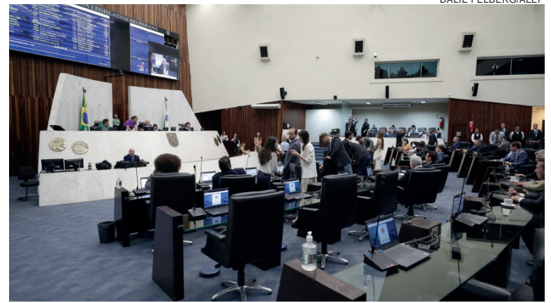
Parlamentares vão discutir o processo de integração do poder público, setor produtivo e instituições de pesquisa para estabelecer o desenvolvimento da tecnologia

“Em virtude do planejamento seguro implantado pelo ministério desde os primeiros