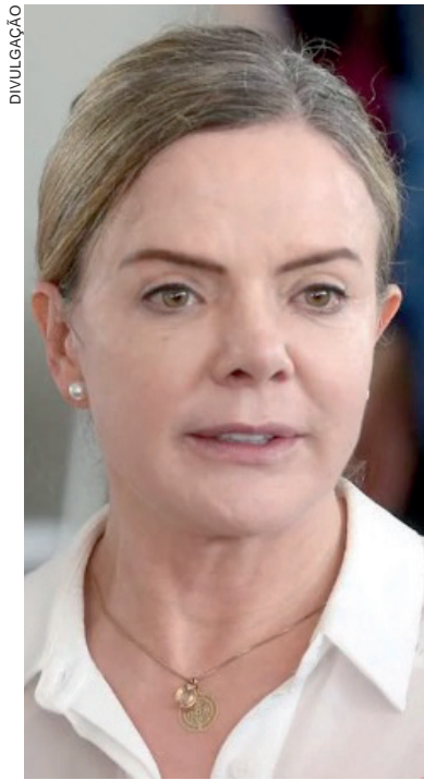
Parlamentar afirmou que a declaração dela na sessão da comissão especial da PEC da Anistia foi retirada do contexto

O posicionamento foi rebatido pelo presidente do Tribunal Superior Eleitoral (TSE), ministro Alexandre de Moraes, que classificou a fala como “agressões infundadas” contra a Justiça Eleitoral, nesta quinta, 21. A presidente do PT disse não saber se o magistrado teve “condições de ouvir” a declaração dela.