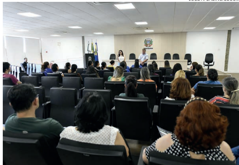
Prefeito recebe mães e profissionais que atendem crianças com Transtorno do Espectro Autista

A Rede Municipal de Ensino atende a 264 estudantes com algum tipo de deficiência, transtorno ou necessidades especiais: são 244 com TEA, nove com DFN (Deficiência Física Neuromotora) e 11 com