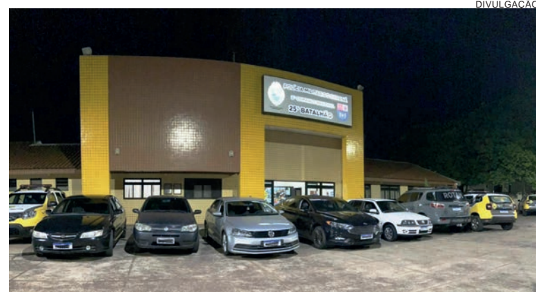
Veículos apreendidos com irregularidades de trânsito e com alerta de furto e roubo foram retirados de circulação pela PM

O proprietário do estabelecimento, situado nas imediações da Praça Anchieta, informou aos policiais que havia acabado de negociar os automóveis em Cianorte e estava retornando para Umuarama,