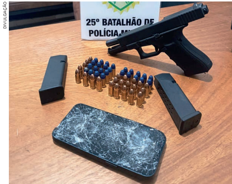
Pistola da marca Glock, e 50 cartuchos intactos apreendida juntamente com o telefone celular utilizado pelo criminoso

Lá ele invadiu a residência e rendeu dois moradores, man-