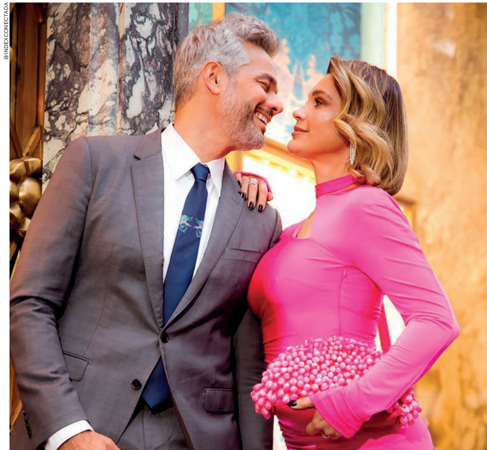
Flávia Alessandra e Otaviano Costa surgem deslumbrantes para apresentar o leilão do evento BrazilFoundation que comemorou a 20ª edição do evento de Gala filantrópico, quinta (21), em Nova York.