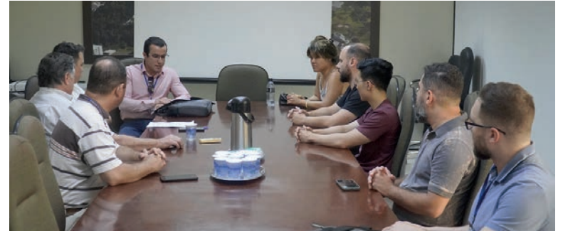
A fiscalização busca avaliar mecanismos adotados para redução dos riscos de desvios e corrupção em municípios de médio e grande portes