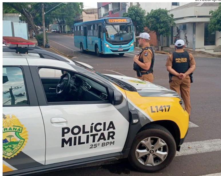
Segundo o comandante do Pelotão de Trânsito da PM, fiscalizações serão diárias e sem horário determinado

As principais causas de acidentes (em geral) são o avanço de preferencial, avanço de sinal vermelho, uso de aparelho celular na condução do veículo e a não indicação de seta de mudança de direção. Os cruzamentos com mais registros são entre a Rua Doutor Camargo e a Avenida Flórida; na Rua Ministro Oliveira Salazar, também com a Avenida Flórida; na Avenida Duque de Caxias, esquina com a Avenida Anhanguera; Avenida Rolândia com a Avenida Paraná e Avenida Paraná com a Avenida Apucarana.