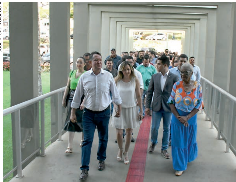
Voltando a ser vice-prefeito, Pimentel esperava que a decisão fosse definitiva para sanar a insegurança jurídica que envolve a administração de Umuarama

Ainda acrescentou que a cerimônia foi realizada para