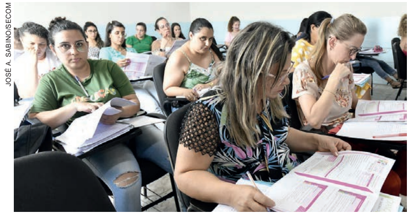
Uma formação tratou sobre integração sensorial, enquanto a outra assessoria pedagógica abordou a legislação referente à cultura brasileira e indígena