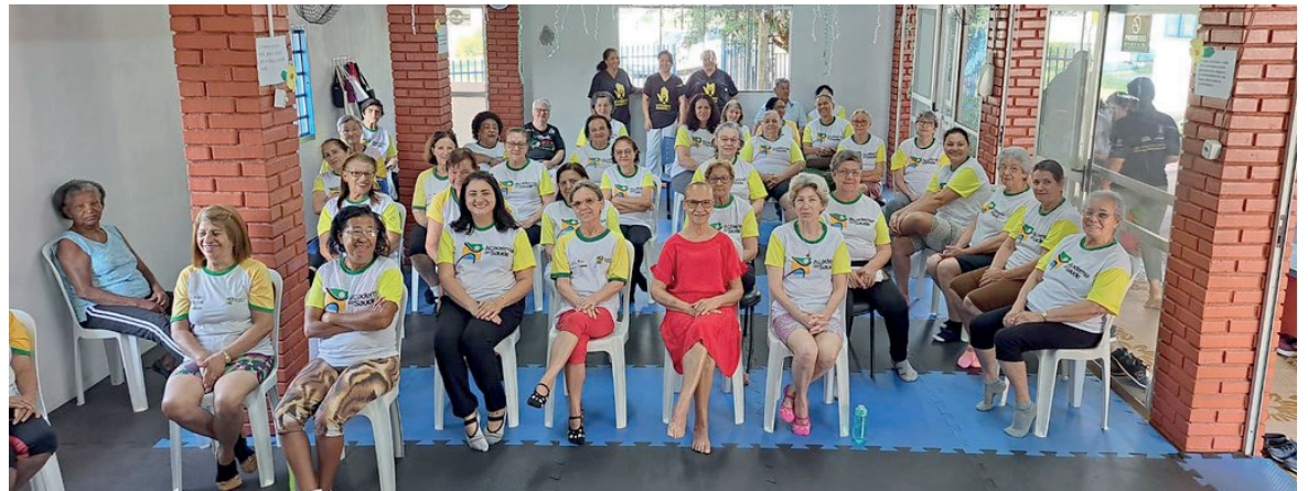
Profissionais de diversos setores da Secretaria de Saúde desenvolveram série de ações para abordar o tema

A psicóloga indicou também que os profissionais do SAP fizeram palestras em todas as escolas da rede estadual de ensino, considerando que a maior incidência de casos de ideação e tentativas são realizadas por adolescentes. “É