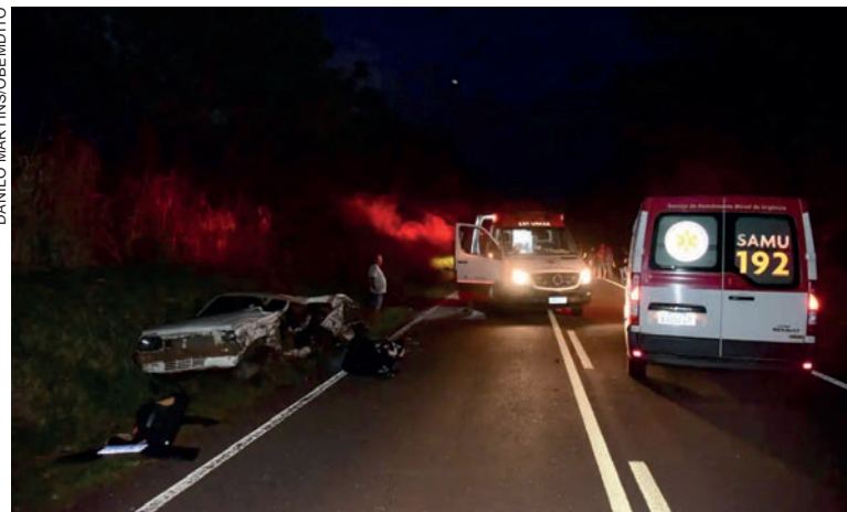
Monza ficou completamente destruído após a colisão que também envolveu um VW Virtus

não sofreu ferimentos, se recusou a receber a avaliação médica. Dentro de seu carro, foram encontradas garrafas de bebidas alcoólicas. O advogado do motorista informou que o cliente não consome bebida alcoólica e que estava em estado de choque.