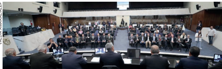
Grupo de trabalho que discute infraestrutura e logística do Estado foi instalado ontem (2), na Assembleia Legislativa do Paraná