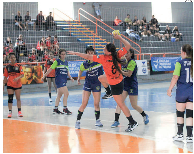
A equipe de Londrina estreou com vitória no handebol feminino, com direito a virada no placar sobre o Guarapuava por 24 x 22

Em Londrina, durante o último fim de semana (30/9 e 1/10), os melhores enxadristas jovens do Paraná cumpriram mais uma etapa em suas trajetórias na modalidade. Curitiba sagrou-se campeã no quadro de pontuação geral, tanto no masculino quanto no feminino. Destaque para as meninas de Piraí do Sul e os meninos de São José dos Pinhais pelas medalhas de prata, respectivamente. Em seguida, na ordem de classificação geral por pontos, Arapongas ficou com o bronze na terceira posição nas duas modalidades.