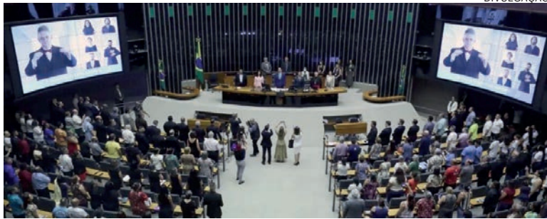
A PEC faz parte de uma ofensiva de grupos políticos conservadores do Congresso contra decisões recentes do STF

“O art. 49 da Constituição Federal passa a vigorar acrescido do seguinte inciso XIX: deliberar, por três quintos dos membros de cada