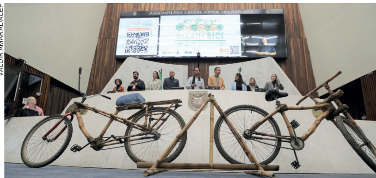
O segundo dia de evento debateu infraestrutura urbana para bicicletas, mostrou experiências dos municípios e abordou o desenvolvimento sustentável

A proposta aprimora a legislação, inclui o exercício de atividades preventivas com o apoio de engenheiros, garantindo o desenvolvimento sustentável e segurança pública dos cidadãos. “A profissão de engenheiro é fundamental para a concretização de empreendimentos de interesse social e humano que abrangem uma vasta gama de áreas, tais como aproveitamento de recursos naturais, infraestrutura de transporte e comunicação, edificações urbanas e rurais, além do desenvolvimento industrial e agropecuário”, diz o texto.