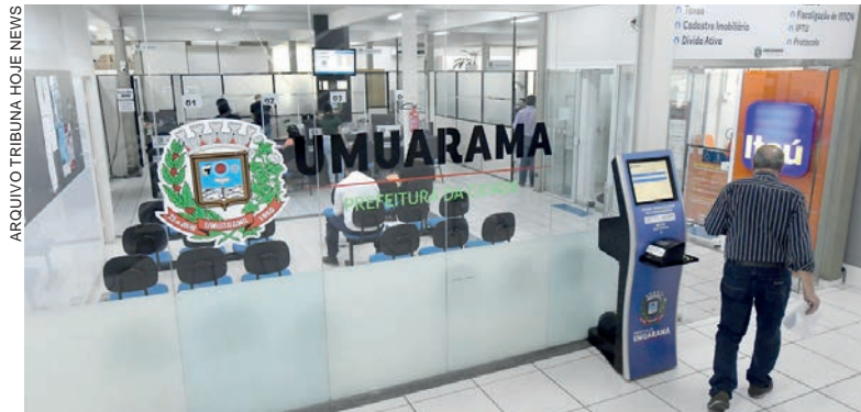
Umuarama recebeu em setembro deste ano, apenas de valores líquidos referentes ao ICMS, mais de R$ 58 mil

Os recursos referem-se à parcela dos municípios na arrecadação estadual de tributos e taxas. A transferência às prefeituras é estabelecida pela Constituição, que também determina que o Estado destine 20% do ICMS ao Fundo de Manutenção e Desenvolvimento da Educação