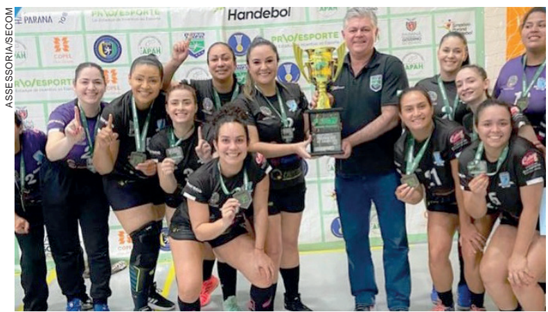
Meninas de Umuarama faturaram o ouro no Paranaense de Handebol Feminino, na Chave Prata. A fase final foi disputada em Curitiba