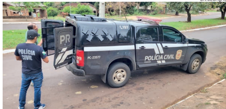
Homem condenado foi localizado e detido por força de ordem judicial de prisão por vários crimes

Após o cumprimento das formalidades legais, a detido foi conduzido à Cadeia Pública de Iporã.