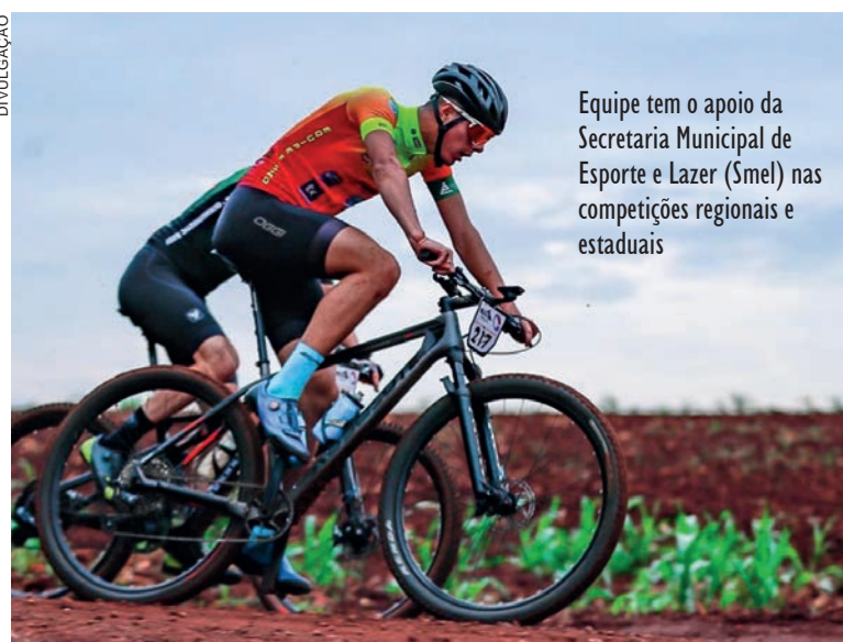
Equipe tem o apoio da Secretaria Municipal de Esporte e Lazer (Smel) nas competições regionais e estaduais

“Estamos felizes pelo crescimento do esporte em Umuarama e pelas conquistas daquele domingo: 29 atletas disputaram provas e conquistamos 25 pódios. É gratificante para a equipe e para os atletas ver que com apenas três anos de existência a equipe já é bem conhecida no Paraná e no Mato Grosso do Sul”, afirmou o