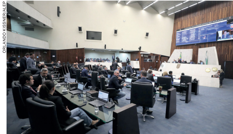
O projeto define que os recursos serão utilizados para o cumprimento da Lei que confere continuidade às atividades de fomento à cultura

Criada na esteira das leis emergenciais, a LPG representa um impulso na economia da cultura. Desde o ano passado, a SEEC promoveu diver-