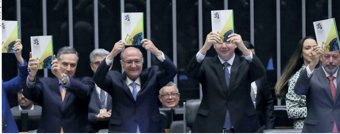
Congresso Nacional realizou sessão solene pelos 35 anos da Constituição Federal

O Congresso Nacional realizou, na manhã de ontem (5), uma sessão solene em comemoração aos 35 anos da Constituição Federal, em vigor desde 5 de outubro de 1988. Presentes na cerimônia, representantes dos três poderes (Executivo, Legislativo e Judiciário) discursaram em defesa da harmonia institucional.