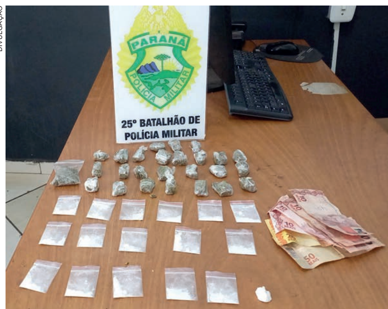
Drogas apreendidas com homem acusado de tráfico, ontem pela manhã em uma das ruas do bairro

No total, foram recolhidas no local 26 porções de maconha e 17 porções de co-