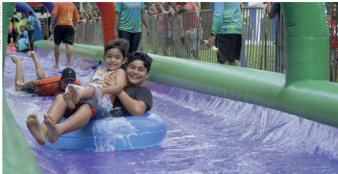
Brincadeiras para crianças de todas as idades com algumas atrações especiais, como o super toboágua, além de atividades esportivas e distribuição gratuita de pipoca a tarde toda