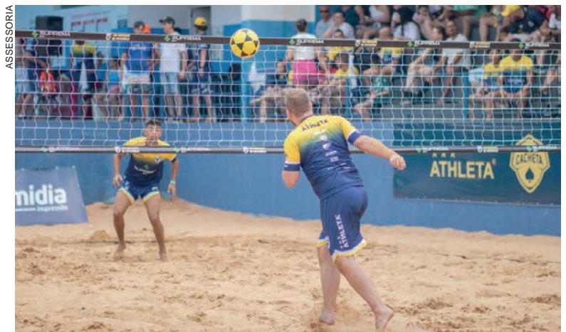
As dependências do Harmonia Clube de Campo ficaram lotadas e os atletas deram um show à parte durante a competição

Durante a competição, foram distribuídos R$ 10 mil em premiação entre as categorias, além dos troféus aos classificados.