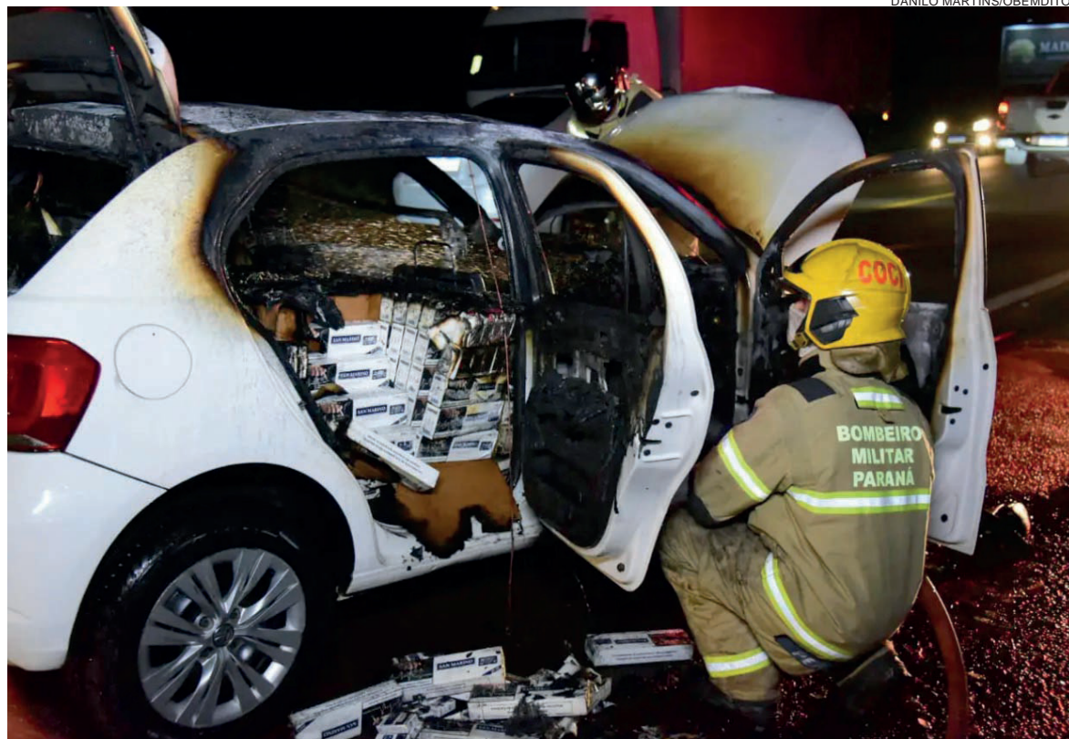
Carro carregado com cigarros foi incendiado pelo condutor, que fugiu do local e não foi identificado

Durante a investigação, foram encontrados aproximadamente 500 pacotes de cigarros da marca San Marino,