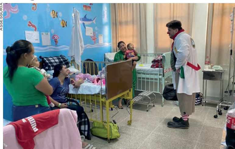
O voluntário é conhecido nos hospitais, onde interpreta diversos personagens e manipulada fantoches para alegrar pacientes, acompanhantes e profissionais de saúde

Outros estudos indicam que terapias de cunho lúdico provocam mudança no comportamento dos pacientes e estimulam a melhora nos quadros clínico e emocional, além de reduzir o estresse no período de internação.