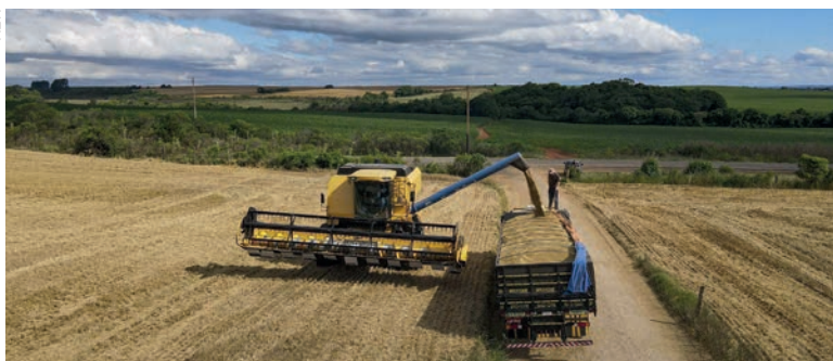
O boletim aponta que 11% da área com cevada já está colhida. O volume é bastante superior à média de 2% neste mesmo período em anos anteriores

O tempo chuvoso também preocupa os produtores de