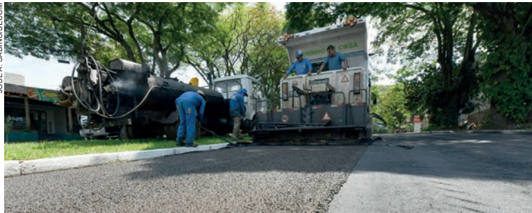
A capa de micro sela o pavimento evita que a umidade se infiltre para o solo e reduz o risco de surgirem trincas e buracos no asfalto