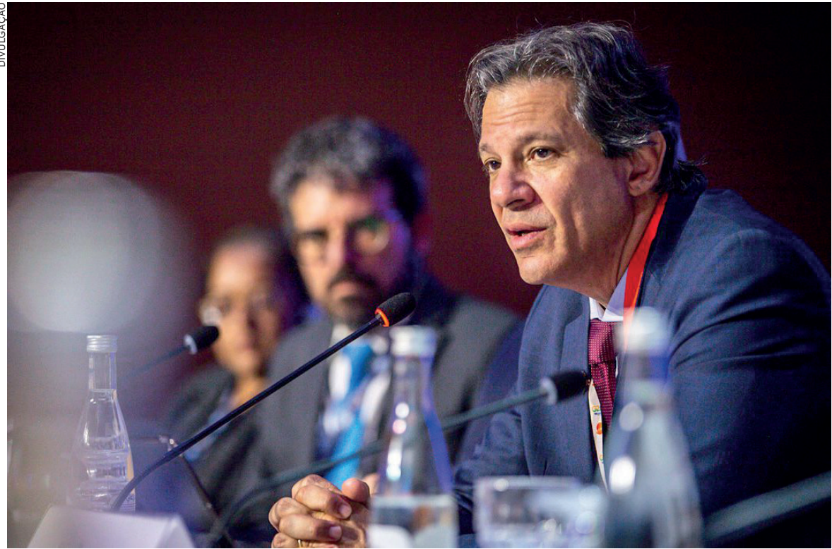
Em Marrocos, o ministro da Fazenda se reuniu com a diretora do Fundo

As cotas são revistas a pelo menos a cada cinco anos, pelo Conselho de Governadores do FMI, considerando as