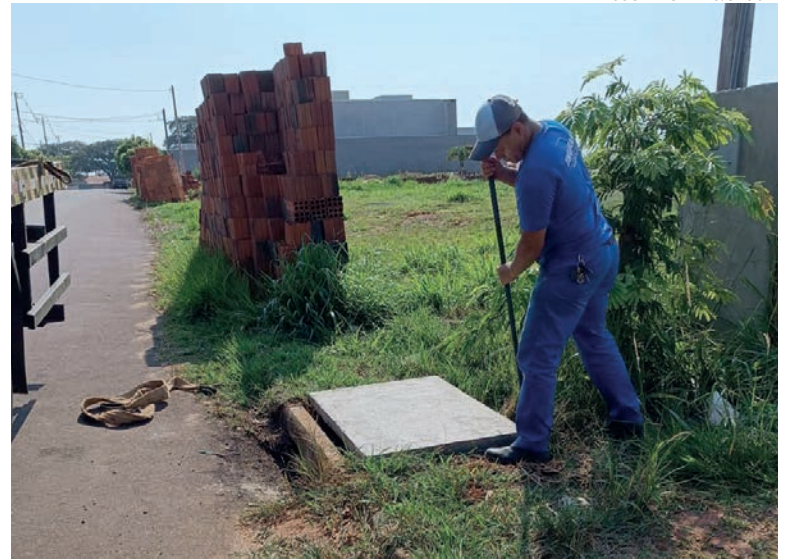
O município também tem feito a substituição de tampas quebradas de bueiro e a reposição onde as tampas foram furtadas ou simplesmente desapareceram

A manutenção é constante, pois caso haja entupimento podem ocorrer alagamentos em dias de chuva forte, um problema recorrente em Umuarama. “Infelizmente, uma parte da população joga lixo nas ruas – em vez de procurar uma lixeira ou colocar para a coleta – e tudo acaba indo parar nas bocas de lobo e galerias pluviais, causando entupimento e o