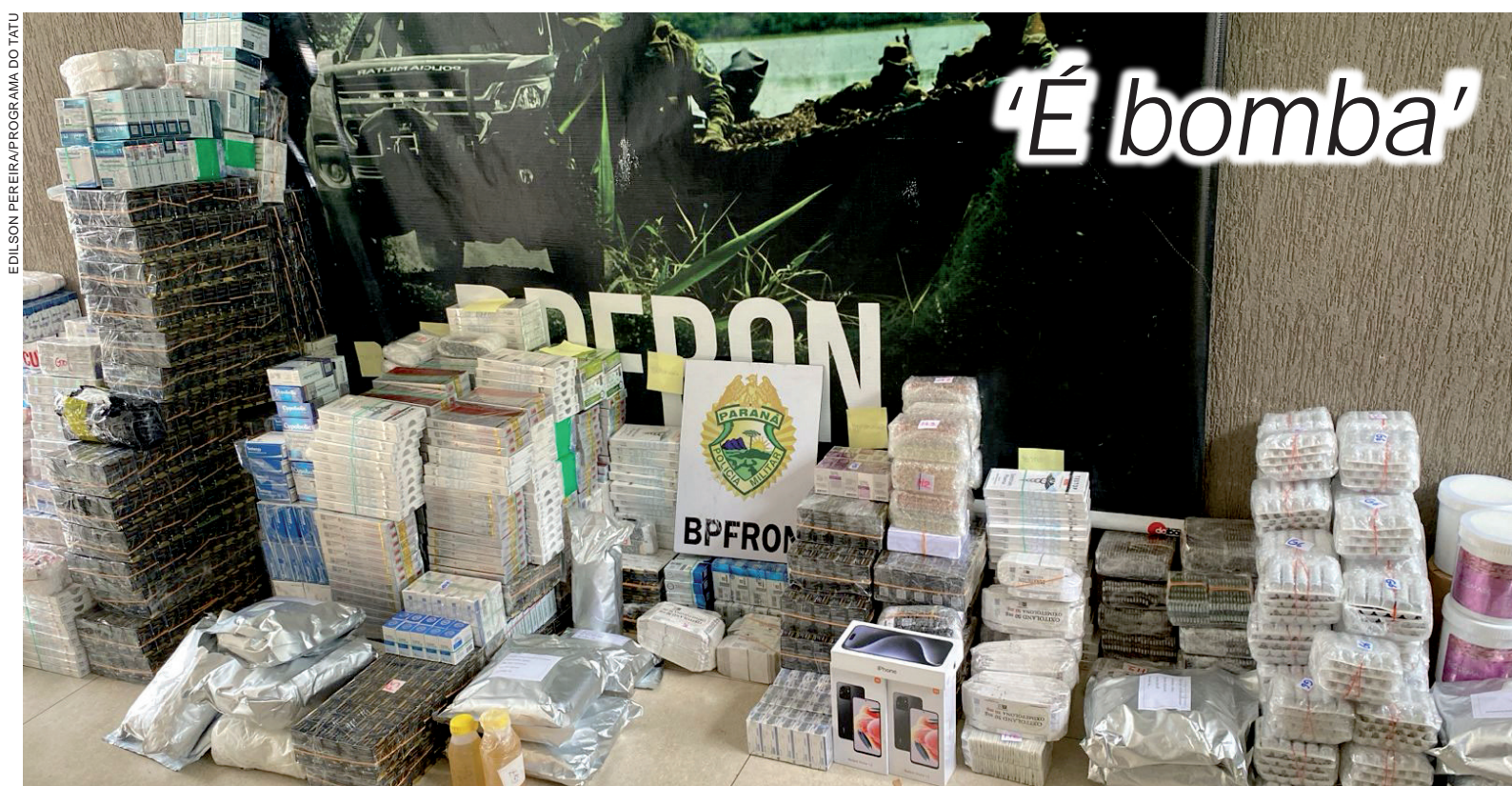
EDILSON PEREIRA/PROGRAMA DO TATU