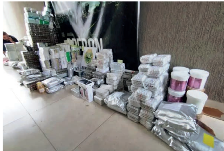
Anabolizantes de diversas marcas e tipos, injetáveis, em pó, cápsulas, além de inibidores de apetite e telefones celulares foram apreendidos

O valor total do contrabando foi estimado em mais