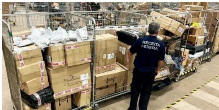
No total, foram mais de R$ 2.4 milhões em mercadorias destinadas à várias Associações da região Noroeste

A entrega será feita no Depósito de Mercadorias da Receita Federal em Maringá, localizado na Avenida Bento Munhoz da Rocha Neto, 454. Foram beneficiadas, além da Apae de Umuarama, as Associações de Maringá, Araruna, Fenix, Godoy Moreira, Ivaté, Loanda, Maria Helena, Nossa Senhora das Graças, Novo Itacolomi, Peabiru, Santo Antônio do Caiuá, São João do Caiuá, São Jorge do Ivaí e Tamboara.