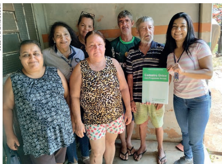
Objetivo é facilitar a vida dos cidadãos auxiliando no processo de atualização dos cadastros sociais

Ela acrescenta ainda que as equipes de entrevistadores do Cad-Único que trabalham dentro dos Cras (em Umuarama são três unidades) fazem constantemente as visitas para atualização, principalmente para os cidadãos que encontram-se acamados, que têm algum tipo de deficiência motora ou limitante e também os idosos. “Os documentos obrigatórios para fazer o cadastro é apenas o CPF e o RG de todas