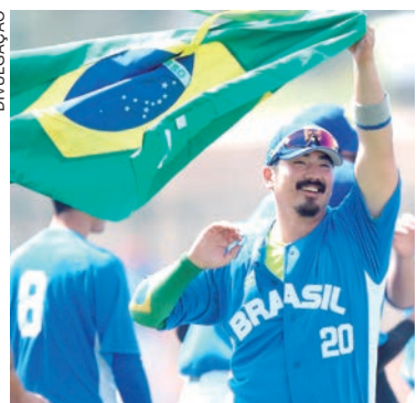
País leva vantagem para o super-round que define os finalistas

Os adversários do Brasil no super-round serão Panamá e México (classificados no Grupo A). O terceiro jogo no