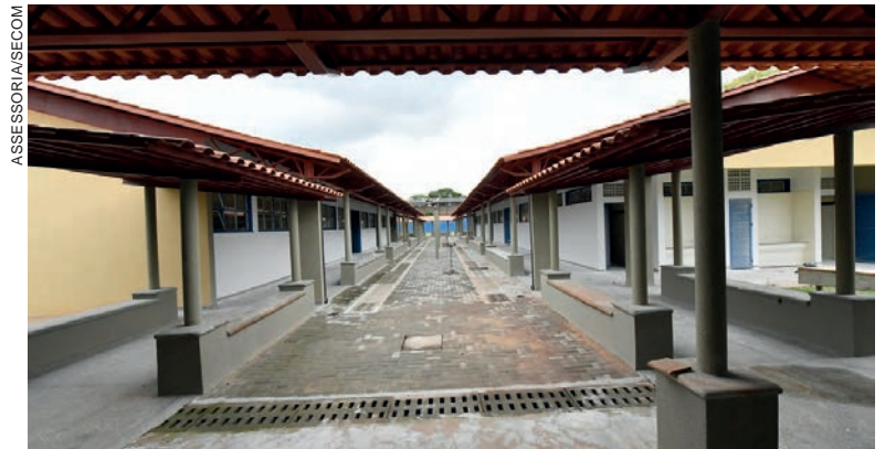
O processo de criação seguiu todas as orientações do Sistema de Educação do Paraná, por meio do Núcleo Regional de Umuarama

“Já temos um recurso de R$ 1,3 milhão pactuado com o Ministério da Educação, do Programa Escola em Tempo