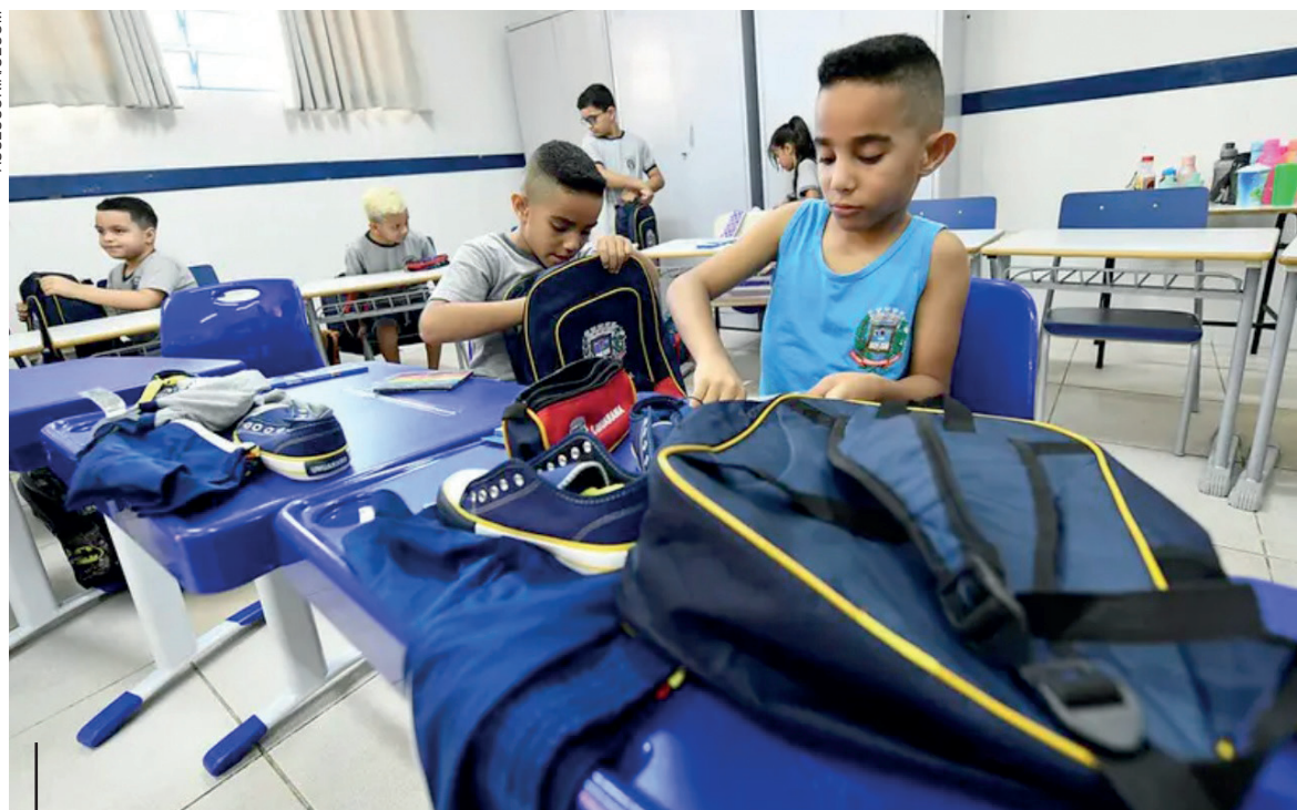
Ofício enviado ao prefeito Celso Pozzobom foi assinado pelo próprio ministro Camilo Sobreira de Santana