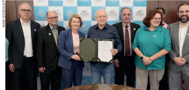
O evento na presidência do legislativo estadual contou com representantes de diversas entidades e órgãos da área de saúde

A telessaúde contribui para garantir a qualidade e o fluxo de atendimento da população no sistema de saúde. Na medida em que grande parcela dos atendimentos refere-se a situações mais simples, a “fila” anda com mais celeridade. Dessa forma, permite melhores condições para os atendimentos mais complexos.