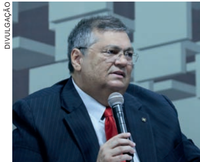
Flávio Dino participou de audiência pública na Câmara dos Deputados

“Inclusive, espero que, quando houver [a apresentação das] emendas parlamentares – e já que esta Casa tem revelado tanto preocupação com a