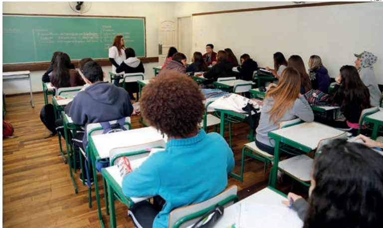
Previsão é contratar mais 203 psicólogos e 100 assistentes sociais para acompanhamento de alunos e professores de escolas estaduais