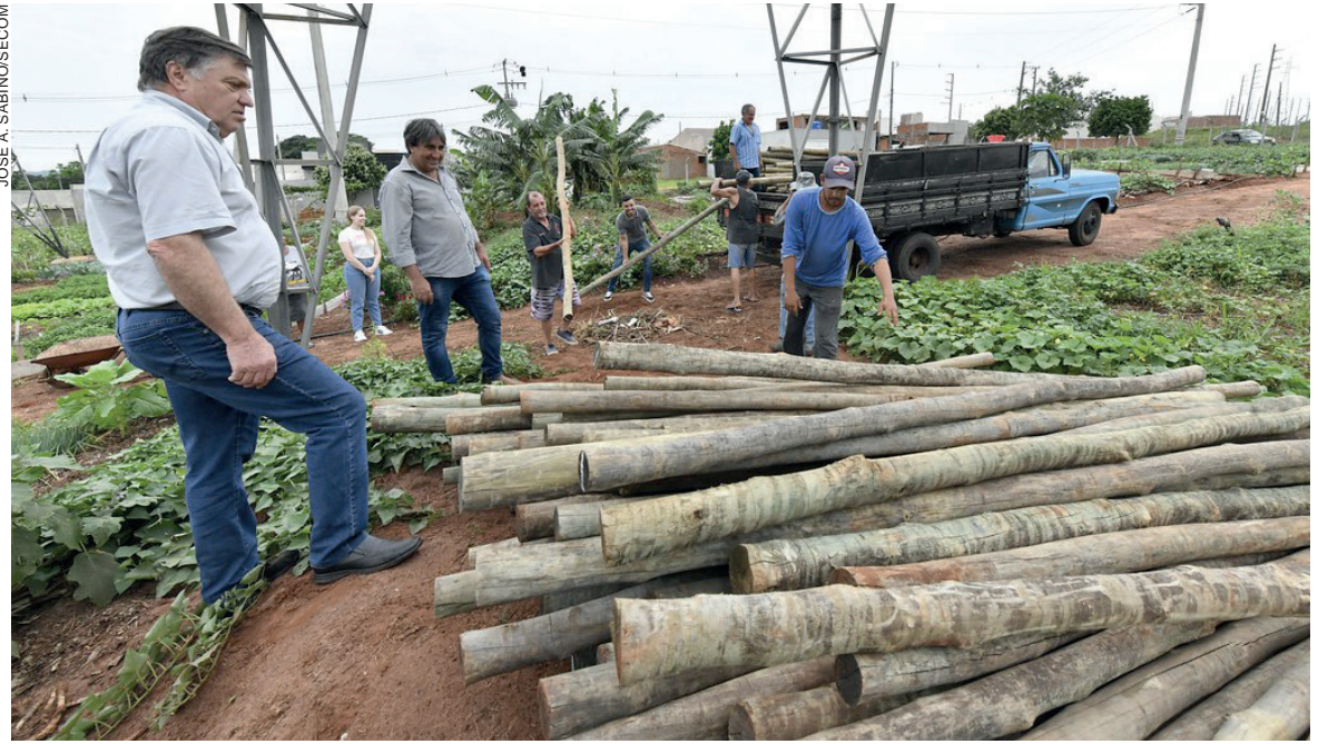
O projeto beneficia mais de duas dezenas de famílias que produzem alimentos de qualidade para o próprio consumo e para comercialização