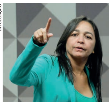
Eliziane já havia entregado o relatório ao advogado-geral da União, Jorge Messias, que orientou a equipe a avaliar as medidas para punir os denunciados

"A investigação foi concluída e nós vamos agora aprofundar a fiscalização e responsabilizar todos os culpados", disse Bruno Dantas. O TCU possui atualmente oito processos relacionados a temas apurados pela CPMI, como a compra de veículos blindados da empresa Combat Armor