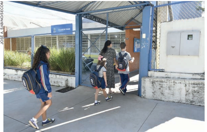
O processo conta com 52 candidatos na fase atual. A prova foi aplicada ontem (30) à noite

Na última semana a Secretaria de Educação divulgou o edital 04/2023 com o ensalamento dos candidatos aptos a participar da prova escrita do processo de escolha e exercício do mandato de 2024 a 2026 dos gestores escolares, que deverão adentrar ao local de prova até as 18h50. Os