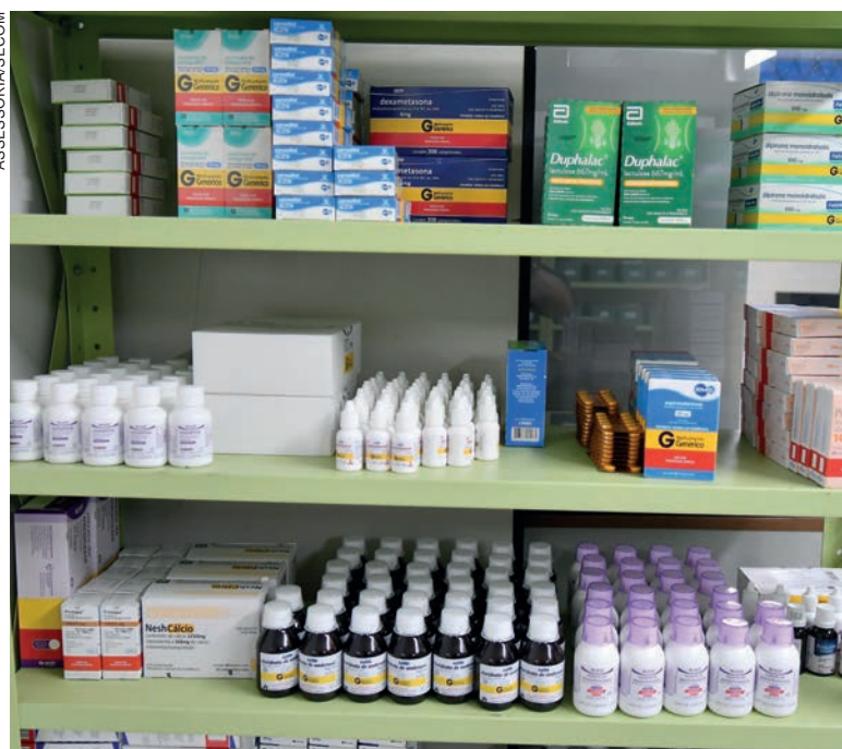
Unidade havia interrompido a distribuição de medicamentos aos usuários no início da pandemia