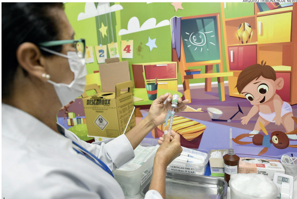
As cinco vacinas mais aplicadas foram contra HPV, febre amarela, difteria e tétano, Poliomielite e Tríplice Bacteriana

O relatório apresentado pela Divisão de Imunização da SMS apresenta ainda que, com relação às faixas etárias que mais compareceram às unidades de saúde, em primeiro lugar foram as crianças com idade entre 5 e 9 anos (4.800), 10 a 14 (4.706) e 2 a 4 anos (2.480). "É importante reforçar que, apesar de a fase estadual da Campanha Nacional de Multivacinação ter sido encerrada no dia 28 de outubro, todas as unidades de saúde continuam disponibilizando todos os imunizantes de rotina e também de influenza e covid", observa Rafaella Naves, coordenadora do programa.