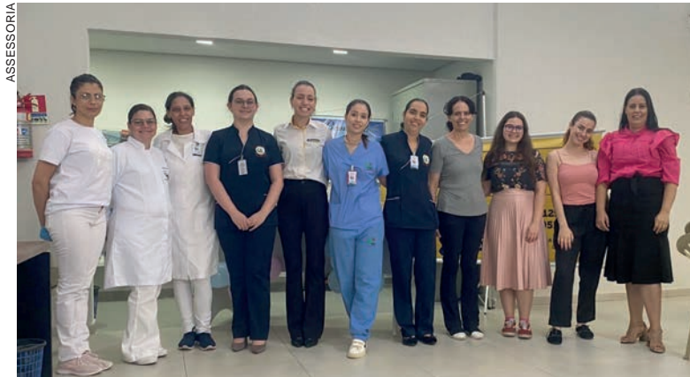
Enfermeiros, técnicos de enfermagem do Hospital Cemil e equipe da Casa da Sopa, na ação das campanhas Outubro Rosa e o Novembro Azul

dino foi criada em 1977 e hoje é uma referência em segurança alimentar e nutricional, oferecendo alimentação de forma gratuita à população em vulnerabilidade social, como moradores de rua. Em média, são atendidas 120 pessoas por dia, com almoço completo. A Casa da Sopa também fornece cestas básicas, produtos de higiene e trabalha na garantia de direitos para essa parcela da população que, muitas vezes, é negligenciada e esquecida pela sociedade.