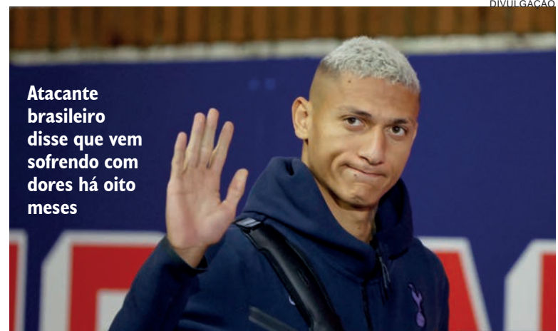
Atacante brasileiro disse que vem sofrendo com dores há oito meses

Claro que fiquei triste ali na hora de não estar, mas entendo o Diniz. Se eu fosse ele, também não me convocava. Não venho apresentando um bom futebol, venho devendo", afirmou.