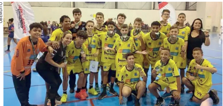
O time enfrentou a equipe Handebol Cascavel juvenil e venceu por 30 a 14

O time de Handebol de Umuarama conquistou a medalha de bronze no Campeonato Paranaense de Handebol Infantil, realizado na última segunda-feira (6) em Apucarana. Eles enfrentaram a equipe Handebol Cascavel juvenil e venceram por 30 a 14.