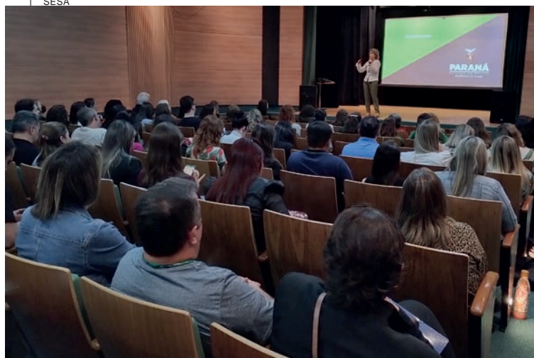
no auditório da Biblioteca Pública do Paraná, em Curitiba, também aborda as atualizações do calendário vacinal propostas pelo Programa Nacional de Imunização (PNI). Será discutido, ainda, o processo de avaliação e monitoramento das etapas anteriores já realizadas pelo PlanificaSUS Paraná.

“Essa é uma opção que beneficia todas as partes envolvidas: a empresa deixa de constar como devedora e o Estado recupera receita e reduz o passivo que os precatórios representam para os cofres públicos”, destacou o procurador-geral do Estado, Luciano Borges.