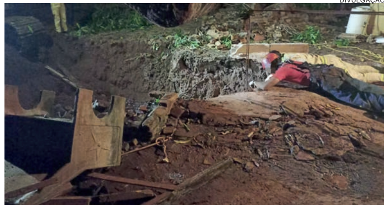
Momento em que bombeiro tentava içar o homem que caiu no poço de sua residência

O Samu (Serviço de Atendimento Móvel de Urgência) de Cafetal do Sul e de Umuarama foram ao local para ficar de prontidão para atendimento à vítima.