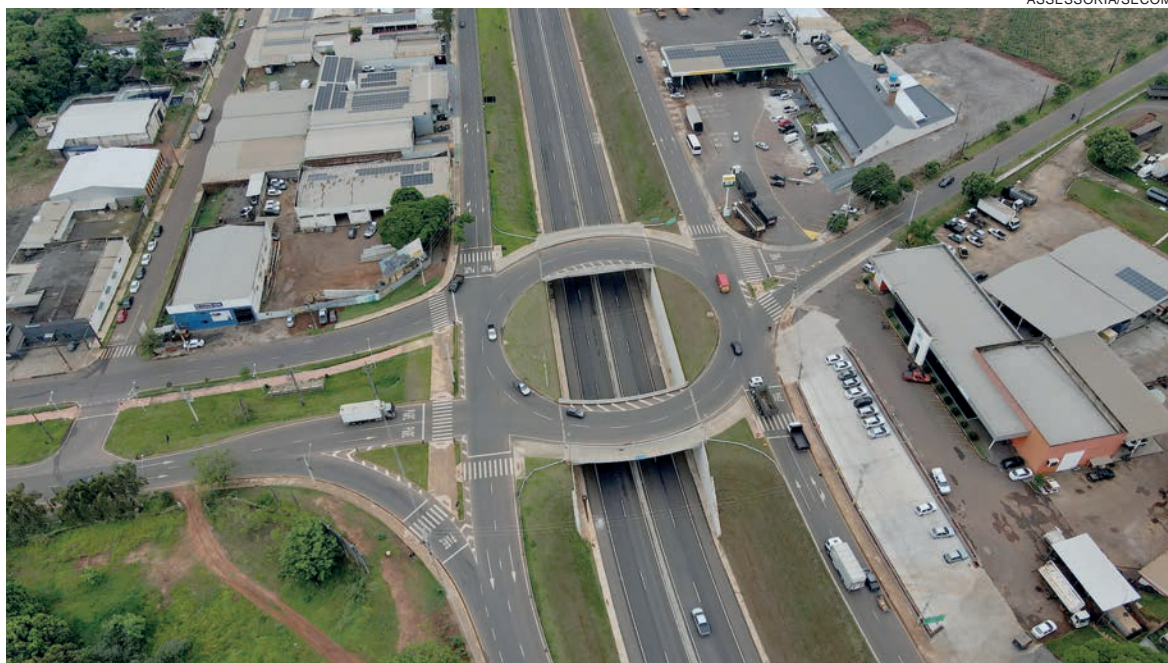
Além de resolver o maior gargalo rodoviário local devido ao intenso fluxo de veículos, a obra demonstrou a importância de Umuarama e região para o governador

“Vai ser uma grande honra receber o governador Ratinho Junior, secretários e demais autoridades para esse momento tão importante para