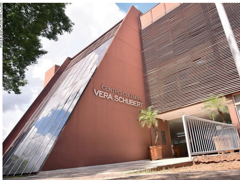
Apresentações serão de graça na sexta, com a Cia Schubert, e no sábado, com o Coral Municipal