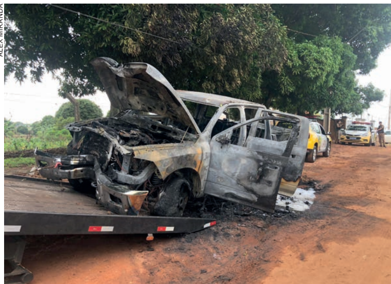
Veículo incendiado apresentou avarias na parte frontal. Polícia investigará se ela está envolvida em acidente fatal na rodovia PR-482

ajuda por volta da 1h, quando entrou em contato com a Polícia Militar.