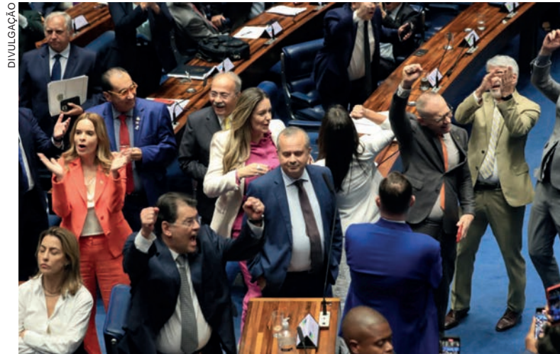
O placar no Senado foi de 53 a 24. A votação em primeiro turno foi concluída pouco depois das 19h. A aprovação exigia o voto de pelo menos 49 dos 81 senadores

tributos em apenas três, o Imposto sobre Bens e Serviços, a Contribuição sobre Bens e Serviços e o Imposto Seletivo, o texto vai reduzir a complexidade burocrática, o que possibilitará às empresas concentrar recursos e esforços em seus negócios principais, fomentando a inovação e estimulando o crescimento econômico”, ressaltou Pacheco.