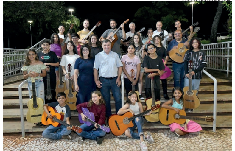
Espectáculo gratuito será dia 17, a partir das 19h30, teatro do Centro Cultural Vera Schubert

As aulas de violão do projeto Musicalização nos Bairros estão no Jabuticabeiras, Industrial, San Remo, Bonfim e Dom Pedro II, Conjunto Sonho Meu, Conjunto Guarani, Alto São Francisco, Jardim Belvedere, Parque 1º de Maio e São Cristóvão. "Além das apresentações dos alunos do projeto, termos