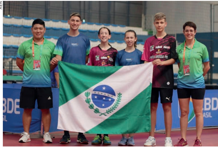
Resultado está muito próximo do campeão, Santa Catarina, que fechou com 45 ouros. No total, o Paraná trouxe 115 medalhas, atrás apenas de São Paulo, com 121