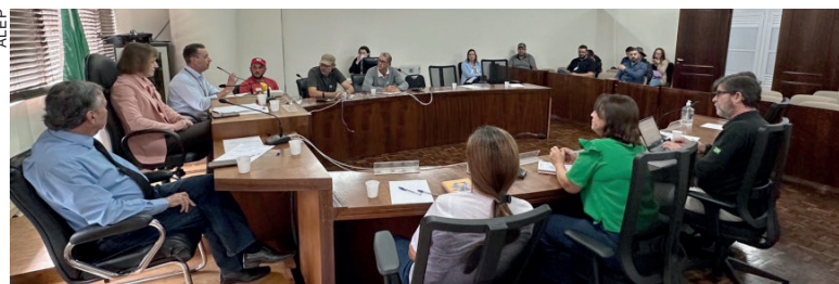
A burocracia e a falta de regularização fundiária são alguns dos motivos e alegações institucionais que têm colocado inúmeros obstáculos no atendimento às famílias

As reivindicações partem das comunidades: Ocupação Urbana Marielle Franco e Elza Soares, em Palmas; Acampa-