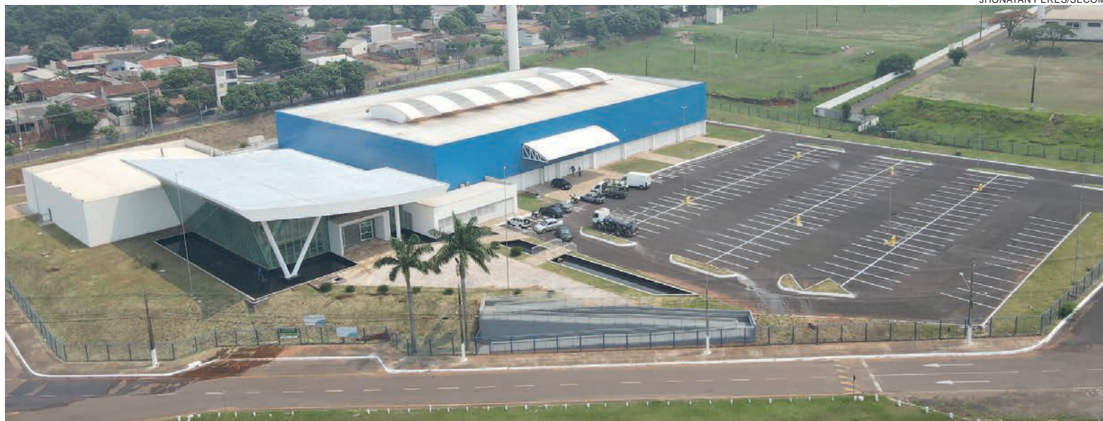
Para a inauguração, nesta terça-feira, são esperadas autoridades estaduais e nacionais, além das lideranças locais e regionais

“Como podemos ver, a participação dos nossos deputados foi decisiva para a construção do Centro de Eventos.