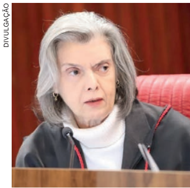
A magistrada entende que as condições de elegibilidade devem ser analisadas no momento em que é registrada a candidatura

O tema é discutido em sessão do plenário virtual que teve início na última sexta-feira (17). Os ministros analisam um ação movida pelo Solidariedade. Até então, haviam