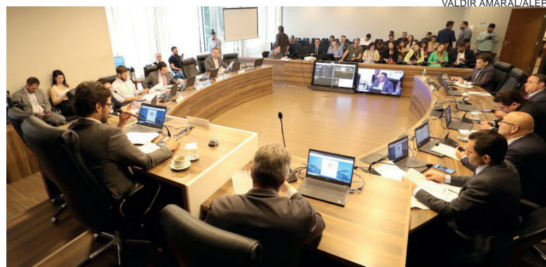
Solicitação do governo estadual tem efeitos até de 180 dias em 15 municípios atingidos pelas chuvas

A proposta reconhece o estado de calamidade pública em Clevelândia, General Carneiro, Mallet, Palmeira, Paulo Frontin, Pitanga, Porto Amazonas, Prudentópolis, Rebouças, Rio Azul, Rio Negro, Roncador, São João do Triunfo, São Mateus do Sul e União da Vitória pelo prazo de 180 dias. De autoria da Comissão Executiva da Alep, o projeto reconhece, para os fins do disposto no artigo 65