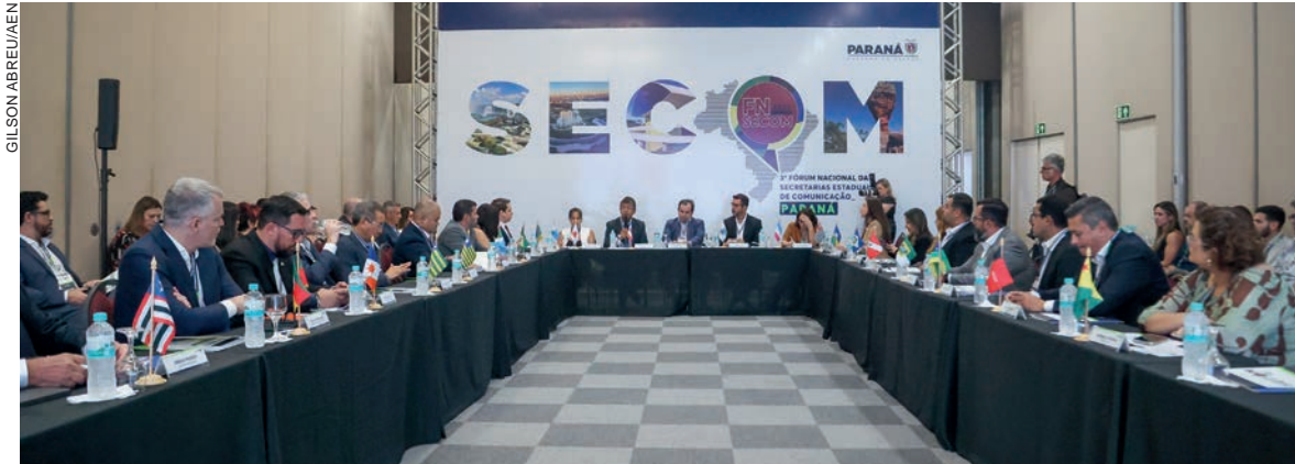
Principais temas em debate são a transparência na gestão pública, o combate à desinformação e a comunicação direta com a população

Com foco na transparência da gestão dos recursos públicos, comunicação no ambiente digital e combate às fake news, começou ontem (20), em Foz do Iguaçu, o 3º Fórum Nacional das Secretarias de Comunicação. Esta é a primeira vez que o encontro, que nesta edição reúne representantes de 22 estados e do Distrito Federal, acontece no Paraná.