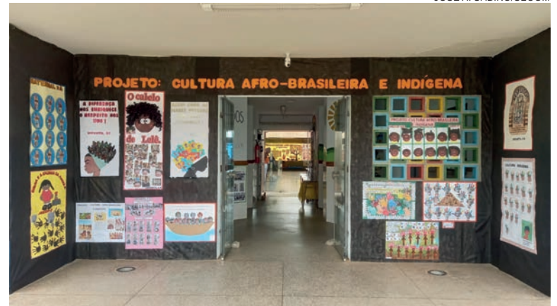
Durante o mês de novembro foram realizadas diversas apresentações artísticas, mostras culturais e atividades em sala de aula

As atividades iniciaram no último dia 14, no Centro Municipal de Educação Infantil (CMEI) Helena Kolody, tiveram o ponto alto nesta