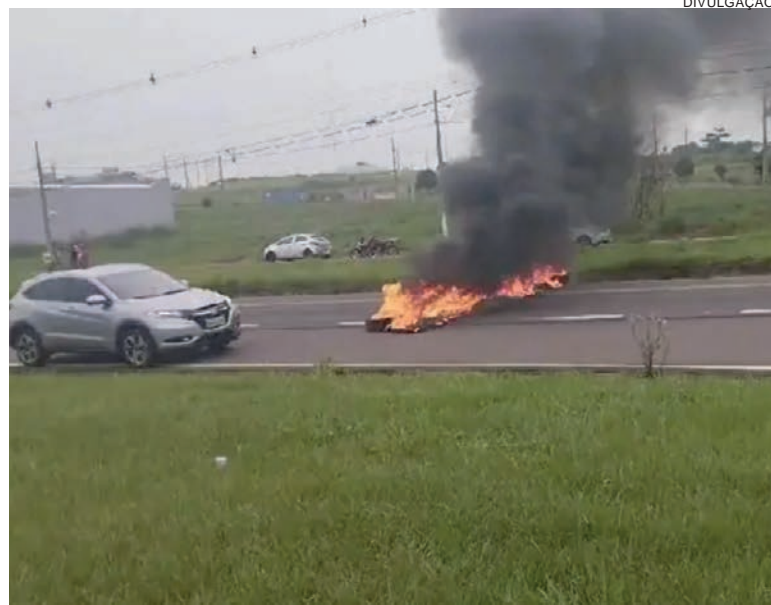
Autores do incêndio criminoso não foram identificados pela polícia

politano informaram, no início da noite deste domingo (19) que