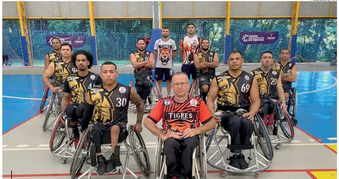
Além do destaque no Parajaps, a equipe Adefiu/Tigres Umuarama acumulou outros feitos notáveis nesta temporada

Os atletas, treinadores e apoiadores foram parabenizados pela trajetória marcante e