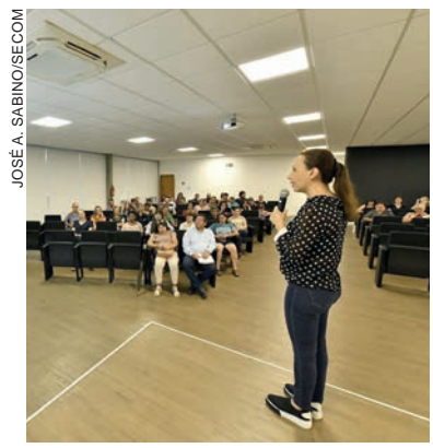
Treinamento foi oferecido gratuitamente pela Secretaria Municipal de Agricultura

do Banco de Alimentos de Umuarama. Durante seis horas os feirantes debateram técnicas e indicações detalhadas que constam na Resolução da Diretoria Colegiada emitida pela Anvisa, cujo foco é a preocupação que se deve ter com as Doenças Transmitidas por Alimentos (DTA). "As DTA são aquelas provocadas pelo consumo de alimentos com micróbios prejudiciais à saúde, parasitas ou substâncias tóxicas", detalhou Huana.