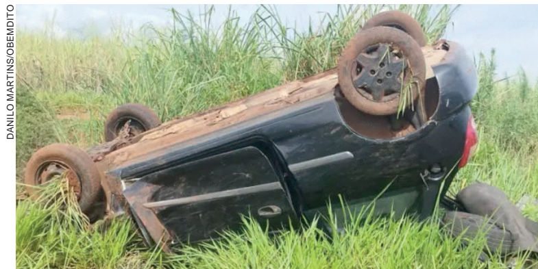
Veículo parou com as quatro rodas para cima depois do acidente que deixou a condutora ferida

Após o acidente, populares ajudaram a desvirar o Celta, que havia parado com as quatro rodas viradas para cima.