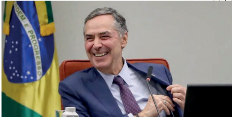
Barroso afirma que a PEC que limita decisões individuais dos ministros da Corte “não é necessária e não contribui para a institucionalidade do país”

“O Supremo Tribunal Federal não vê razão para mudanças constitucionais que visem a alterar as regras de seu funcionamento. Num país que tem demandas importantes e urgentes, que vão do avanço do crime organizado à mudança climática que impactam a vida de milhões