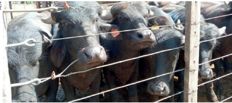
R$ 31,5 milhões referem-se à comercialização de bubalinos de corte, e R$ 8,2 milhões do leite de búfala

O município de Cerro Azul, na Região Metropolitana de Curitiba, é o principal produtor estadual de leite de búfala,