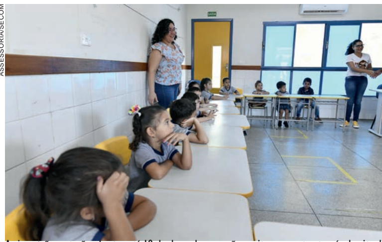
As inscrições estarão abertas até 19 de dezembro e serão aceitas somente através do site da Unioeste/Cogeps, mediante o preenchimento on-line de formulário próprio

Conforme o cronograma do concurso, o edital definitivo de