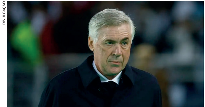
Presidente da CBF disse em julho que técnico assumiria Brasil em 2024

em andamento”, disse uma fonte da CBF. “Nada mudou na posição do presidente desde a última vez que ele falou com a imprensa. O plano é Carlo Ancelotti e estamos muito confortáveis e confiantes com o compromisso que temos de fazer isso acontecer”. Rodrigues disse, em março, que Ancelotti era o favorito da seleção, e, em julho, na apresentação do interino Diniz, ele continuou confiante: “Ele [Ancelotti] estará aqui, podemos ter certeza disso”. Ancelotti, no entanto, sempre se recusou a entrar na discussão. “Não penso nisso [em meu futuro]”, afirmou. “Estou orgulhoso que a seleção brasileira esteja falando sobre mim, mas não vou falar sobre meu futuro até que meu contrato termine”. “No final, no máximo seria uma espera de seis meses. O que são seis meses diante de uma decisão de uma vida