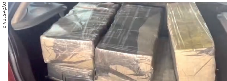
Droga estava sendo transportada no porta-malas do veículo e duas pessoas foram presas em flagrante

Ao fim a PRF divulgou que apesar de ter somente 20 anos, o morador de Palotina já esteve envolvido em uma ocorrência de tráfico em 2019; uma receptação de um F250 em 2023; e agora a nova ocorrência de tráfico. O caso foi repassado à Polícia Civil de Guaíra.