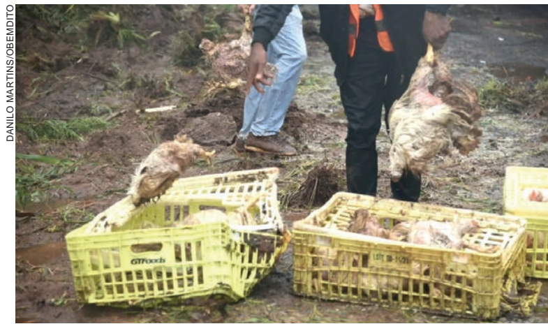
Frangos morreram depois que caminhão que os transportava tombou na pista durante a madrugada

As aves ficaram espalhadas pela pista e, ainda durante a manhã, a rodovia permanecia parcialmente interditada enquanto as operações de desmontamento do caminhão eram realizadas. Até as 11h30, a rodovia continuava interditada no sentido de Cruzeiro do Oeste para Umuarama.