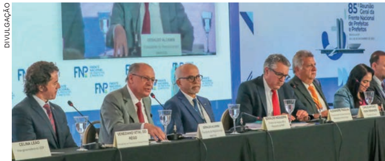
Recursos são compensação da redução de transferências ao Fundo de Participação dos Municípios

Até esta data, o Novo PAC Seleções recebeu inscrições de projetos de governos municipais e estaduais para compras e, também, para a realização de obras com recursos do governo federal, em áreas