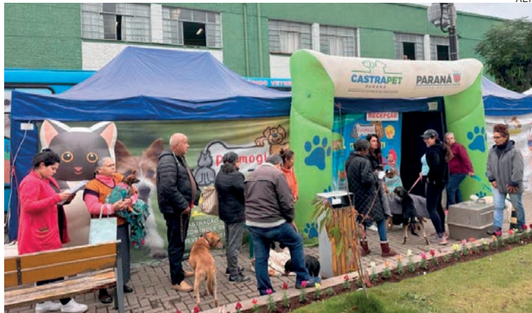
O programa é executado com recursos de emendas parlamentares e do Tesouro do Estado, além do suporte logístico dos municípios

“A iniciativa não se limita apenas a controlar a reprodução de animais, almeja promover uma comunidade mais