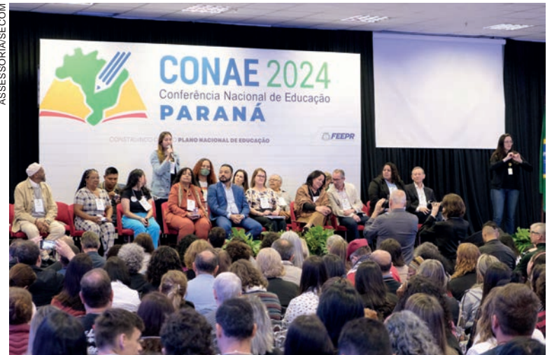
Município teve cinco participantes entre os cerca de 600 delegados que realizaram debates para construir propostas ao novo Plano Nacional de Educação

A conferência nacional é o mais importante espaço democrático de reconstrução de consensos entre atores sociais diversos no país, apontando novas perspectivas para organizar o ensino na forma de um