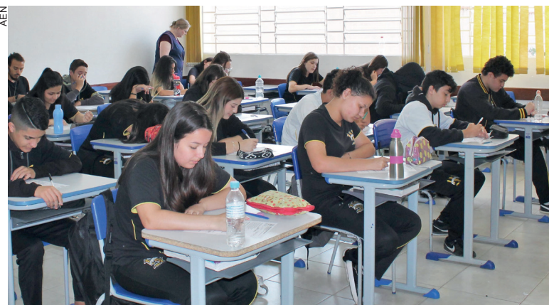
Direito à isenção vai para estudantes que estejam matriculados no 3º ano do ensino médio em escolas públicas, ou cursado todo o ensino médio na rede pública

“O Enem é mais uma oportunidade de ingresso no ensino superior para o estudante paranaense, que já conta com o Aprova Paraná Universidades”, disse o secretário estadual da Educação, Roni Miranda. “A isenção da taxa de inscrição é uma maneira de democratizar