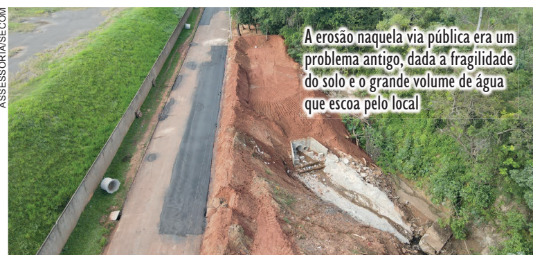
A erosão naquela via pública era um problema antigo, dada a fragilidade do solo e o grande volume de água que escoava pelo local

A erosão naquela via pública era um problema antigo, dada a fragilidade do solo e o grande volume de água que escoava pelo local, explicou o secretário de Obras, Planejamento Urbano e Projetos Técnicos, Renato Caobianco. Ele disse que o prefeito Fernando Scanavaca determinou prioridade no serviço, executado