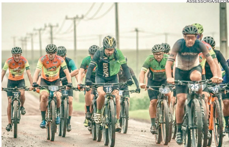
Com 208 atletas da região, a equipe representou a Capital da Amizade no evento com 10 atletas que fizeram bonito e conquistaram sete pódios

Nesta etapa os atletas percorreram 63 km de percurso na categoria PRÓ e 32 km na categoria Sport enfrentando muita lama de terra vermelha, pois choveu praticamente a prova