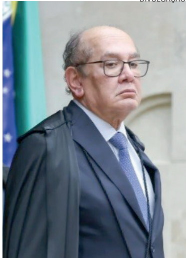
Corte vai definir regras gerais sobre contratos de prestação de serviços

Gilmar é relator desse julgamento. O ministro afirmou que há um grande número de