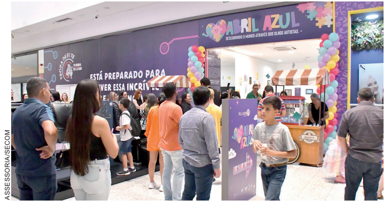
A iniciativa conta com o apoio do SAP (Serviço de Atendimento Psicológico) e do IAITEA – Instituto de Atendimento ao Indivíduo com TEA