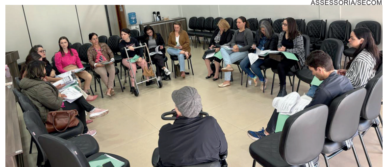
Além de explicações gerais sobre a conferência, a comissão apresentou o tema deste ano

Sobre os Grupos de Trabalho, foi definido que a composição mínima será um coordenador (a), um facilitador (a) e um relator (a) escolhido pelo grupo. Após discussões e debate, o grupo deverá elaborar cinco propostas por esfera de governo (municipal, estadual e federal), moções e coleta de assinaturas e, por fim, indicar delegados(as) para a etapa estadual.