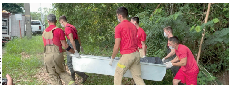
Corpo foi recolhido dos fundos da mata no Lago Aratimbó no final da manhã do domingo

A Polícia Civil de Umuarama instaurou um inquérito para investigar a morte de uma pessoa cujo corpo em avançado estado de decomposição foi encontrado nos fundos do Lago Aratimbó, na tarde do domingo (4). O corpo segue sem identificação oficial no IML.