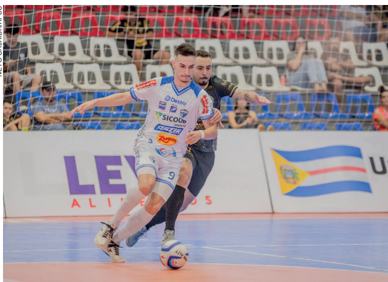
O time da Capital da Amizade foi derrotado por 4 a 2 na manhã do último domingo