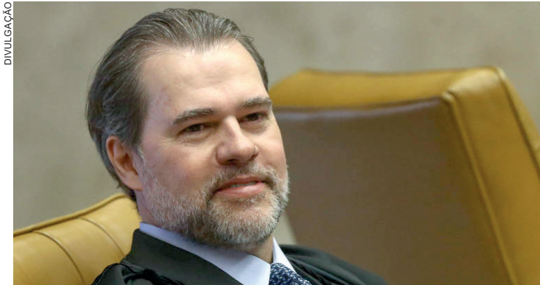
Decisão foi adotada pelo ministro Dias Toffoli durante o recesso do Judiciário

Outro ponto que chama atenção é a adoção dessas medidas durante o recesso forense. Tradicionalmente, o STF atua em regime de plantão apenas em situações excepcionais,