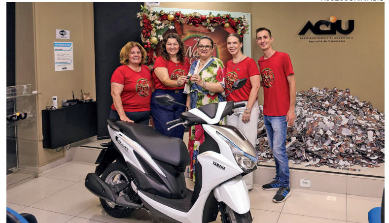
Mais de 200 empresas da cidade participaram da campanha e uma moto foi sorteada exclusivamente entre os lojistas

“Atingimos nossos objetivos ao promover o comércio local, impulsionar as vendas e premiar os consumidores que compraram nas lojas participantes. Também ficamos felizes em valorizar os empresários que participaram ativamente da campanha, com o sorteio exclusivo de uma moto