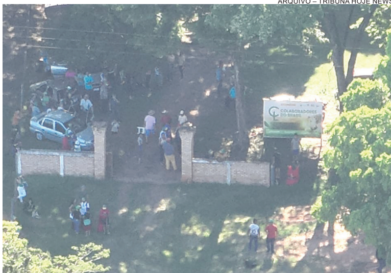
As forças de segurança acompanham as negociações entre os ocupantes e os responsáveis pela área, buscando manter a ordem e evitar confrontos