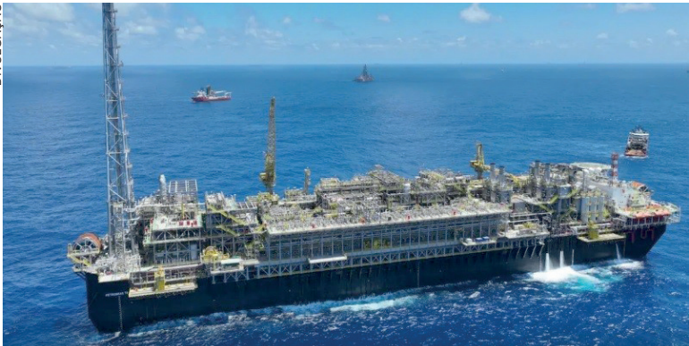
A P-78 é a sétima em operação no Campo de Búzios, o maior do país em reservas e que, em outubro de 2025, superou a marca de 1 milhão de barris por dia

A Petrobras iniciou, na semana passada, a produção de petróleo do navio-plataforma P-78, no Campo de Búzios, no pré-sal da Bacia de Santos. Com capacidade de produzir 180 mil barris de óleo e 7,2 milhões de metros cúbicos (m³) de gás diários, o navio-plataforma aumentará a capacidade instalada de produção do campo para aproximadamente 1,15 milhão de barris de petróleo por dia. Além disso, a operação permitirá exportar gás para o continente, via interligação com o gasoduto Rota 3 (antigo Comperj), em Itaboraí (RJ) expandindo a oferta de gás no Brasil em até 3 milhões de m³ por dia. “Com o primeiro óleo da P-78, iniciamos o ano já avan-