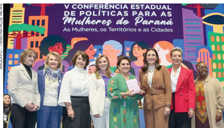
Balanço anual apresenta iniciativas parlamentares, audiências públicas e articulações voltadas aos direitos das mulheres

No campo institucional, articulações resultaram no Projeto Cartório Acolhedor, autorizado pelo Tribunal de Justiça do Paraná, e no acompanhamento de políticas como o Programa Recomeço, o Projeto Ampara e a criação da primeira Câmara Criminal especializada em violência