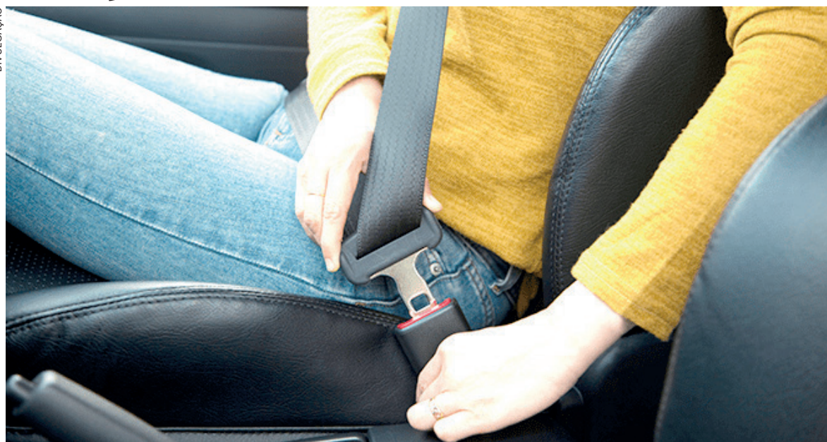
O USO correto do cinto de segurança por todos os ocupantes do veículo elevam a segurança no trânsito