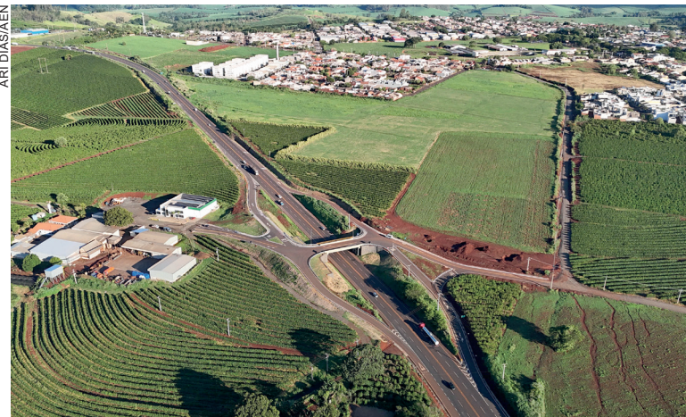
O montante supera o desempenho de 2024, quando foram empenhados R$ 6,41 bilhões, e representa mais que o dobro do volume registrado em 2018, que foi de R$ 3,2 bilhões

Os R$ 7,18 bilhões investidos em 2025 se materializam em diferentes áreas e em todas as regiões do Paraná. Desse total, R$ 1,81 bilhão foi destinado à aquisição de equipamentos e materiais permanentes. As obras também tiveram peso significativo nesse resultado histórico, somando mais de R$ 1,82 bilhão em intervenções como construção de escolas e hospitais, melhorias na infraestrutura e ações em dezenas de rodovias estaduais.