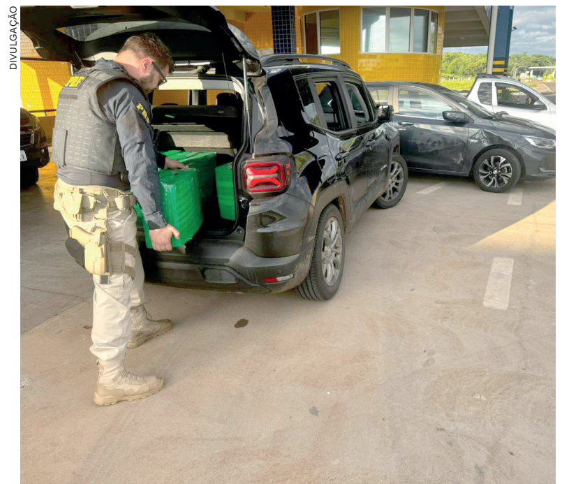
VEÍCULOS foram recolhidos ao pátio do Posto de Fiscalização da PRF em Alto Paraíso e droga foi encaminhada à Delegacia de Polícia em Umuarama

Mesmo após a colisão, o motorista do Renegade seguiu em alta velocidade, sendo acompanhado pela equipe policial. Próximo ao quilômetro 8 da rodovia, o suspeito abandonou o automóvel e fugiu a pé em direção a uma área de mata fechada. Apesar das buscas realizadas, ele não foi localizado até o momento. No interior do veículo abandonado, os policiais encontraram diversos fardos de maconha, que totalizaram mais de