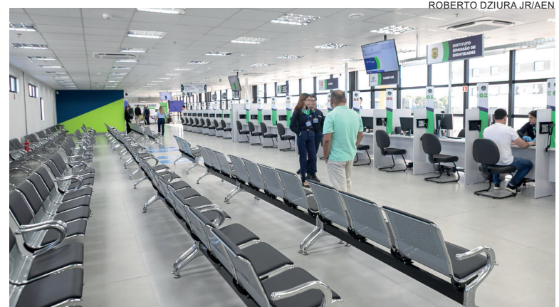
A iniciativa evita que os paranaenses precisem peregrinar pelas cidades para emitir documentos ou solicitar serviços

Em Londrina, a segunda a entrar em atividade no Estado, foram 37.721 atendimentos até a parada do Ano Novo. O Poupatempo Paraná tem sedes em Ponta Grossa (16.582 atendimentos), São José dos Pinhais (20.892), Maringá (14.606), Foz do Iguaçu (4.297), Araucária (4.538), Cascavel (5.699) e Umuarama (2.608). Em testes estão, além da terceira unidade na Capital, as de Colombo (2.898) e Guarapuava (667). Os espaços em Araucária, Cascavel, Umuarama e as três ainda em fase de avaliação e ajus-