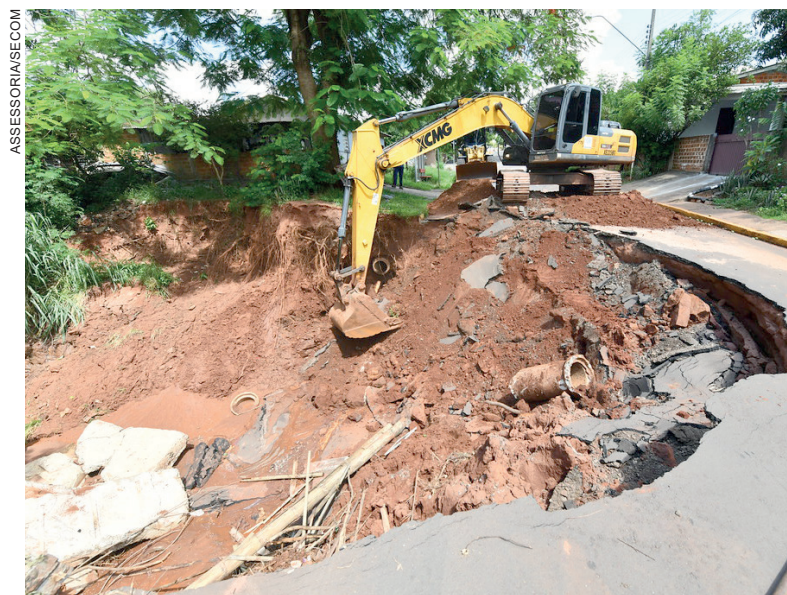
Um dos pontos mais críticos, levou à interdição de uma rua que liga dois bairros na região do San Remo, onde a enxurrada arrancou parte do asfalto

Conforme a Defesa Civil, houve estragos nas imediações da ponte do Jardim São Cristóvão, na rua Santo André, onde parte da calçada se erodiu; na rua Diamante, no Lago Tucuruvi, um foco de erosão afetou o sistema de esgoto da Sanepar; na rua Califórnia também surgiu uma pequena erosão envolvendo o sistema de coleta de esgoto; e na avenida Rio Grande