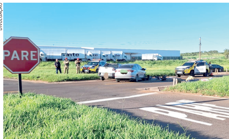
ACIDENTE envolvendo dois veículos ocorreu em rotatória; vítimas tiveram ferimentos leves e moderados

A condutora da Fiat/Strada, uma mulher de 49 anos, não sofreu ferimentos. Ela foi submetida ao teste do etilômetro, que apontou