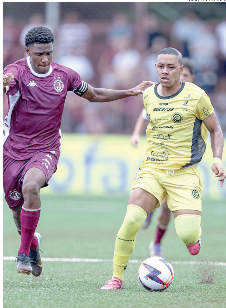
APÓS empate na estreia, Cascavel tenta primeira vitória e liderança

em quase todas as partidas. Na atual temporada, Vinícius Júnior soma 25 partidas disputadas, com cinco gols marcados e oito assistências, em 1.859 minutos em campo. São números modestos para quem já decidiu finais de Champions League, mas ainda suficientes para mantê-lo em destaque no cenário internacional. Além da busca por jogadores, o clube inglês também procura um novo técnico, já que no primeiro dia de 2026 Enzo Maresca foi demitido.