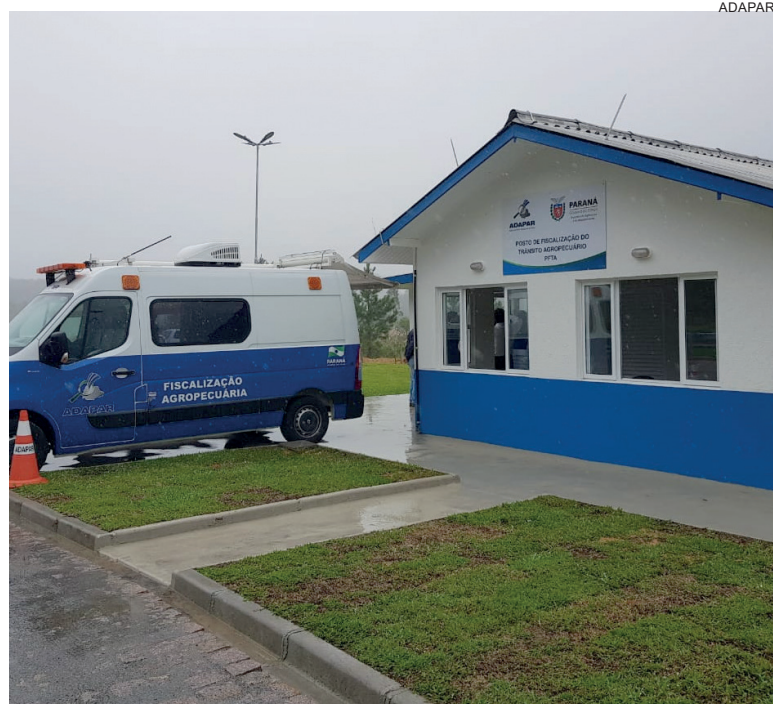
A principal medida é a incorporação de tecnologia nas divisas e a implementação de fiscalização volante

Com o novo modelo, 12 Postos de Fiscalização do Trânsito Agropecuário (PTTA) serão desativados a partir do dia 10: dez na divisa com Santa Catarina, um na divisa com São Paulo e um na divisa com Mato