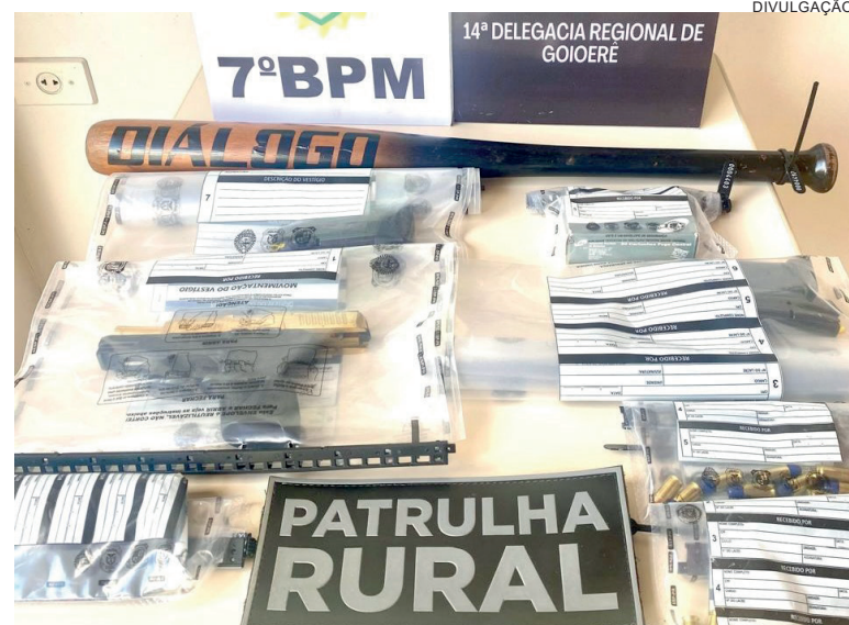
Polícia Civil e Militar cumprem mandado de busca e apreensão e apreendem pistola, munições e taco de beisebol

As autoridades também ressaltam que denúncias anô-