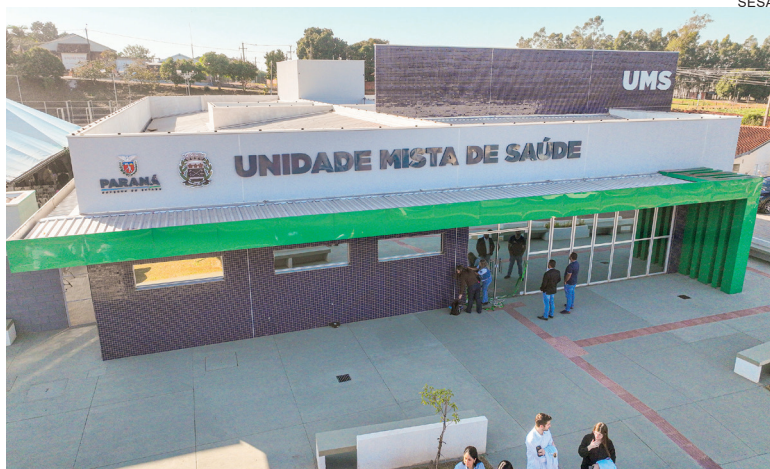
Prestes a completar seis meses, a unidade tem alta demanda e a resolutividade do modelo que integra, em um só local, serviços de Atenção Básica e urgência 24 horas

Outras áreas também apresentaram números expressivos, como ortopedia, com 230