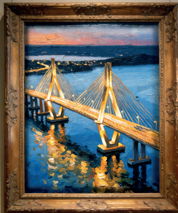
Ponte de Guaratuba

PARANÁ GOVERNO DO ESTADO Terra de gente que trabalha e cuida