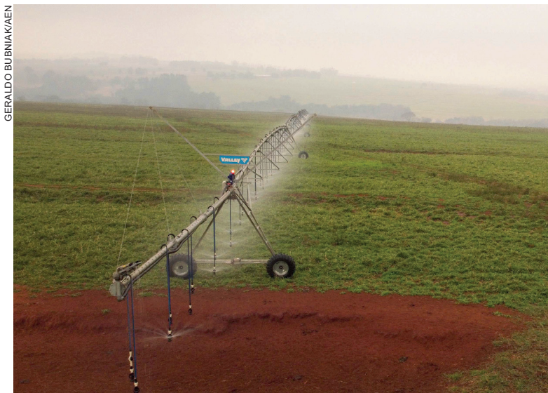
Em 2025, foram 11 contratos em oito municípios, para benefícios em plantio de hortaliças e efeito estruturante para grãos

Criado para aumentar a área irrigada do Paraná e fortalecer a resiliência climática do agronegócio, o Irriga Paraná combina linhas de crédito com juros subsidiados, apoio à agricultura familiar e investimentos em pesquisa e capacitação voltados a sistemas irrigados