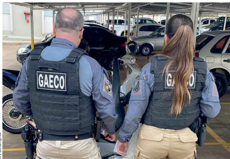
Mandados de prisão e busca e apreensão são cumpridos em sete municípios do Paraná; investigação aponta irregularidades em unidades da PM

Além do mandado de prisão preventiva, a Justiça determinou o afastamento de dois