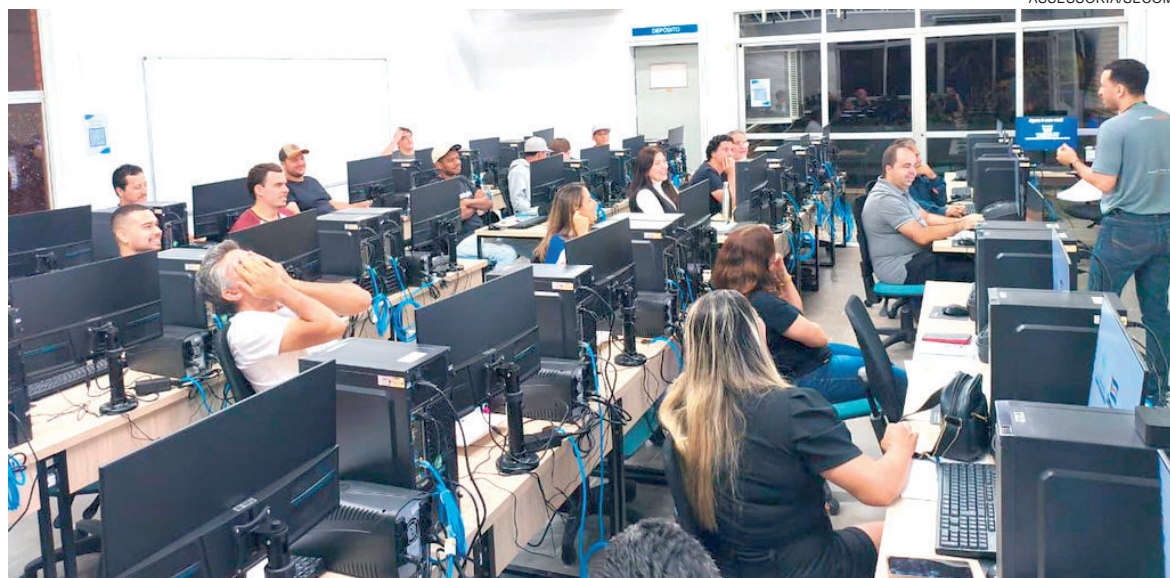
PROFESSORES e pesquisadores discutiram caminhos para fortalecer a pesquisa científica, ampliar programas e consolidar a produção acadêmica regional

"O TechnoPark nasceu com o propósito de conectar universidade, poder público,