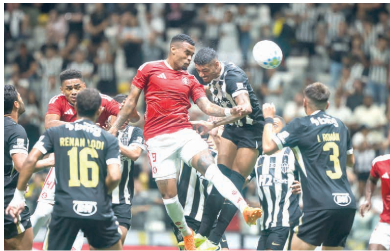
INTER cria oportunidades, não converte em gol e segue na ZR do Brasileirão

Destaque para o tetracampeão (2017/2023/2024/2025) Pato Futsal, que estreia no estadual contra o Palmas Futsal. O duelo será realizado na Arena Cláudio Petrycoski, em Pato Branco. Em Guarapuava, o CAD jogará a partir das 20 horas con-