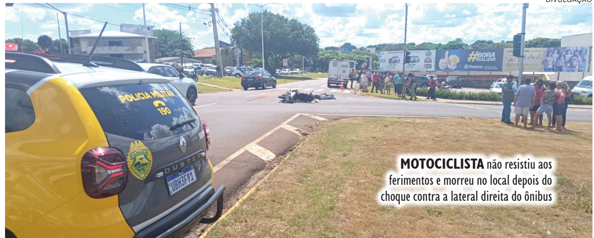
MOTOCICLISTA não resistiu aos ferimentos e morreu no local depois do choque contra a lateral direita do ônibus

hum aluno ficou ferido no acidente. As crianças que estavam no veículo seguiam dentro das normas de segurança exigidas para o transporte escolar e eram acompanhadas por monitor. Após o ocorrido, os estudantes foram transferidos para outro ônibus, que concluiu o trajeto até seus destinos.