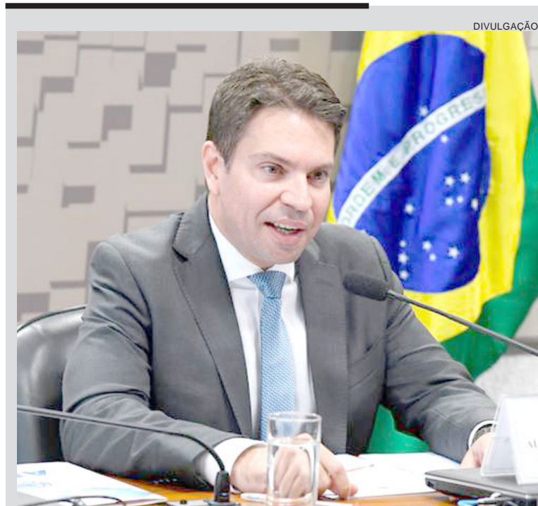
A Procuradoria-Geral da República (PGR) pediu nesta quinta-feira (12) a condenação do ex-deputado Alexandre Ramagem pelos crimes de dano qualificado e deterioração de patrimônio da União relacionados aos atos de Ataques de 8 de janeiro de 2023. A ação foi retomada pelo ministro Alexandre de Moraes em dezembro de 2025. Inicialmente, Ramagem respondia por cinco crimes, mas dois ocorreram após sua diplomação como deputado. Em maio, a Câmara dos Deputados suspendeu a ação, decisão aceita pelo Supremo Tribunal Federal. Após perder o mandato, a suspensão deixou de ter efeito.

O gabinete do ministro Flávio Dino foi questionado e, por meio da assessoria, foi informado que não haveria comentários sobre o assunto. O Tribunal de Justiça do Maranhão também não se manifestou.