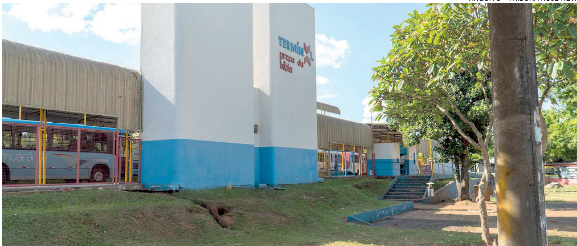
PROJETO integra plano prometido em campanha e amplia requalificação urbana iniciada na antiga rodoviária

Atualmente, a área é classificada como bem de uso comum do povo, o que impede alterações estruturais mais profundas. Com a desafetação, o espaço passará a ter outra destinação jurídica, permitindo intervenções urbanísticas que viabilizem sua readequação conforme o planejamento do município. De acordo com a administração municipal, a proposta atende a uma demanda antiga da