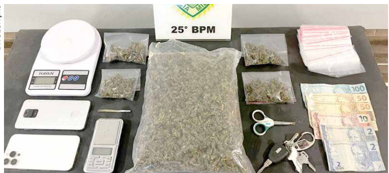
DROGA foi apreendida e traficante foi capturado e preso em flagrante pela Polícia Militar

lizava a motocicleta para fazer entregas de drogas, caracterizando o esquema de “delivery”. Ela foi presa e encaminhada à 7ª SDP de Umuarama. A motocicleta e os materiais foram apreendidos. A PM destaca a importância das denúncias anônimas no combate ao tráfico.