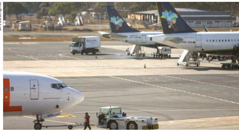
PETROBRAS anunciou aumento de 55% no combustível usado na aviação

A Abeaer representa as empresas Azul, Boeing, Gol, Gol Log, Latam, Latam Cargo, Rima, Si-