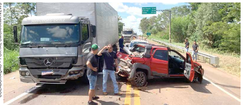
COLABORAÇÃO - PORTAL UMUARAMA NEWS

Com o impacto, a caminhonete rodou sobre a pista, e o motorista perdeu o controle da direção. Na sequência, o veículo atingiu a lateral de uma van que trafegava no sentido a Umuarama, ampliando a gravi-