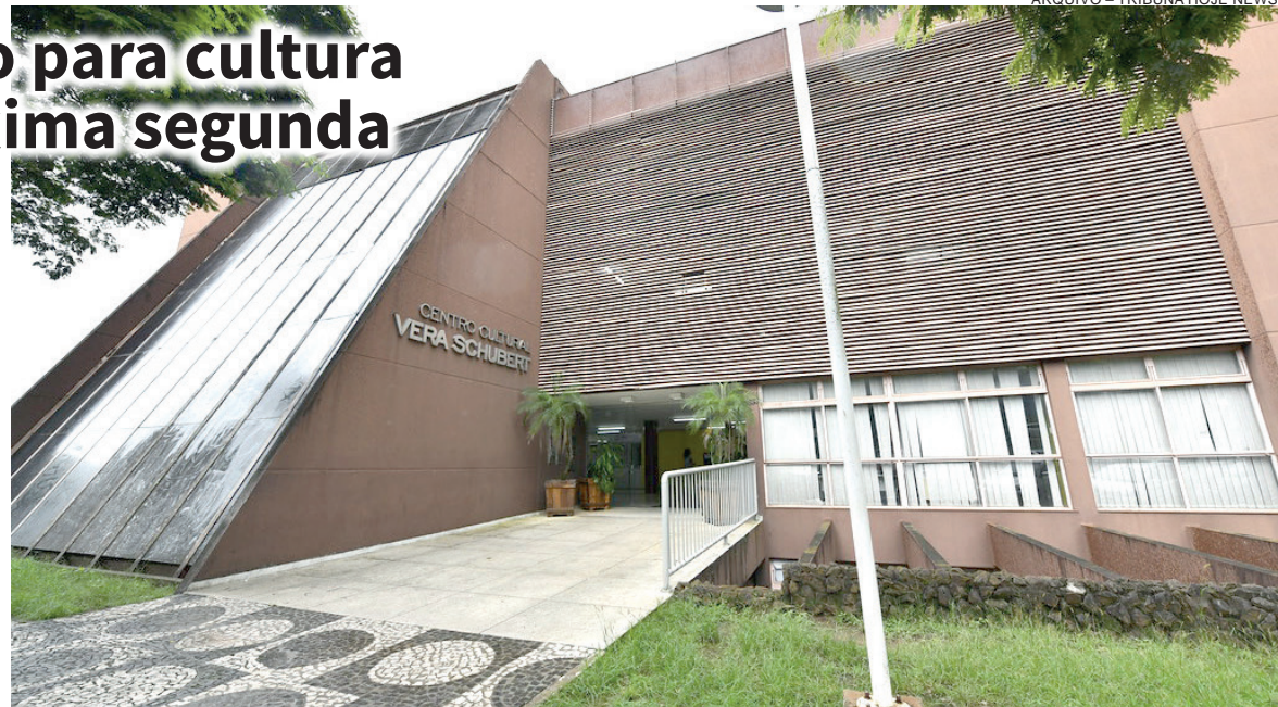
A PRINCIPAL finalidade do projeto é garantir a contratação de assessoria técnica especializada para apoiar a execução das ações culturais vinculadas à PNAB

A principal finalidade do projeto é garantir a contratação de assessoria técnica especializada para apoiar a execução das ações culturais vinculadas à Política Nacional Aldir Blanc (PNAB). Instituída pela Lei nº 14.399/2022, a chamada Lei Aldir Blanc 2 criou um programa permanente de financiamento à cultura em todo o país, com repasses regulares da União para estados e municípios. A iniciativa surgiu como desdobramento das políticas emergenciais adotadas durante a pandemia de Covid-19, quando o setor cultural foi um dos mais impactados.