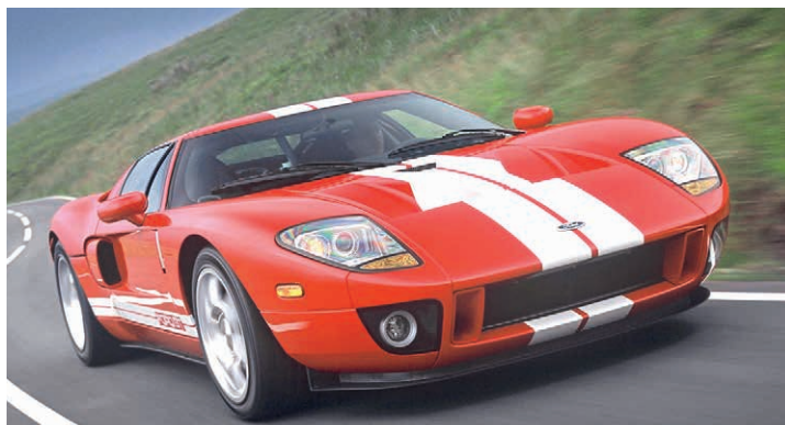
Ford GT 2004