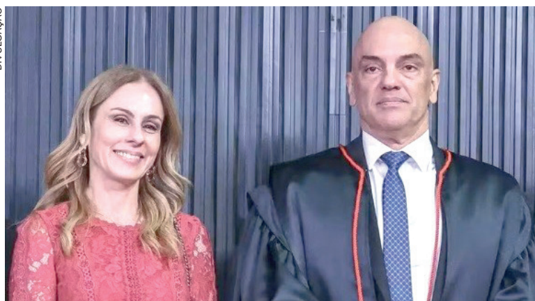
LEVANTAMENTO aponta compra de R$ 23,4 milhões em imóveis entre 2021 e 2025

No total, a família acumularia 17 imóveis, avaliados em aproximadamente R$ 31,5 milhões. O montante representa um crescimento significativo em comparação aos R$ 8,6 milhões declarados até 2017, ano em que Moraes assumiu uma