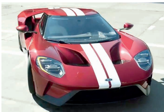
Ford GT 2017

Foram localizados mais de 300 veículos na Inglaterra, Austrália e Alemanha, mas na América do Norte a empresa historicamente não preservava modelos de produção. Os veículos da frota de imprensa, usados por jornalistas para avaliações, geralmente eram vendidos após seu período de uso.