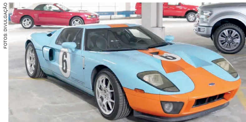
Ford GT Heritage Fleet 1966

A empresa é conhecida por doar sua coleção de veículos ao The Henry Ford Museum ao longo dos anos. E a maioria dos veículos-conceito clássicos foi vendida em leilão pela Christie's na comemoração do centenário da Ford em 2003, com a renda revertida para caridade.