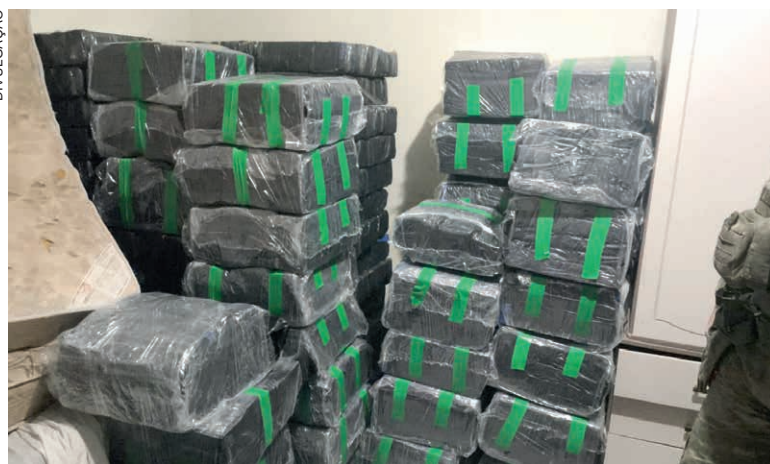
DROGA estava em um local usado como depósito e foi descoberto após monitoramento policial

Diante das informações, os policiais se deslocaram até o endereço indicado, onde realizaram a abordagem. Durante as buscas no imóvel, os agentes localizaram, em um dos quartos, diversos fardos de maconha. Após a pesagem, a droga totalizou cerca de 1,4 tonelada, configurando uma das maiores apreensões recentes na região.