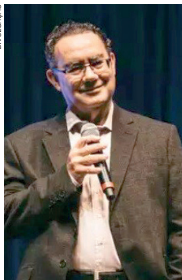
AUGUSTO Cury anunciou sua pré-candidatura à Presidência pelo partido Avante, destacando uma proposta baseada em projetos e sem ataques pessoais

"Meu objetivo é contribuir para a construção do Brasil dos nossos sonhos. Não amo o poder, não preciso do poder e não busco o poder pelo poder. Não se trata de um projeto pessoal, mas de uma jornada. Uma jornada 100% baseada em projetos e 0% de ataques pessoais", escreveu.