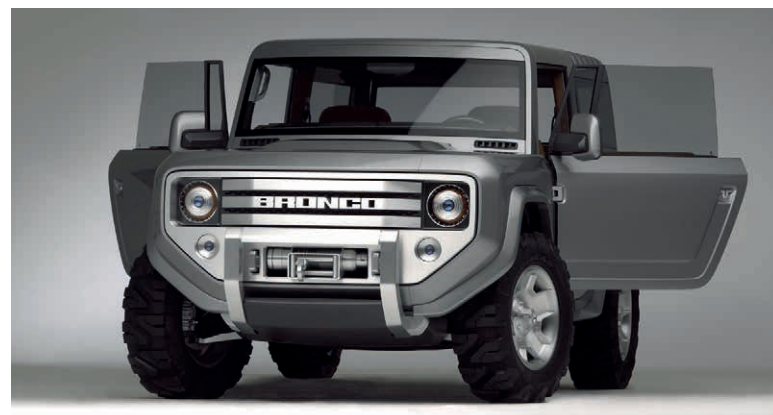
Ford Bronco Concept 2004

“Histórias semelhantes surgiram ao longo da pesquisa e reunimos uma coleção muito boa de veículos. A melhor parte é que todos foram salvos porque as equipes reconheceram o significado histórico desses modelos”, explica Ryan.