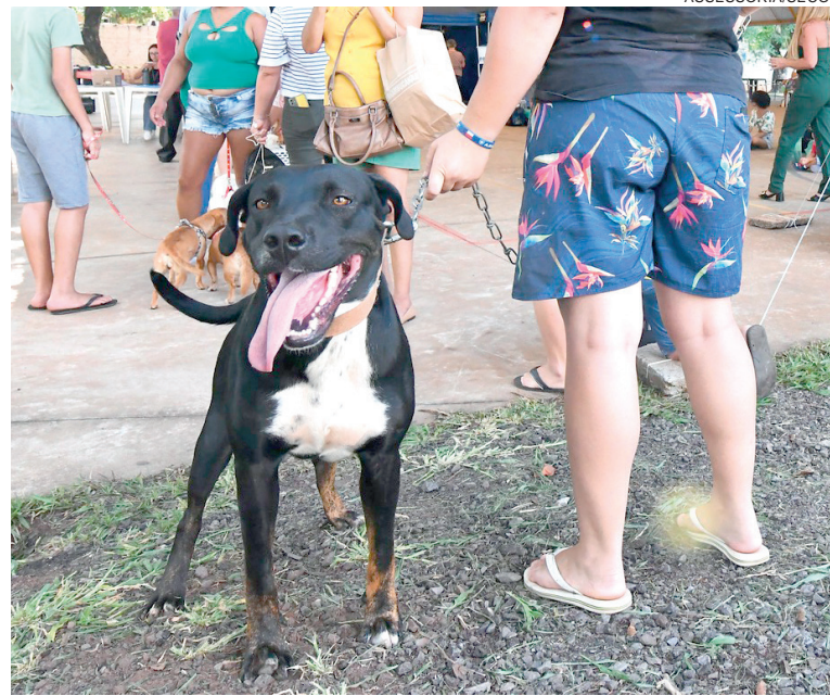
A VACINAÇÃO contra a raiva é considerada fundamental para a saúde animal e humana, uma vez que a doença é grave e pode ser transmitida ao homem

Com a campanha, o município pretende ampliar a cobertura vacinal, reduzindo riscos e fortalecendo as políticas públicas de prevenção de zoonoses.