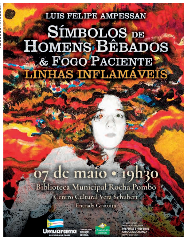
SÃO DOIS livros em um. O primeiro é uma narrativa abstrata que personifica um momento da sua vida. O outro livro é uma coleção de poemas e ilustrações

O outro livro é uma coleção de poemas e ilustrações, um passeio pelos cantos mais desesperados, viscerais e