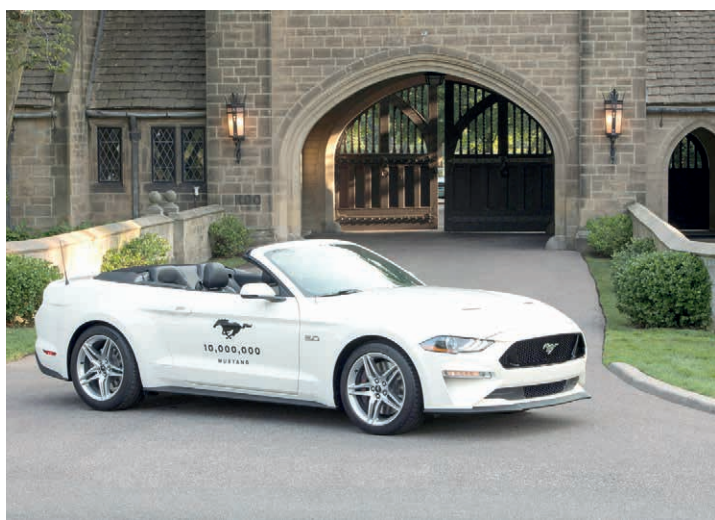
Ford Mustang Conversível