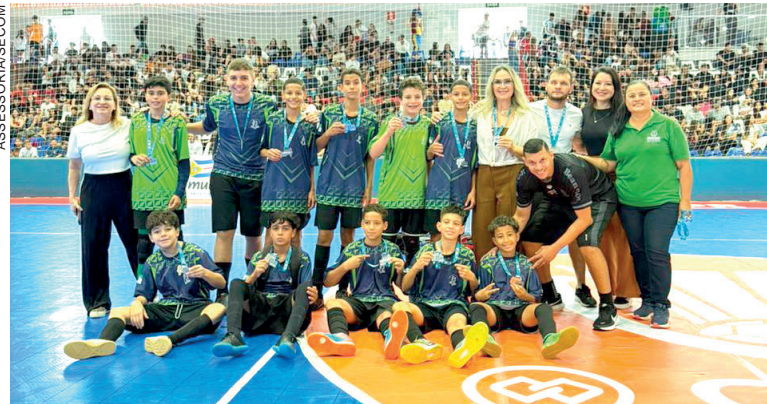
ALÉM das disputas em quadra, a competição também promoveu integração entre os alunos, fortalecendo vínculos entre jovens de diferentes escolas

Organizada pela Secretaria Municipal de Esportes e Lazer (Smel), com apoio do Núcleo Regional de Educação e da Unipar, por meio do curso de Educação Física, a competição contou com partidas de vôleibol, handebol, futsal e basquetebol. Os jogos aconteceram