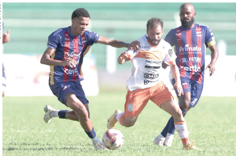
TOLEDO busca recuperação para seguir com chances na Segundona

“Conseguimos construir, a bola passa da frente do gol várias vezes, mas ninguém finaliza. Isso tem a ver com pre-