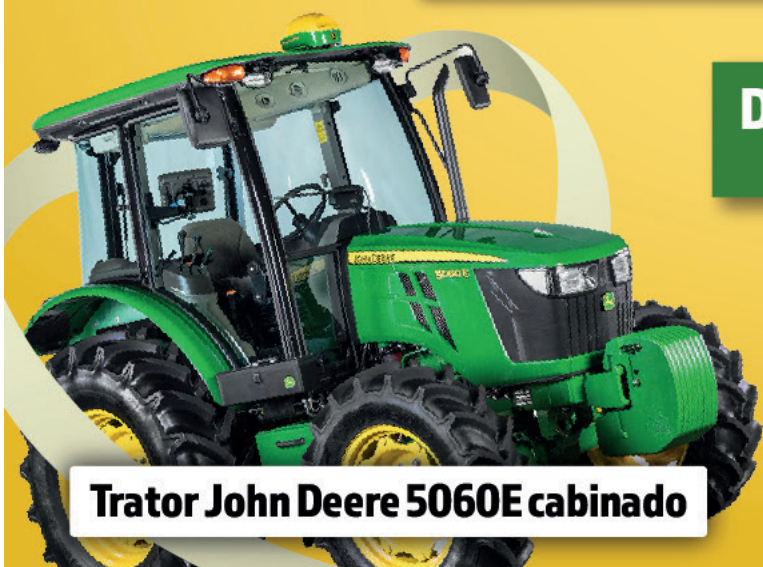
Trator John Deere 5060E cabinado