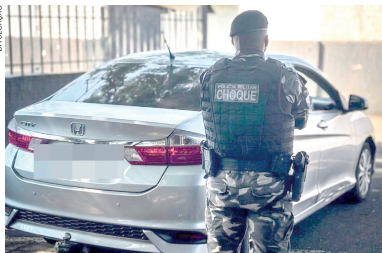
A OCORRÊNCIA teve início quando o serviço de inteligência identificou a circulação do Honda City com indícios de irregularidade

Durante a abordagem, a verificação revelou uma situação mais complexa. O Honda City circulava com placa falsa, em uma tentativa de mascarar a verdadeira identidade do veículo. Ao aprofundar a checagem, os policiais constataram que se tratava de uma “dobra”: o carro havia sido montado com peças de dois veículos