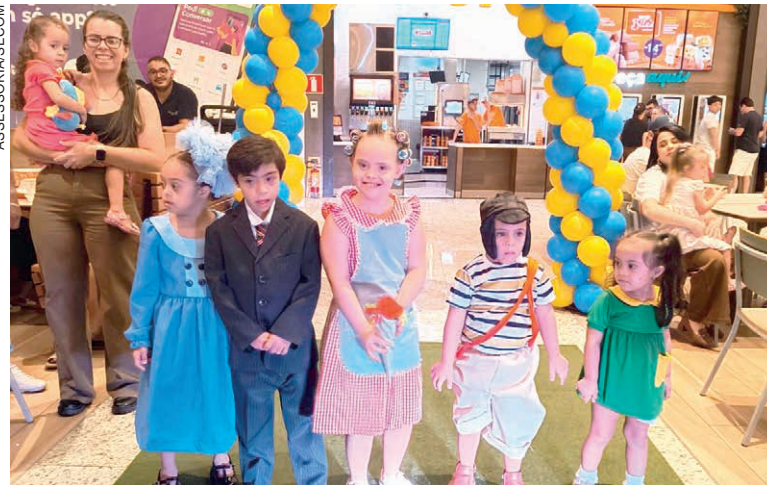
A PROGRAMAÇÃO foi marcada por momentos de emoção e integração. Para muitas famílias, o encontro representou mais do que um evento

Outro ponto de destaque na vida do influenciador é o recente convite para visitar a fábrica da montadora BYD, na China, reconhecimento que simboliza o alcance de sua história e o impacto positivo de sua atuação.