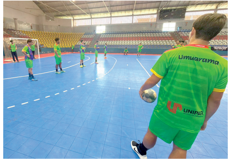
A PROPOSTA é aproximar os jovens atletas das escolinhas de handebol da realidade das competições de alto rendimento

Além de fortalecer o esporte de alto rendimento, a realização da etapa reforça o papel de Umuarama como referência regional na organiza-