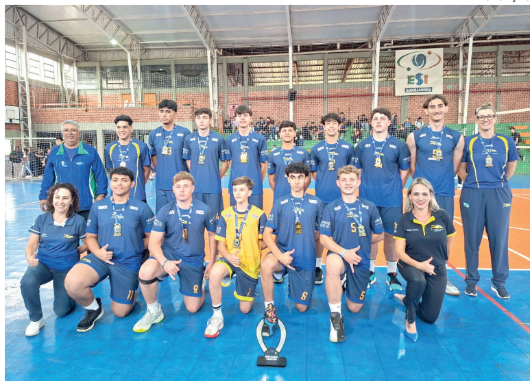
São Cristóvão faturou título e confirmou excelência do trabalho com o voleibol

As finais do masculino acontecem na sequência. Na categoria 12-14 anos, o título será definido entre C.E. Jardim Interlagos e Passo Certo, enquanto na categoria 15-17 jogam Colégio Adventista e C.E. Julia Wanderley. Também serão disputadas, a partir de hoje, as modalidades de Atletismo, Taekwondo, Tênis de Mesa e Xadrez.