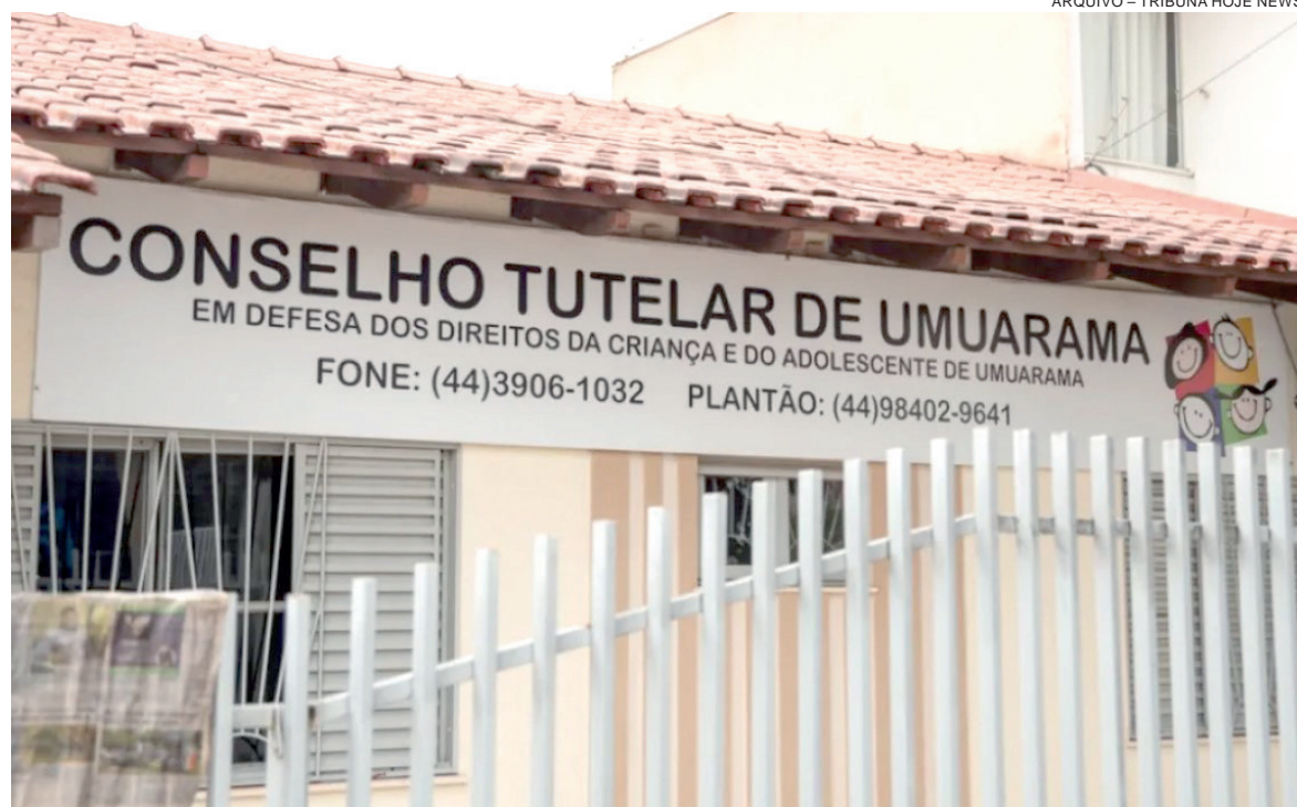
AS QUEIXAS indicavam situações semelhantes sendo tratadas de forma diferente, além da falta de orientação objetiva nos atendimentos

Outro ponto central da decisão é a exigência de fundamentação em todas as respostas. A prática de negativas genéricas, sem explicação formal, foi expressamente proibida. Caso haja indeferimento sem justificativa adequada, a conduta poderá ser considerada irregular, sujeitando o