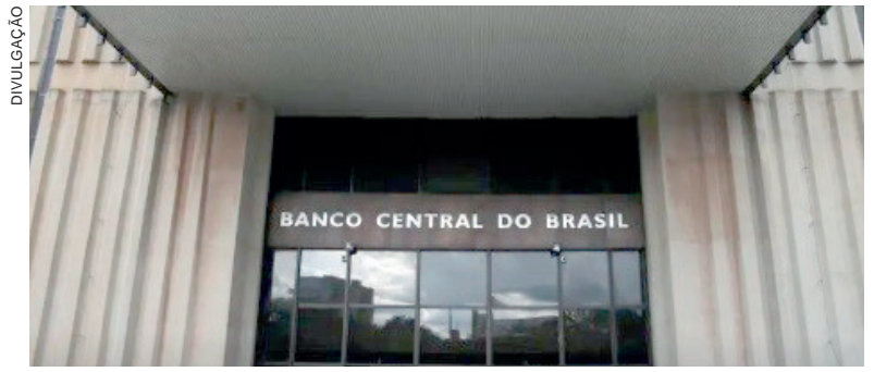
COMPROMETIMENTO financeiro e risco a credores motivaram decisão

O BC informou que continuará tomando todas as medidas cabíveis, dentro de suas competências, para apurar as responsabilidades da crise na Creditag. O resultado poderá levar à aplicação de sanções administrativas e a comunicação às autoridades competentes, se aplicáveis.