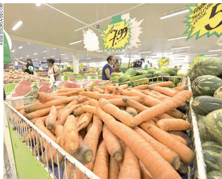
AS MAIORES altas foram verificadas nos preços da cenoura (63%), da banana-nanica (37%), da batata (31%) e do detergente líquido (27%)

Considerando a diferença de preços do mesmo produto entre os supermercados pesquisados, ou seja, o quanto pode economizar o consumidor que pesquisa, antes de fazer suas compras, foram notados percentuais significativos em vários produtos, como ovos brancos (160%) – com a dúzia variando de R$ 4,99 a até R$ 12,99 –, erva mate (137%) e café torrado e