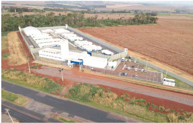
OBRAS nas 28 unidades socioeducativas do Estado serão feitas com recursos do Fundo para a Infância e Adolescência (FIA)