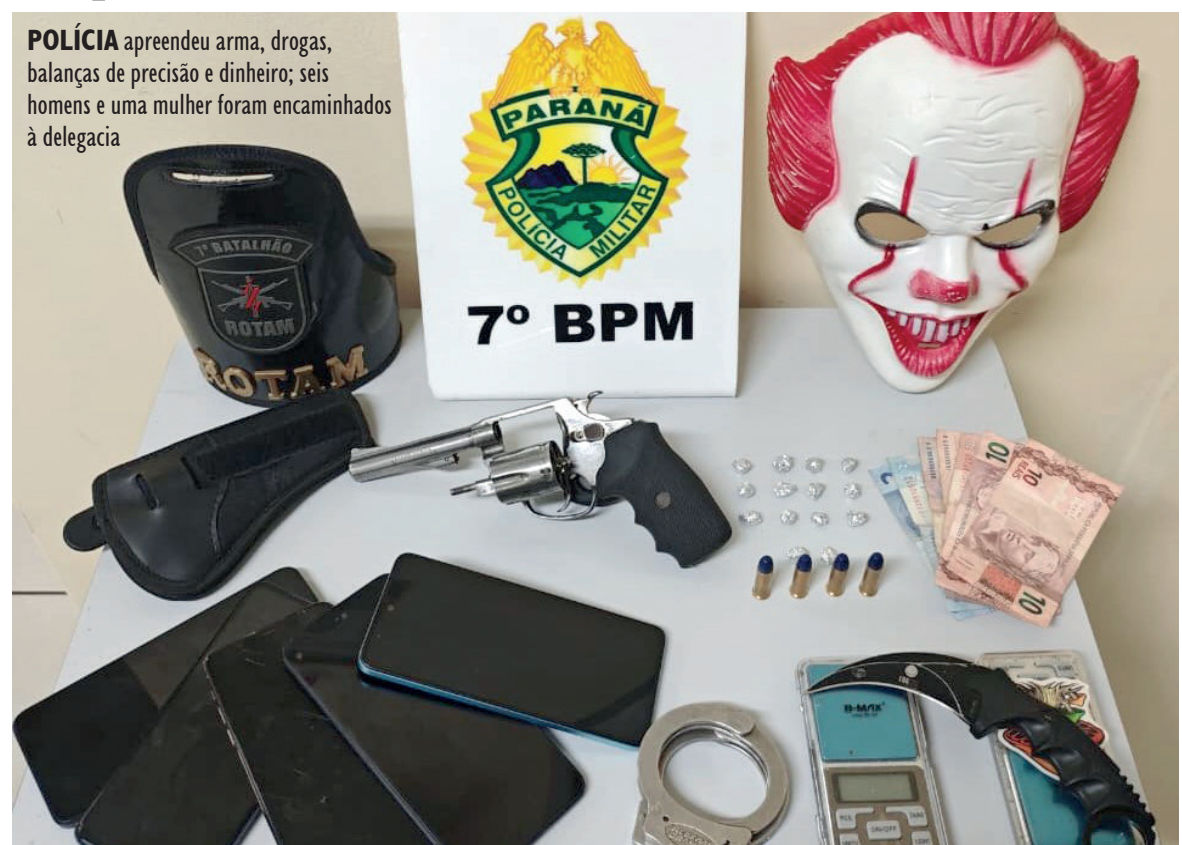
POLÍCIA apreendeu arma, drogas, balanças de precisão e dinheiro; seis homens e uma mulher foram encaminhados à delegacia

Após diligências, ele foi localizado em uma das casas, ainda tentando se evadir, sendo finalmente contido pela equipe. Conforme a PM, o indivíduo apresentava lesões decorrentes da fuga