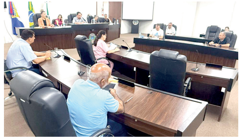
PARLAMENTARES analisaram a proposta do Poder Executivo e aprovaram o projeto em dois turnos na tarde de ontem

Outro ponto destacado é o caráter simbólico do ganho real, ainda que pequeno, representando um avanço além da simples reposição inflacionária. A administração municipal ressalta que a medida busca valorizar o funcionalismo público e manter o equi-