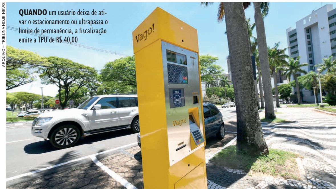
QUANDO um usuário deixa de ativar o estacionamento ou ultrapassa o limite de permanência, a fiscalização emite a TPU de R$ 40,00

Quando um usuário deixa de ativar o estacionamento ou ultrapassa o limite de permanência, a fiscalização emite uma Tarifa Pós-Utilização (TPU) de R$ 40,00. O motorista tem 10 dias úteis para regularizar a situação e se não o fizer, ela é convertida em infração grave, conforme o artigo 181 do Código