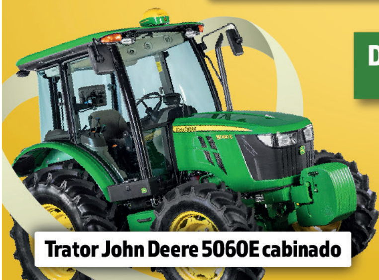
Trator John Deere 5060E cabinado