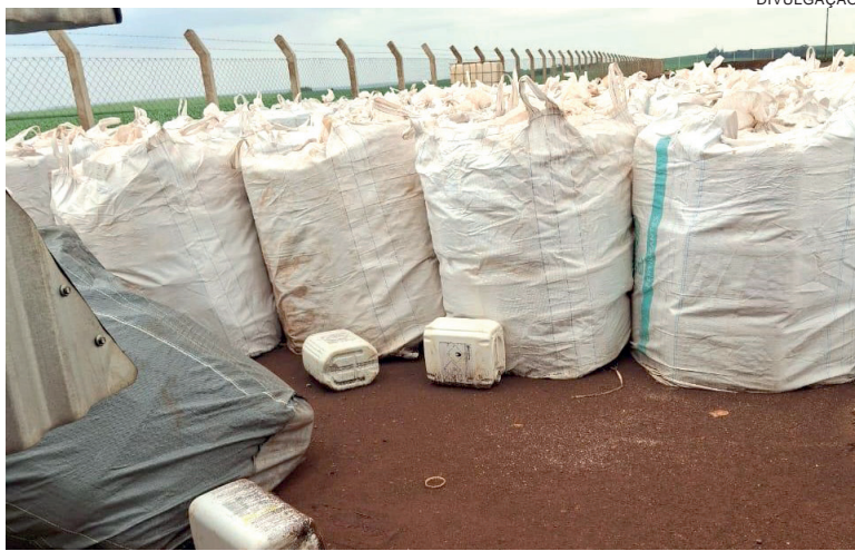
FOI CONSTATADA a reutilização das embalagens para alimentação de animais, prática proibida pela legislação sanitária devido ao alto risco de intoxicação

Durante os quatro dias de diligências, foram identificadas irregularidades em 21 propriedades, principalmente relacionadas ao armazenamento inadequado de embalagens vazias de agrotóxicos.