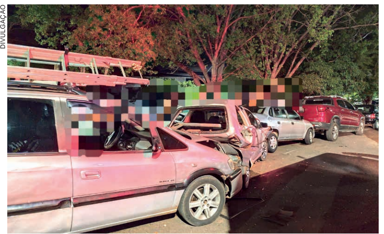
O MOTORISTA teria sido esfaqueado em um estabelecimento onde estava pouco antes da colisão

Informações coletadas pelos PMs deram conta de que