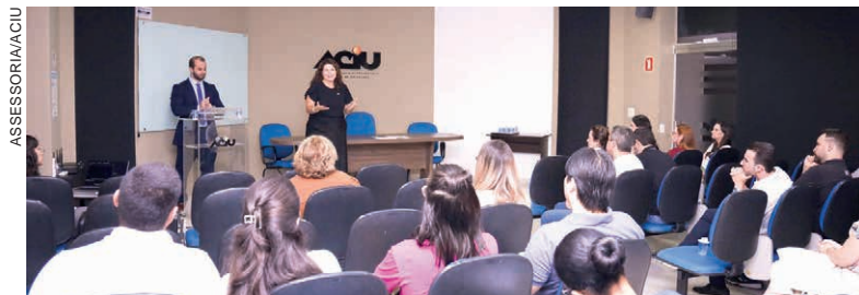
REAJUSTE de mensalidades colocado para apreciação também foi aprovado pelos participantes de assembleia

A Associação Comercial, Industrial e Agrícola de Umarama (Aciu) deu um passo decisivo rumo à modernização de sua estrutura interna ao aprovar, em assembleias realizadas na semana passada, mudanças profundas em seu estatuto e a prestação de contas referente ao exercício financeiro de 2025. As deliberações foram aprovadas por unanimidade pelos associados, consolidando um novo ciclo de governança e organização da entidade.