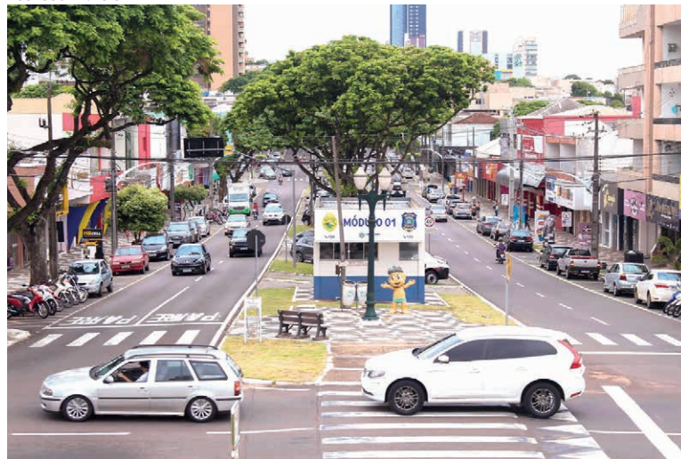
A INTENÇÃO é estruturar um movimento organizado, capaz de impulsionar o varejo, fortalecer a economia e criar um ambiente mais competitivo entre os empresários

mento estratégico e iniciativas que tragam impacto efetivo para os negócios locais.