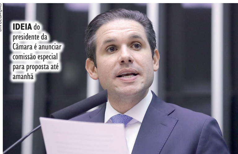
IDEIA do presidente da Câmara é anunciar comissão especial para proposta até amanhã

O governo federal chegou a articular a indicação de um nome para a relatoria, mas o fato de o texto já ter autoria governista pesou na decisão de Hugo Motta. Além disso, o Palácio do Planalto também demonstra interesse na presidência do colegiado, o que amplia a disputa política em