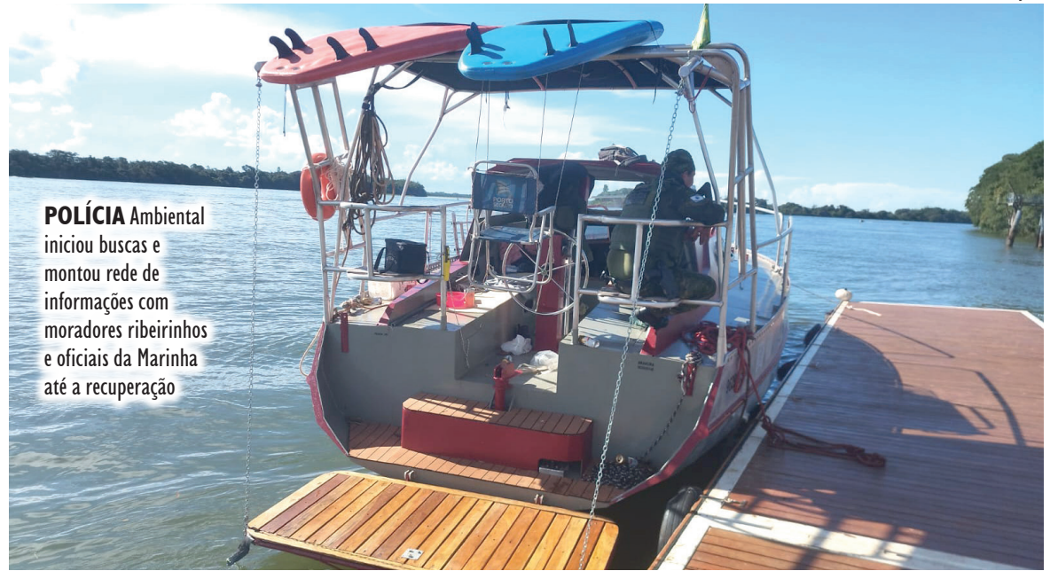
POLÍCIA Ambiental iniciou buscas e montou rede de informações com moradores ribeirinhos e oficiais da Marinha até a recuperação

de prisão e foi encaminhado à Polícia Civil do Paraná, em Loanda, junto com o veleiro e os materiais recuperados. Ele deve responder pelos cri-