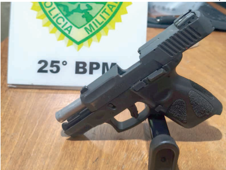
SUSPEITO foi encontrado em caminhonete no Jardim San Martin com sinais de embriaguez e arma posicionada entre as pernas