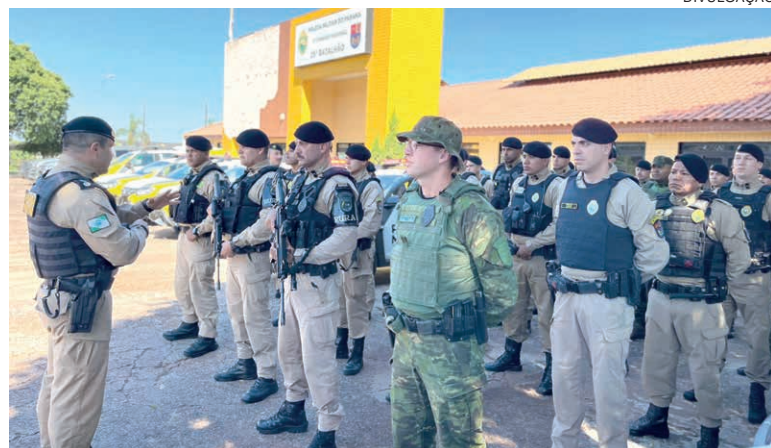
A OPERAÇÃO Omnis conta com o apoio de ferramentas tecnológicas de análise criminal e inteligência policial

A Operação Omnis integra um conjunto de ações permanentes da Polícia Militar do Paraná voltadas ao combate à criminalidade e ao fortalecimento da ordem pública. A expectativa é que a intensificação do policiamento gere impacto direto nos índices de segurança e contribua para um ambiente mais tranquilo para a população em todo o Estado.