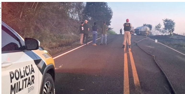
O ETANOL entrou em combustão, gerando chamas intensas e exigindo rápida atuação do Corpo de Bombeiros, que conseguiu conter o fogo e evitar que se alastrasse

Um acidente envolvendo carga inflamável mobilizou equipes de emergência e interditou totalmente a PR-323, em Cruzeiro do Oeste, na tarde da quarta-feira, (22). Um caminhão transportando 22 mil litros de etanol tombou às margens da rodovia e provocou um incêndio de grandes proporções.