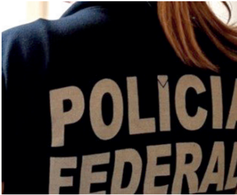
A MEDIDA acelera a reposição de servidores em áreas consideradas essenciais, além de trazer mais eficiência à administração pública

diferentes cargos da carreira policial. A maior parte das vagas é destinada ao cargo de agente, com 705 convocações. Em seguida aparecem os cargos de escrivão, com 176 vagas, e delegado, com 61. Também serão nomeados 38 peritos criminais federais e 20 papiloscopistas.