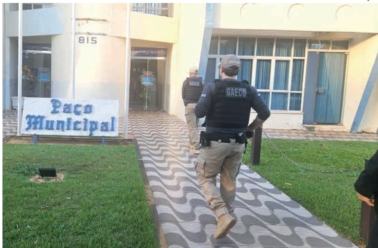
AS ORDENS judiciais foram expedidas pela Vara Criminal de Altônia e têm como principais alvos dois empresários, suspeitos de participação nas irregularidades

Todo o conteúdo recolhido será submetido à perícia técnica, com o objetivo de identificar eventuais provas de manipulação de processos públicos