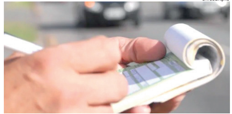
PROCEDIMENTO objetiva avaliar o fluxo de arrecadação e destinação das receitas obtidas pelo órgão com a aplicação das sanções

Outro eixo importante da auditoria será a verificação da existência e efetividade de planos de ação, rotinas de controle, mecanismos de monitoramento e critérios de transparência na destinação dos recursos. O Tribunal pretende examinar ainda o papel das estruturas internas de controle dos órgãos envolvidos e sua