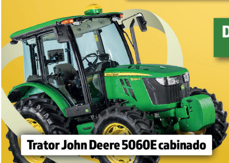
Trator John Deere 5060E cabinado

DOAÇÃO: R$2.000,00 com 25 chances de ganhar!