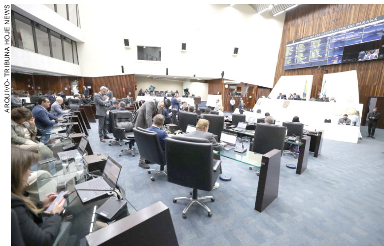
EM TRAMITAÇÃO na Alep, a proposta estabelece regras para instalação, fixação e manutenção dos equipamentos após tragédias recentes envolvendo crianças no Estado

Um dos episódios mais impactantes foi a morte de uma menina de apenas 3 anos, atingida por uma trave de futebol em um colégio particular no município de Prudentópolis. O caso gerou forte comoção