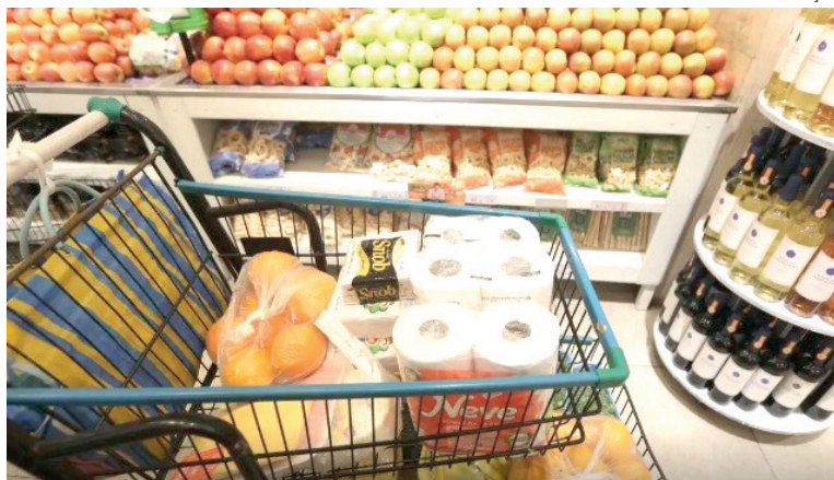
PÁSCOA e entrada de recursos na economia estimularam compras em março

Entre os produtos básicos, a principal elevação foi do feijão (+15,40%), seguido pelo leite longa vida (+11,74%). No acumulado do trimestre, o feijão subiu 28,11%, enquanto o leite longa vida avançou 6,80%.