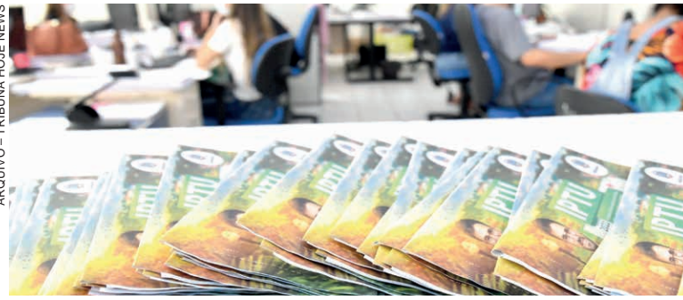
A AUDITORIA concentrou-se em cidades com população entre 10 mil e 20 mil habitantes, que, juntas, somam cerca de 1,4 milhão de moradores

Já na área operacional, a auditoria apontou falhas que impactam diretamente a eficiência da arrecadação. Em 86% dos municípios, a Planta Genérica de Valores (PGV) — base para cálculo de tributos imobiliários — não é revisada há pelo menos quatro anos. O levantamento também mostra que 80% das cidades não realizaram ações de fiscalização relacionadas ao Imposto sobre