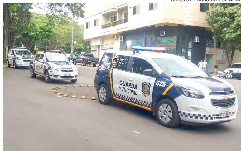
ARQUIVO – TRIBUNA HOJE NEWS

Na justificativa apresentada ao Legislativo, o Executivo destaca que a proposta tem como objetivo corrigir lacunas existentes na legislação anterior, reduzir interpretações subjetivas e alinhar a norma municipal aos princípios constitucionais da administração pública, como legalidade, impessoalidade, moralidade e eficiência. O texto também enfatiza que não há criação de uma nova carreira, mas sim o aperfei-