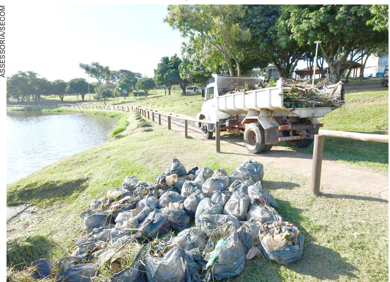
OS TRABALHOS incluem limpeza das margens, retirada de resíduos do leito do lago, roçada, poda de árvores, plantio de flores e instalação de placas educativas

Uma força-tarefa de limpeza e melhorias foi iniciada no Lago Aratimbó, em Umuarama, na semana passada, reunindo equipes de diversas secretarias municipais. A ação, acompanhada pelo prefeito Fernando Scanavaca, tem como objetivo revitalizar um dos principais cartões-postais da cidade e deve se estender até a conclusão dos serviços.