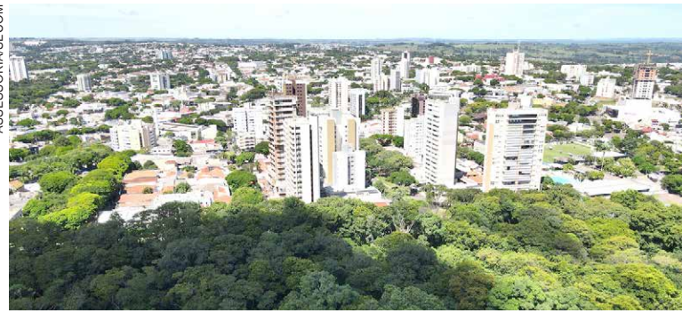
A INSTALAÇÃO de novas empresas movimenta o setor produtivo e impulsiona a criação de empregos diretos e indiretos, refletindo positivamente na renda das famílias

A lista inclui a duplicação do acesso pelo Parque Jabuticabeiras, pavimentação de estradas rurais que vão melhorar a segurança e o escoamento da produção rural, a duplicação da Estrada Bonfim – cujo projeto está avançando –, construção de novas unidades de saúde,