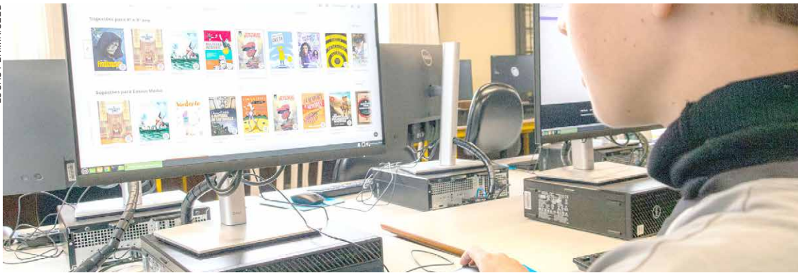
A SECRETARIA de Educação já estruturou nos últimos anos um conjunto de políticas e ferramentas que incorporam a tecnologia ao cotidiano escolar

Com destaque nacional nos indicadores educacionais, o Paraná também vem se posicionando na vanguarda quando o assunto é educação digital. Desde 2020, a rede estadual já incorpora tecnologias ao currículo escolar de forma estruturada, antecipando diretrizes que agora passam a ser oficialmente previstas no novo Plano Nacional de Educação (PNE), válido até 2036.