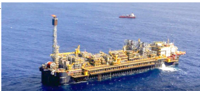
CHAMADA de Sul de Sapinhoá, área tem 460 quilômetros quadrados