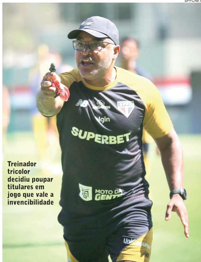
Treinador tricolor decidiu poupar titulares em jogo que vale a invencibilidade

O procedimento será acompanhado pelo ortopedista Lasse Lempainen, considerado referência em condutas cirúrgicas deste tipo, e demandará cerca de cinco meses de recuperação.