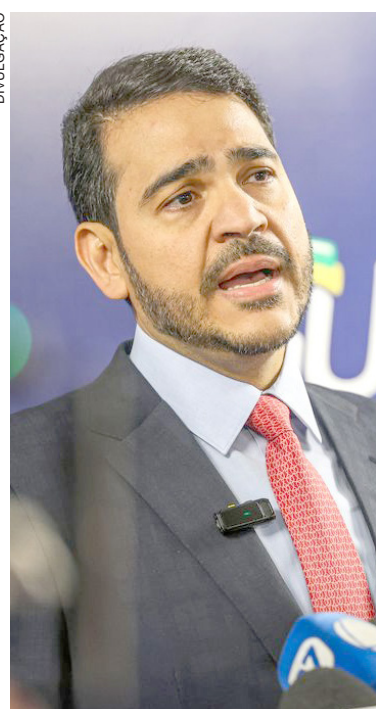
MESSIAS intensificou conversas com parlamentares e deve manter a agenda de articulações

Nos bastidores, aliados de Alcolumbre avaliam que o ambiente antes da sabatina é de cautela, com a leitura de que a ausência de obstáculos já representa avanço. Entre governistas, o clima é de maior tranquilidade em relação às semanas anteriores. O ministro da articulação política, José Guimarães, chegou a afirmar que o momento atual é mais