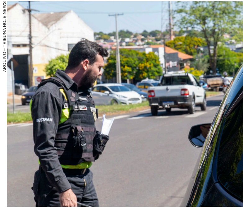
O DIREITO ficará restrito aos profissionais que atuam diretamente em atividades externas e de caráter ostensivo, como fiscalização, patrulhamento e operações viárias

Um dos pontos centrais da proposta é a autorização do porte de arma de fogo para agentes de trânsito. No entanto, a permissão não será ampla. De acordo com o substitutivo apresentado, o direito ficará restrito aos profissionais que atuam diretamente em atividades externas e de caráter ostensivo, como fiscalização, patrulhamento e operações viárias.