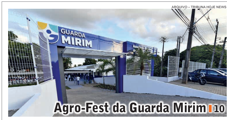
Agro-Fest da Guarda Mirim | 10