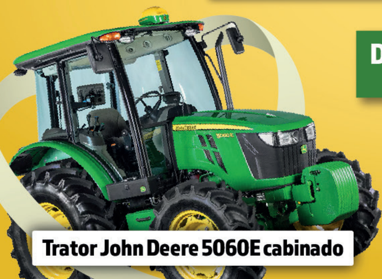
Trator John Deere 5060E cabinado

DOAÇÃO: R$2.000,00 com 25 chances de ganhar!