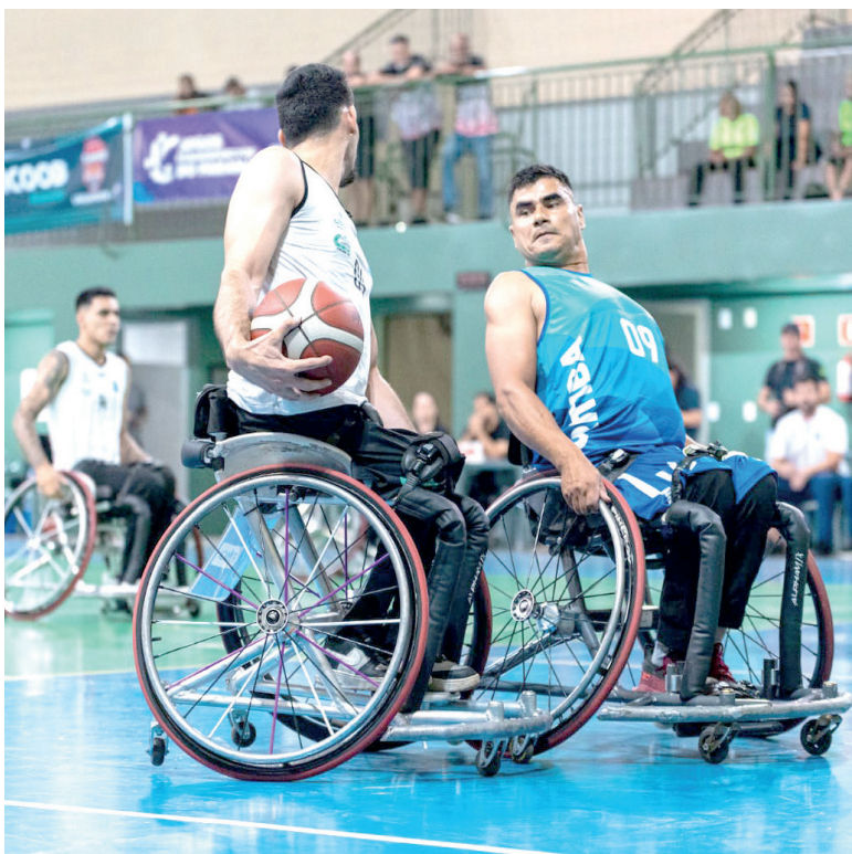
Com atletas de alto nível, Cascavel defende título em casa