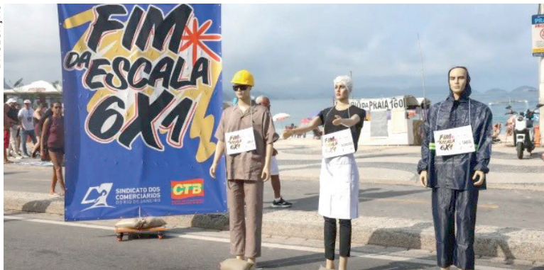
REDUÇÃO da jornada pode beneficiar 37 milhões de trabalhadores

Na prática, as PECs acabam com a escala de seis dias de trabalho por um de descanso (6x1). Se aprovados na comissão especial irão depois para votação no plenário.