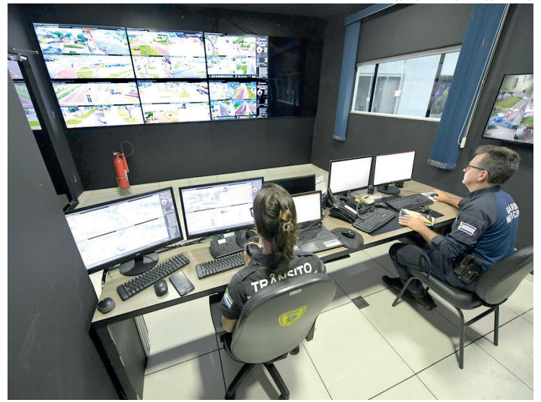
O PONTO considerado mais exigente da nova legislação é a promoção ao cargo de inspetor

A aprovação unânime do projeto demonstra consenso entre os vereadores sobre a importância da atualização das regras. Com isso, a proposta segue agora para sanção do Executivo municipal e, após a publicação, passará a vigorar como novo marco regulatório da carreira da Guarda Municipal em Umuarama.