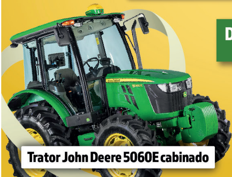
Trator John Deere 5060E cabinado

DOAÇÃO: R$2.000,00 com 25 chances de ganhar!