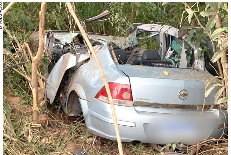
O CARRO seguia no sentido Pérola-Xambrê quando o condutor perdeu o controle, saiu à margem direita da pista e capotou. Não houve envolvimento de outros veículos

As circunstâncias que levaram à perda de controle da direção ainda não foram escla-