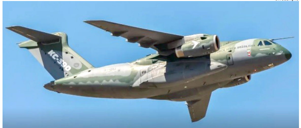
OBJETIVO é fortalecer a capacidade operacional de transporte militar

“O C-390 Millennium permitirá às Forças Armadas realizar ampla gama de missões, incluindo transporte de carga e tropas, operações de lançamento aéreo, assistência humanitária, evacuação aeromédica, operações em pistas não pavimentadas e total interoperabilidade com as forças nacionais, aliadas e parceiras”, afirma a Embraer.