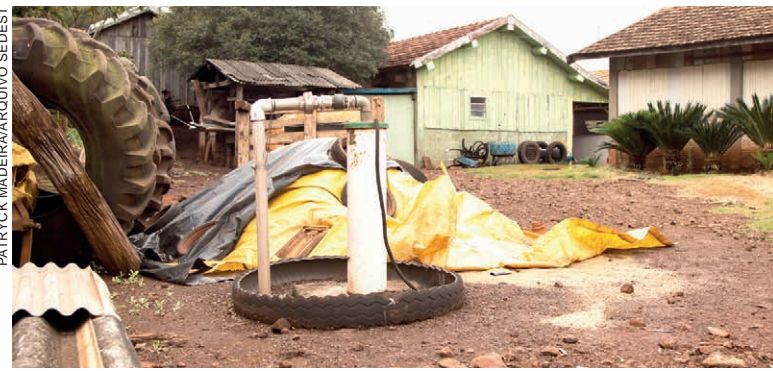
IAT VAI apresentar o programa que viabiliza a perfuração de poços artesanais em comunidades rurais do Paraná, durante o 3º Fórum Brasil das Águas

Além disso, o programa Água no Campo, iniciativa que viabiliza a perfuração de poços artesanais em comunidades rurais do Estado, será apresentado na quinta-feira (7) durante o painel "Boas práticas que fortalecem a Gestão dos Recursos Hídricos".