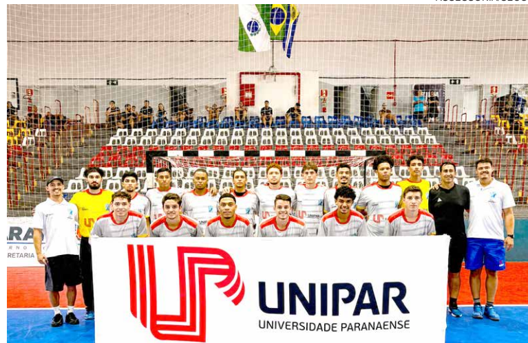
A EQUIPE umuaramense, que conta com importante parceria da Unipar, tem mantido o ritmo de treinamentos técnicos e táticos diários

“A equipe tem levado o nome da cidade em nível estadual e até nacional, funcionando como uma ferramenta