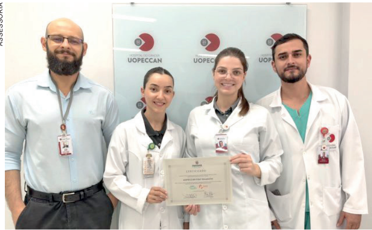
A CERTIFICAÇÃO segue as diretrizes da RDC nº 36/2013, normativa que estabelece ações obrigatórias para a promoção da segurança do paciente nos serviços de saúde

A certificação segue as diretrizes da RDC nº 36/2013, normativa que estabelece ações obrigatórias para a promoção da segurança do paciente nos serviços de saúde. O cumprimento integral desses critérios demonstra que a unidade mantém padrões rigorosos na prevenção de eventos adversos, no monitoramento de indicadores e na implementação de protocolos