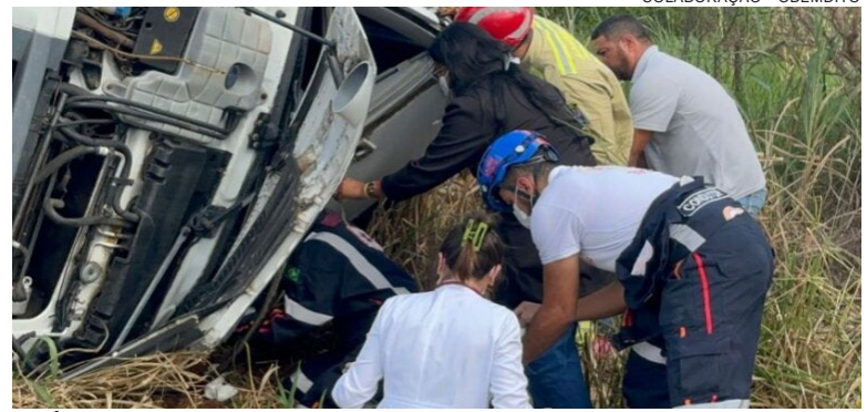
APÓS ser retirado das ferragens, o motorista recebeu os primeiros atendimentos ainda no local e, em seguida, foi encaminhado ao Hospital Uopecan

As causas do acidente ainda devem ser investigadas. O tombamento chamou a atenção de moradores e motoristas que trafegavam pela rodovia, provocando lentidão no trânsito durante o atendimento da ocorrência.