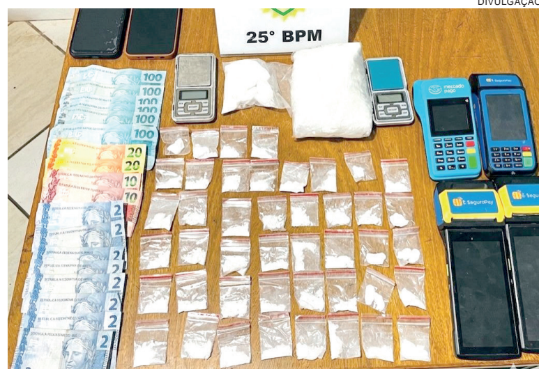
FORAM apreendidos 637,4 gramas, dinheiro, balanças de precisão, máquinas de cartão, celulares e uma moto

Com apoio de uma policial feminina, foram encontrados 11 invólucros com cocaína e R$ 102 em dinheiro. Depois, os PMs seguiram até a casa da mulher, na Rua Montevideu, onde loca-