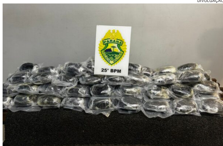
EM uma das carretas, foi encontrada uma grande quantidade de entorpecente

Na sequência da operação, a segunda carreta identificada