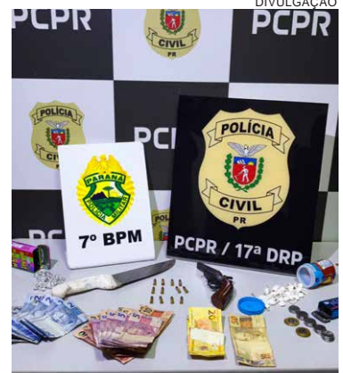
AÇÃO das polícias Civil e Militar no Jardim das Flores terminou com a apreensão de drogas, arma e de um adolescente

Além das drogas, os policiais localizaram uma arma de fogo do tipo garrucha, calibre .22, acompanhada de 12 munições do mesmo calibre. Também