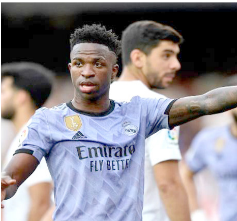
Vini Jr. se apresenta à Seleção Brasileira na próxima semana

Cascavel – O Real Madrid não vai contar com Vini Jr para os jogos finais de La Liga. O clube espanhol anunciou a liberação antecipada do atacante que foi convocado pelo técnico Carlo Ancelotti para defender o Brasil na Copa do Mundo. O Real não tem mais chances de ser campeão espanhol, então apenas cumpre tabela neste sábado (23), contra o Athletic Bilbao.