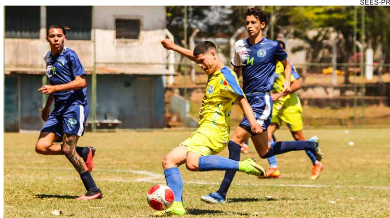
COMPETIÇÃO promovida pelo Governo do Estado registra aumento de 12,4% no número de atletas em relação ao ano passado

As partidas acontecem nas categorias Feminino 15+, Masculino Sub-16 e Sub-20, além