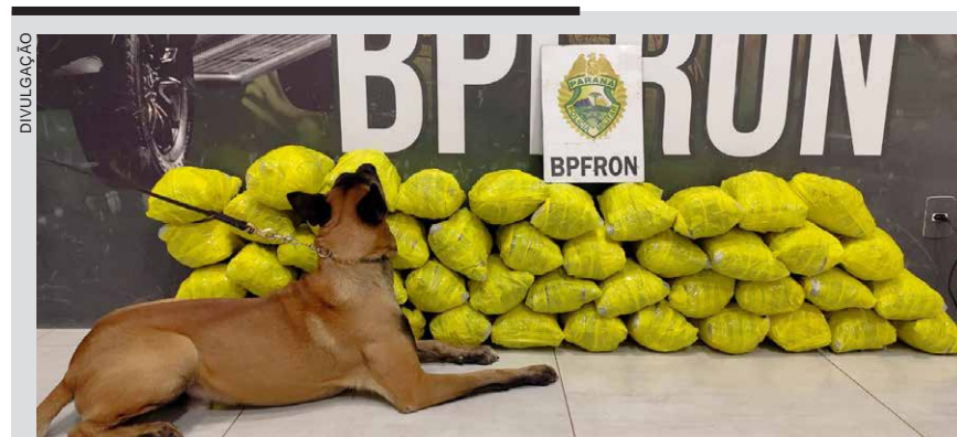
Uma ação do BPFロン resultou na apreensão de 20 quilos de maconha no Terminal Rodoviário de Umuarama. A droga foi localizada com auxílio do cão farejador Oslo durante uma operação de fiscalização realizada em um ônibus interestadual.

Segundo a Polícia Civil do Paraná, o homem confessou ser o proprietário da arma e admitiu já ter efetuado disparos anteriormente. Ele foi encaminhado à delegacia de Umuarama e permanece recolhido à disposição da Justiça.