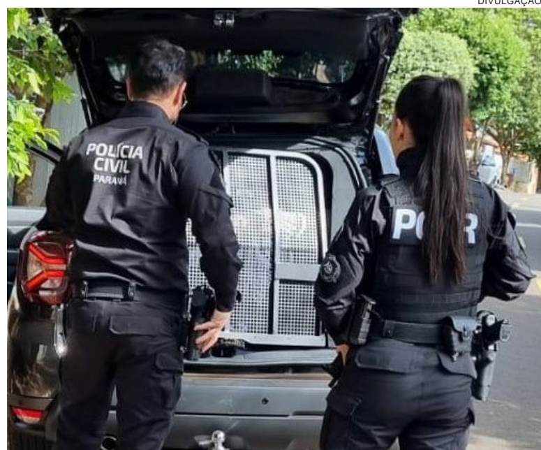
ORDEM judicial foi expedida após investigação relacionada a crimes praticados em novembro de 2025 envolvendo lesão corporal e agressão contra um adolescente

gação, o revólver foi levado inicialmente pelo irmão do suspeito, escondido em um casaco, e posteriormente entregue à irmã dos dois, numa tentativa de ocultar o armamento da polícia.