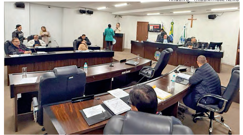
SE for aprovado em primeiro turno, o projeto seguirá para nova apreciação em plenário na próxima semana, antes de ser encaminhado para sanção do Executivo

Caso seja aprovado em primeiro turno pelos vereadores,